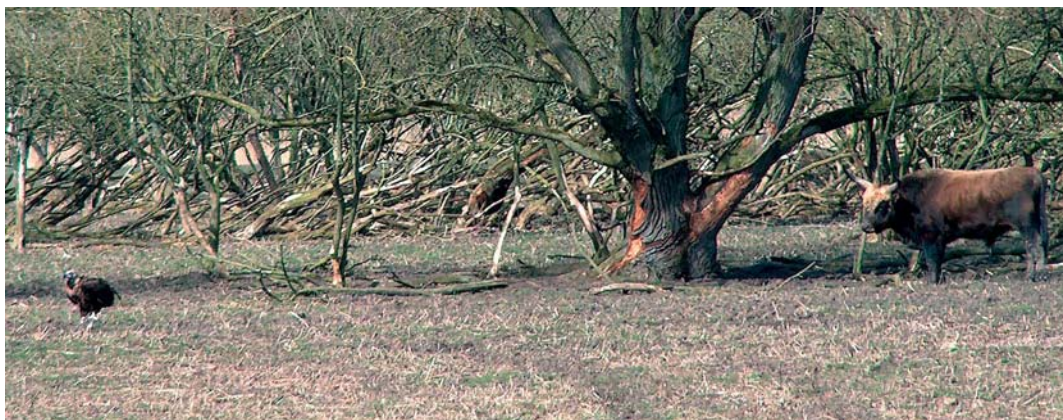
405 Monniksgier / Eurasian Black Vulture Aegypius monachus , adult vrouwtje ('Carmen'), Oostvaardersplassen, Flevoland, 21 maart 2005

Op 21 augustus werd Carmen tijdens een voor pers en publiek toegankelijke sessie in Naturalis ontleed en werd een begin gemaakt met het prepareren van de huid. De vogel zal worden opgezet en opgenomen in de collectie van Naturalis. Mede op verzoek van de BVCF werden door onderzoeksinstituut Alterra diverse monsters van het lichaam genomen ten behoeve van onderzoek aan de conditie, eventuele sporen van vergiftiging en de maaginhoud. Bij aanvang van de preparatie was het gewicht 7.62 kg. Een volwassen vrouwtje weegt volgens Ferguson-Lees & Christie (2001) 7.5-12.5 kg. De spanwijdte was c 2.65 m. De ontleding veroorzaakte opnieuw een grote toeloop van de media en werd vertoond in verschillende nieuwsrubrieken op televisie. Ook de schrijvende pers besteedde er ruim aandacht aan. De eerste resultaten van het verdere onderzoek gaven aan dat Carmen in goede conditie verkeerde met een ruime vetlaag (plaatselijk tot 2.5 cm dik). In de maag bevond zich een bijna volledige braakbal, vooral gevuld met rood haar (zeer waarschijnlijk van een Edelhert) en veel larven van vliegen; het