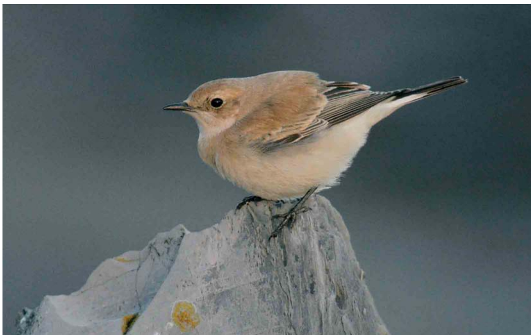
382 Westelijke Blonde Tapuit / Western Black-eared Wheatear Oenanthe hispanica , vrouwtje, Eemshaven, Groningen, 7 november 2004 ( Marten van Dijl )