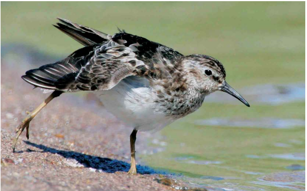
417 Least Sandpiper / Kleinste Strandloper Calidris minutilla , adult, South Milton Ley, Devon, England, August 2005 (John Lee)