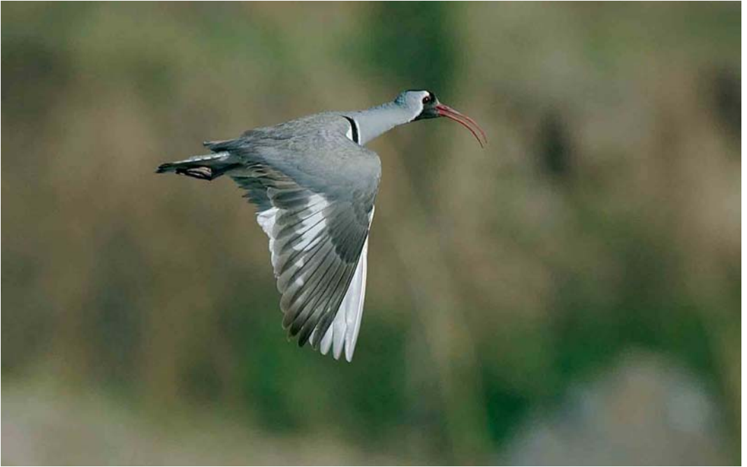
407-408 Ibisbill / Ibisnavel Ibidorhyncha struthersii , Baihe, north of Huairou, Beijing, China, 1 May 2005 (Bas van den Boogaard)