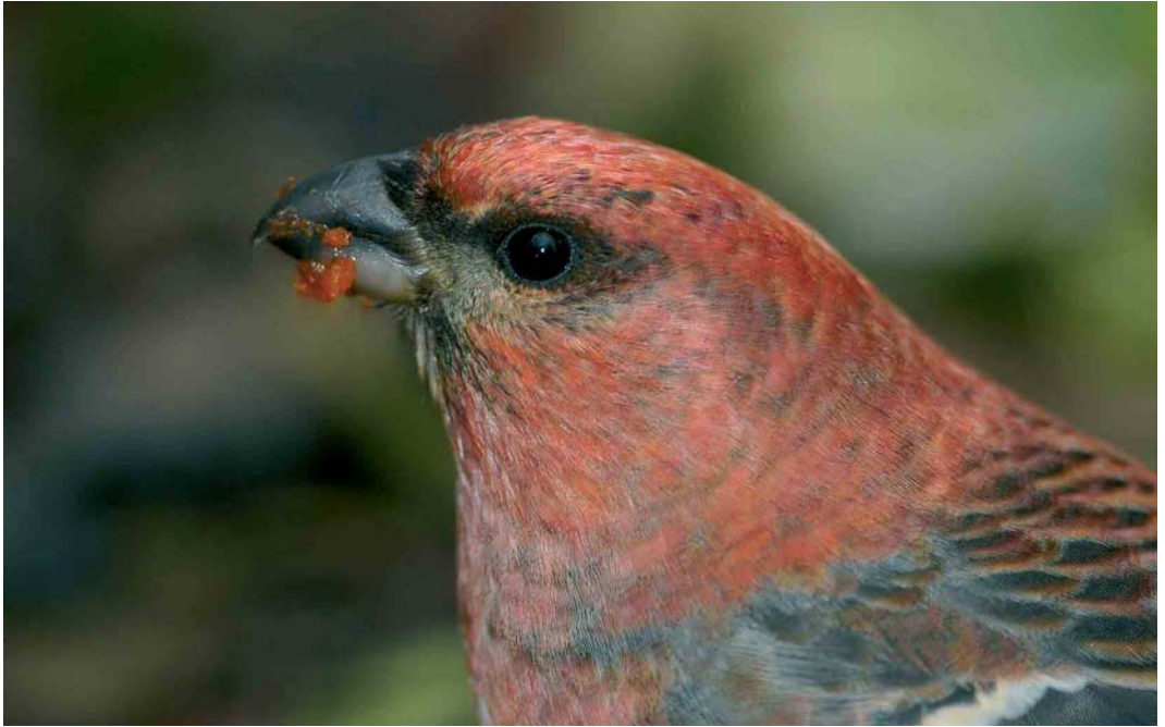
390 Haakbek / Pine Grosbeak Pinicola enucleator , adult mannetje, Beijum, Groningen, Groningen, 18 november 2004 (Marten van Dijl)