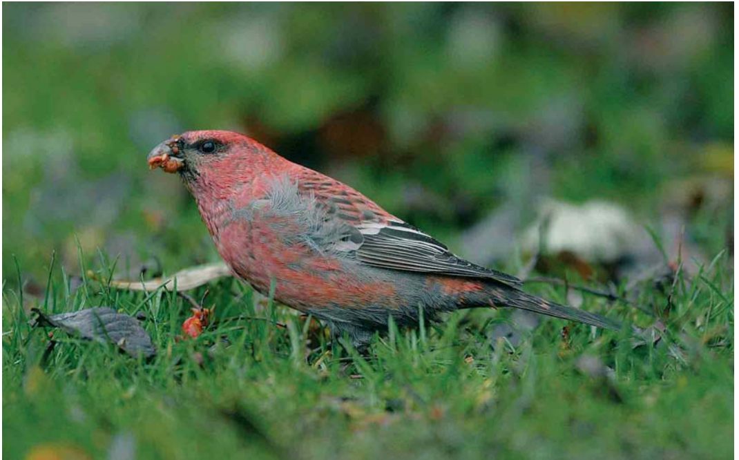
391 Haakbek / Pine Grosbeak Pinicola enucleator , adult mannetje, Beijum, Groningen, Groningen, 17 november 2004 (Chris van Rijswijk)