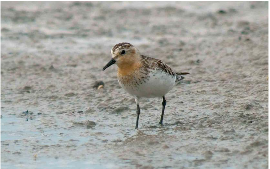
416 Red-necked Stint / Roodkeelstrandloper Calidris ruficollis , adult, Wagejot, Texel, Noord-Holland, Netherlands, 24 July 2005