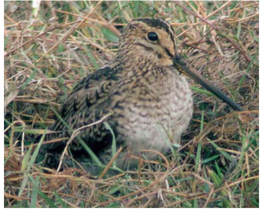
mystery photograph X (February)

Reed Bunting (3%). Those who overlooked the Emberiza tertial pattern, voted for Savannah Sparrow Passerculus sandwichensis (6%) and White-throated Sparrow Zonotrichia albicollis (3%).