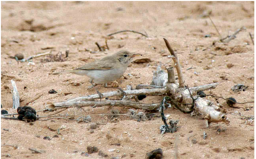
378 Western Olivaceous Warbler / Westelijke Vale Spotvogel Acrocephalus opacus , Sidi Rabat, Oued Massa, Souss, Morocco, 31 October 2003