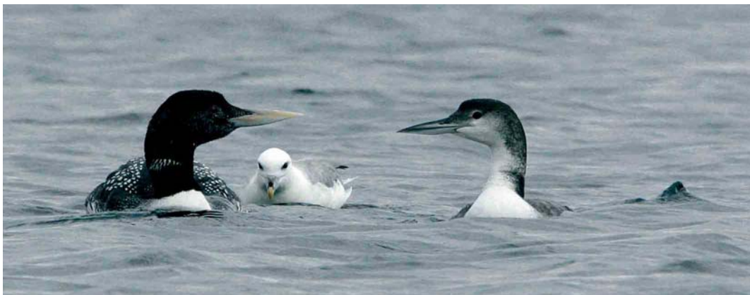
421 Spotted Sandpiper / Amerikaanse Oeverloper Actitis macularius , adult, Ølsemagle Revle, Sjælland, Denmark, 10 August 2005 422 Greater Sand Plover / Woestijnplevier Charadrius leschenaultii and Kentish Plover / Strandplevier C. alexandrinus , Boccasette, Po di Maistra, Veneto, Italy, 7 August 2005 423 Yellow-billed Loon / Geelsnavelduiker Gavia adamsii , with Great Northern Loon / IJsduiker G. immer and Northern Fulmar / Noordse Stormvogel Fulmarus glacialis , Holm Sound, Orkney, Scotland, 27 July 2005

c 60 Lesser Kestrels Falco naumanni , mostly juveniles and second-calendar-years, were watched and photographed near Santa Engracia, c 30 km west of Jaca, in the western Spanish Pyrenees. An Eleonora's Falcon F. eleonora flew over Baskemölla hamn, Skåne, Sweden, on 19 July. In Georgia, several Spotted Crakes Porzana porzana were singing at the Javakheti volcanic plateau on 21-22 July. In the Netherlands, the first proven breeding of Baillon's Crake P. pusilla intermedia since the 1970s took place this summer. A total of four families were observed in south-eastern Noord-Holland during August, two at Nieuwe Keverdijkse Polder and two at Polder Achteraf, while the number of singing individuals earlier this summer suggests that more families remained undetected. Both sites have been subject to recent changes in water level management, quickly resulting in colonisation by this species. On 17 August,