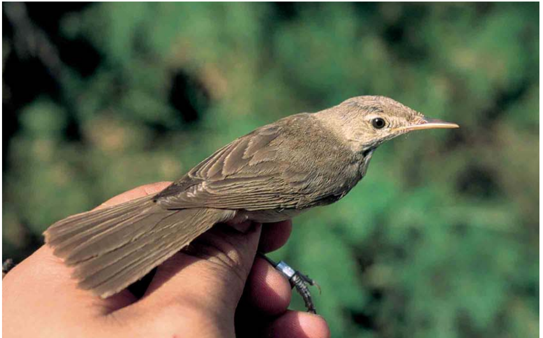
377 Western Olivaceous Warbler / Westelijke Vale Spotvogel Acrocephalus opacus , adult, Malaga, Andalucía, Spain, 14 July 2002 ( David Bigas )