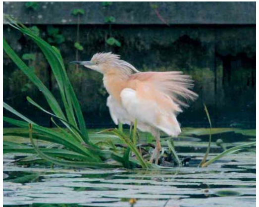
429 Grijze Strandloper / Semipalmated Sandpiper Calidris pusilla , adult, Wagejot, Texel, Noord-Holland, 25 augustus 2005 430 Bonapartes Strandloper / White-rumped Sandpiper Calidris fuscicollis , Scherpenissepolder, Zeeland, 28 juli 2005 431 Griel / Stone-curlew Burhinus oediacnemus , eerstejaars, Visvijverweg, Flevoland, 6 augustus 2005 432 Ralreiger / Squacco Heron Ardeola ralloides , Alblasserdam, Zuid-Holland, 2 juli 2005

langs de kust met van 20 juli tot 16 augustus 26 waarnemingen en nog één op 27 augustus. Camperduin was weer eens de beste plek met in totaal 15 (daarvan kan een aantal op dezelfde heen en weer vliegende vogel(s) betrekking hebben). Stormvogeltjes Hydrobates pelagicus werden opgemerkt op 1 juli bij Noordwijk aan Zee, Zuid-Holland, op 20 juli langs Camperduin en op 1 augustus langs Den Helder, Noord-Holland. Slechts één Kuifaalscholver Phalacrocorax aristotelis werd gemeld en wel op 30 juli bij Neeltje Jans, Zeeland. Een juveniele Woudaap Ixobrychus minutus liet zich op 18 en 19 augustus fraai bekijken bij Illikhoven, Limburg. Een andere vloog op 28 augustus langs Zeewolde, Flevoland. Het aantal bij Tienhoven, Utrecht, bleef dit (voor)jaar steken op drie (twee mannetjes en een vrouwtje), waaronder een mogelijk broedgeval. Her en der werden in totaal zeven Kwakken Nycticorax nycticorax gezien. Een