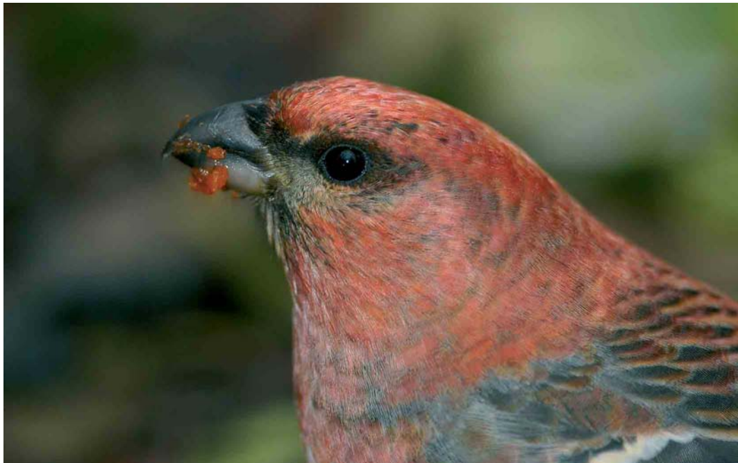
390 Haakbek / Pine Grosbeak Pinicola enucleator , adult mannetje, Beijum, Groningen, Groningen, 18 november 2004 ( Marten van Dijl )