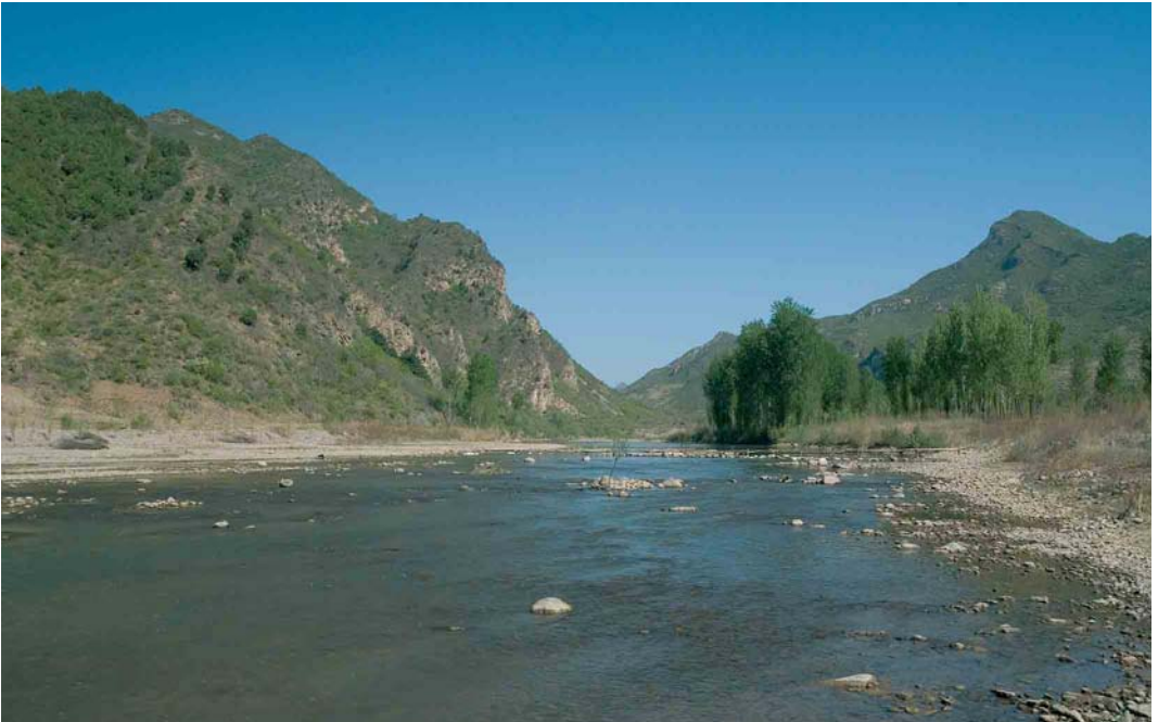
410 Habitat of Ibisbill / Ibissnavel Ibidorhyncha struthersii along Baihe, north of Huairou, Beijing, China, 1 May 2005 (Bas van den Boogaard)