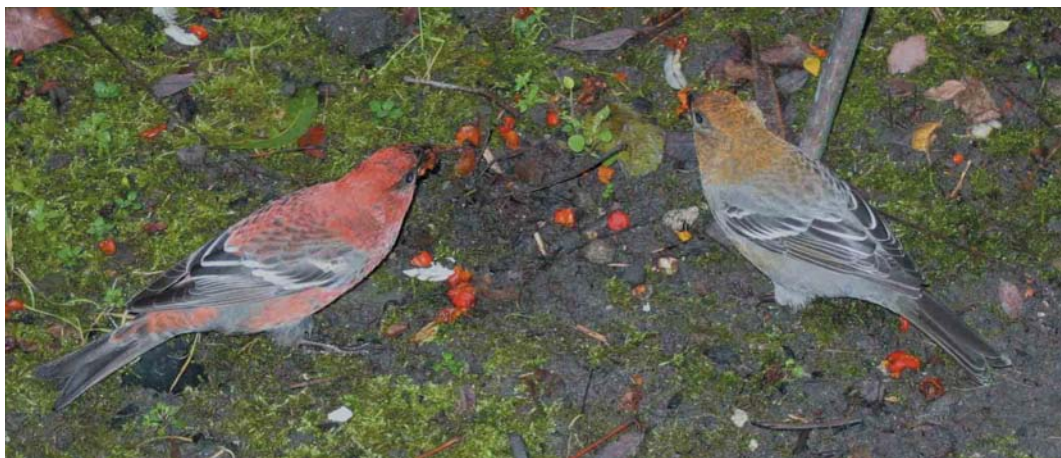
394 Haakbekken / Pine Grosbeaks Pinicola enucleator , adult mannetje en vermoedelijk adult vrouwtje, Beijum, Groningen, Groningen, 18 november 2004 (Roland Jansen) 395 Haakbekken / Pine Grosbeaks Pinicola enucleator , adult mannetje en vermoedelijk adult vrouwtje, Beijum, Groningen, Groningen, 17 november 2004 (Enno B Ebels)

foeragerend, meestal op de grond en soms in struiken tot enkele meters hoogte. Meestal dicht bij elkaar, vaak op minder dan 1 m onderlinge afstand. Foeragerend op bessen van Gewone Lijsterbes Sorbus aucuparia , zowel op afgevalen bessen op grasveld als aan boom; inhoud van bessen werd opgegeten (voornamelijk zaden), schil werd niet opgegeten. Beide vogels zeer tam, tot op minder dan 1 m en soms zelfs tot op enkele centimeters te benaderen. Vogels schijnbaar ongestoord door aanwezigheid van talloze waarnemers en fotografen. Wel alert bij langlopen van honden en katten, dan boom of struik invliegend en vaak roepend.