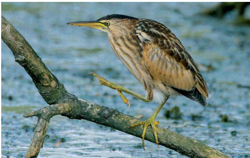
428 Woudaap / Little Bittern Ixobrychus minutus , juveniel, Illikhoven, Limburg, 18 augustus 2005