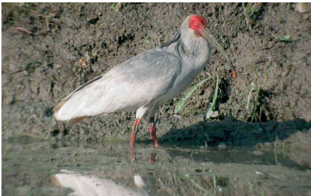
412 Crested Ibis / Japanese Kuifibis Nipponia nippon , adult, Yangxiang, Shaanxi, China, 17 May 2005 (Max Berlijn)