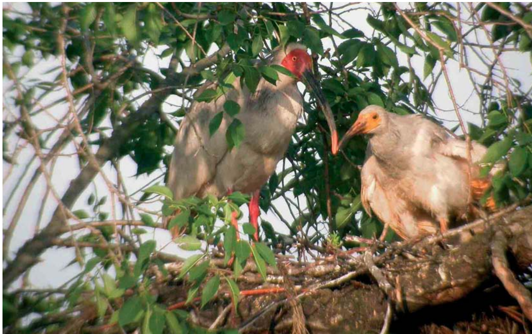
411 Crested Ibises / Japanese Kuifibissen Nipponia nippon , adult with young, Yangxiang, Shaanxi, China, 17 May 2005 (Max Berlijn)