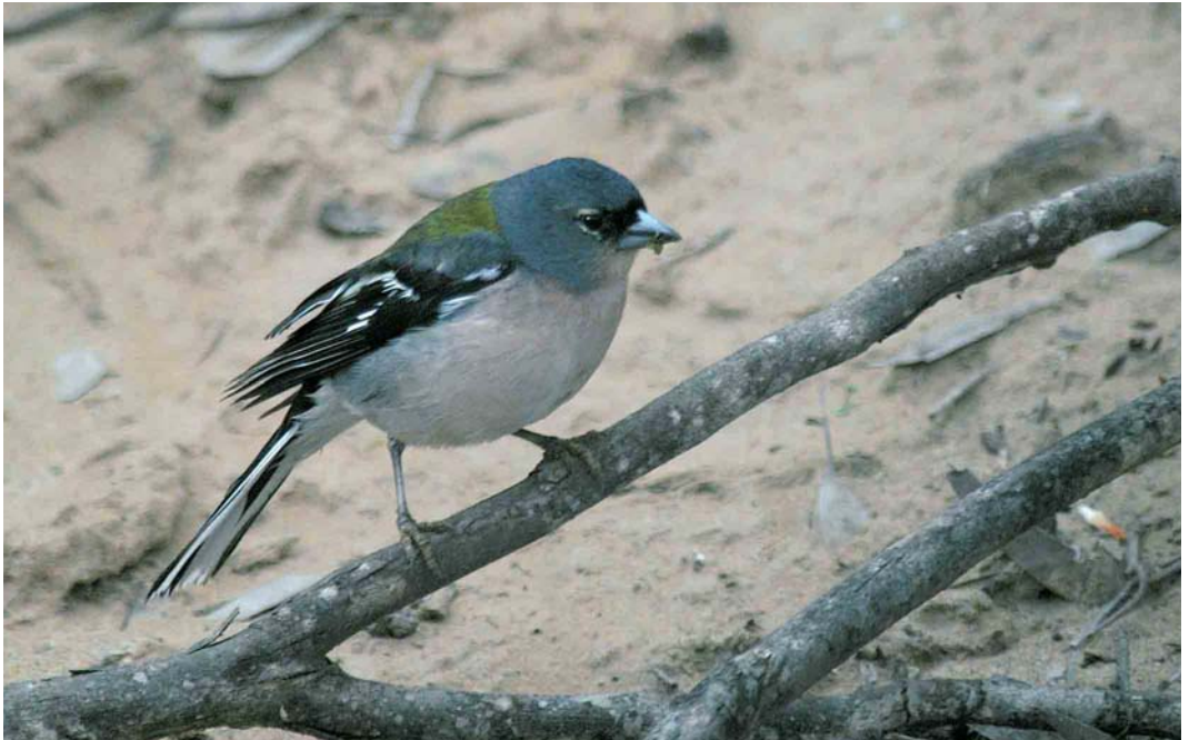
363 Atlas Chaffinch / Atlasvink Fringilla coelebs africana , male, Oued Massa, Souss, Morocco, 19 March 2004