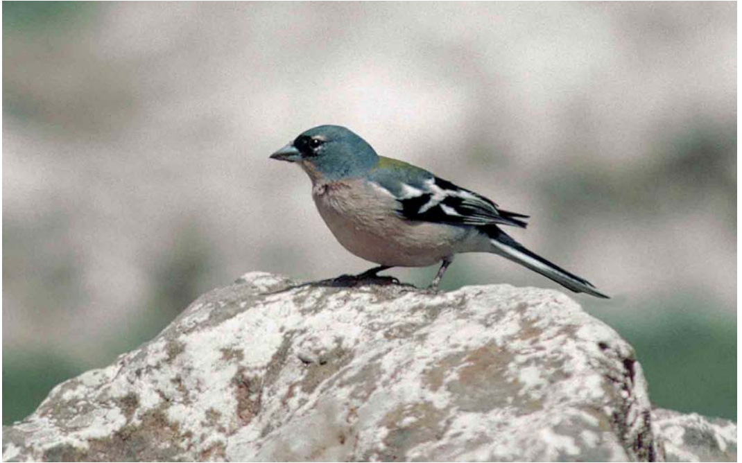
362 Atlas Chaffinch / Atlasvink Fringilla coelebs africana , male, Ifrane, Morocco, 27 March 2002 (Arnoud B van den Berg)