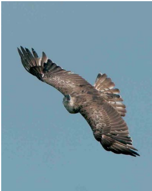
437 Slangenarend / Short-toed Eagle Circaetus gallicus (onder), met Buizerd / Common Buzzard Buteo buteo , Fochteloërveen, Friesland, 11 juli 2005 ( Jan Bosch ) 438 Slangenarend / Short-toed Eagle Circaetus gallicus , Fochteloërveen, Friesland, 11 juli 2005 ( Jan Bosch ) 439 Grote Burgemeester / Glaucous Gull Larus hyperboreus , eerste-zomer, Katwijk, Zuid-Holland, 2 september 2005 ( Menno van Duijn )