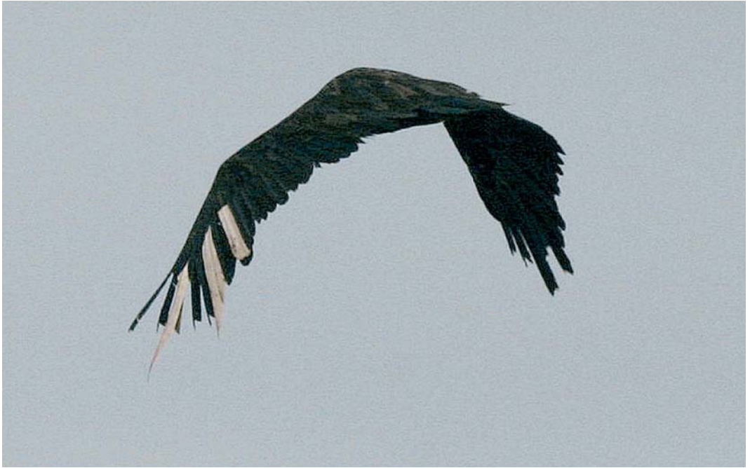
404 Monniksgier / Eurasian Black Vulture Aegypius monachus , adult vrouwtje ('Carmen'), Beers, Noord-Brabant, 17 maart 2005

Evelyn Tewes (in litt). Zij berichtte dat het om 'Carmen' ging, een adult vrouwtje Monniksgier dat op 2 mei 2003 als (vermoedelijk) wilde vogel in verzwakte toestand met vergiftigingsverschijnselen was binnengebracht bij een opvangcentrum in Extremadura, Spanje. Op 15 juli 2003 werd Carmen overgebracht naar het gierenstation van de Black Vulture Conservation Foundation (BVCF) op Majorca, Balearen, Spanje, en op 7 april 2004 met negen andere Monniksgieren overgebracht naar Les Baronnies, Drôme, Frankrijk. Dit is de tweede locatie (naast de Grandes Causses, Aveyron/Lozère) waar Monniksgieren in Frankrijk worden uitgezet. Na een verblijf van bijna 10 maanden in een acclimatisatiekooi werd zij hier op 2 februari 2005 vrijgelaten, voorzien van een kleurring en een radiozender met een antenne tussen de staartpenen. Na half februari is zij hier niet meer waargenomen. De afstand tussen Extremadura en de Baronnies is c 1000 km; de afstand tussen de Baronnies en Beers is c 800 km. De vogel heeft dus minder dan de helft van de afstand op eigen kracht en zonder hulp van de mens afgelegd. Of de vogel daarmee nog als 'wild' kan worden bestempeld en aanvaardbaar is voor de Neder-