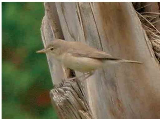
376 Saharan Olivaceous Warbler / Saharaanse Vale Spotvogel Acrocephalus pallidus reiseri , Tozeur, Tunisia, 17 May 2005

Photographs from Ghidma (6 May) and Arram (1 May) showed birds with quite a different appearance. The Ghidma birds seemed to have a more Phylloscopus -like appearance, a more obvious pale wing panel and a narrower and shorter