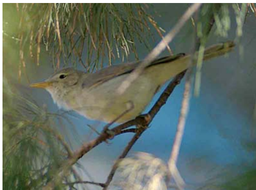
374-375 Saharan Olivaceous Warbler / Saharaanse Vale Spotvogel Acrocephalus pallidus reiseri , Arram, Gabès, Tunisia, 1 May 2005 (René Pop)

Olivaceous, while Western Olivaceous keeps its tail still (Parkin et al 2004, Jiguet 2005, Ottoson et al 2005). Both Western Olivaceous and Saharan Olivaceous use similar tac calls but they differ in song. The latter's more monotonous and somewhat coarse sounding song has a structure characteristic of Eastern Olivaceous as parts of a few seconds in length are repeated ('cycling') while the more pleasing song of Western Olivaceous is not characterized by repetitions of such long sections (Ottoson et al 2005, Magnus Robb in litt).