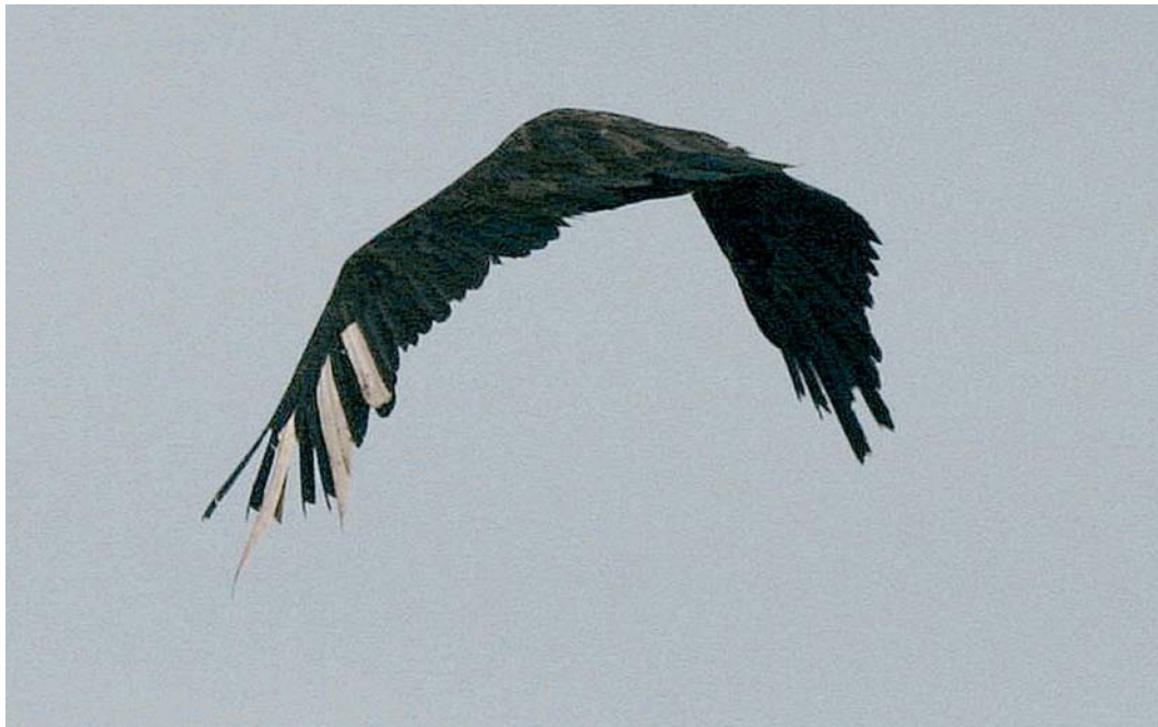
404 Monniksgier / Eurasian Black Vulture Aegypius monachus , adult vrouwtje ('Carmen'), Beers, Noord-Brabant, 17 maart 2005

Evelyn Tewes (in litt). Zij berichtte dat het om 'Carmen' ging, een adult vrouwtje Monniksgier dat op 2 mei 2003 als (vermoedelijk) wilde vogel in verzwakte toestand met vergiftigingsverschijnselen was binnengebracht bij een opvangcentrum in Extremadura, Spanje. Op 15 juli 2003 werd Carmen overgebracht naar het gierenstation van de Black Vulture Conservation Foundation (BVCF) op Majorca, Balearen, Spanje, en op 7 april 2004 met negen andere Monniksgieren overgebracht naar Les Baronnies, Drôme, Frankrijk. Dit is de tweede locatie (naast de Grandes Causses, Aveyron/Lozère) waar Monniksgieren in Frankrijk worden uitgezet. Na een verblijf van bijna 10 maanden in een acclimatisatiekooi werd zij hier op 2 februari 2005 vrijgelaten, voorzien van een kleurring en een radiozender met een antenne tussen de staartpenen. Na half februari is zij hier niet meer waargenomen. De afstand tussen Extremadura en de Baronnies is c 1000 km; de afstand tussen de Baronnies en Beers is c 800 km. De vogel heeft dus minder dan de helft van de afstand op eigen kracht en zonder hulp van de mens afgelegd. Of de vogel daarmee nog als 'wild' kan worden bestempeld en aanvaardbaar is voor de Neder-