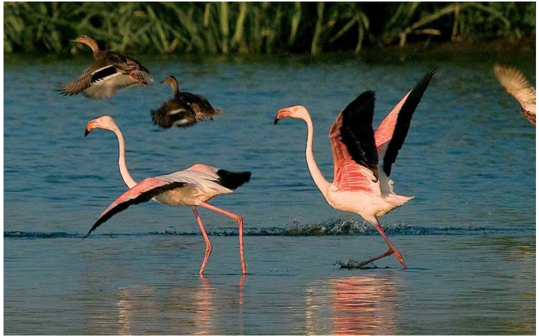
427 Flamingo's / Greater Flamingos Phoenicopterus roseus , adult, Buggenum, Limburg, juli 2005 (Otto Plantema)