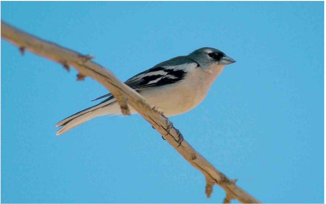
368 Tunisian Chaffinch / Tunesische Vink Fringilla coelebs spodiogenys , male, north of Skhira, Sfax, Tunisia, 1 May 2005 (René Pop)