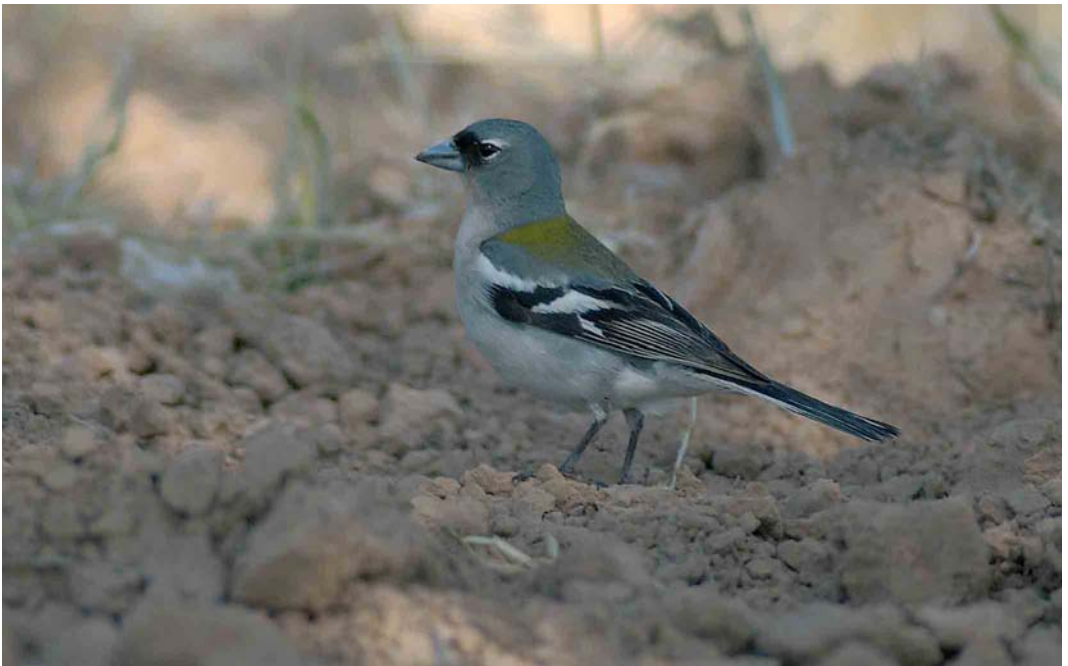
369 Tunisian Chaffinch / Tunesische Vink Fringilla coelebs spodiogenys , male, Arram, Gabès, Tunisia, 1 May 2005