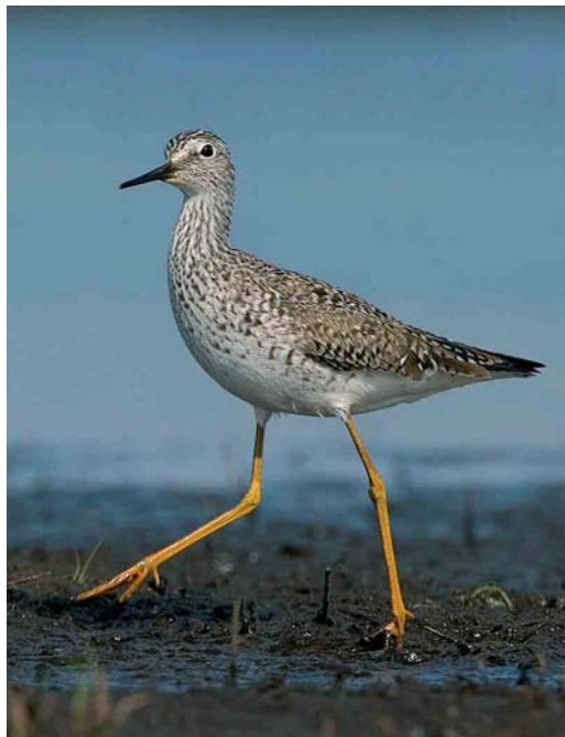
455 Long-billed Dowitcher / Grote Grijs Snip Limnodromus scolopaceus , first-year, Veerse Meer, Zeeland, 24 april 2004 ( Bas van den Boogaard ) 456 Lesser Yellowlegs / Kleine Geelpootruiter Tringa flavipes , Annermoeras, Spijkerboor, Drenthe, 21 May 2004 ( Bas van den Boogaard ) 457 Red-necked Stint / Roodkeelstrandloper Calidris ruficollis , adult, Slikken van Flakkee, Zuid-Holland, 6 July 2004 ( Pim A Wolf )