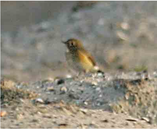
558 Blauwstaart / Red-flanked Bluetail Tarsiger cyanurus , Voorhaven, Zeebrugge, West-Vlaanderen, 15 oktober 2005 (Koen Verbanck)