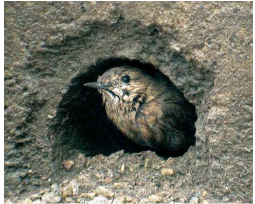
559 Izabeltapuit / Isabelline Wheatear Oenanthe isabellina , Aarschot, Vlaams-Brabant, oktober 2005 (Koen Verbanck)

vogel nog even gezien op een nabije afsluiting maar daar werd hij weggejaagd door een langsrijdende vrachtwagen en kon niet meer worden teruggevonden, ondanks intensief zoekwerk door 10-tallen vogelaars. Alleen in de namiddag werd hij nogmaals gemeld door één waarnemer.