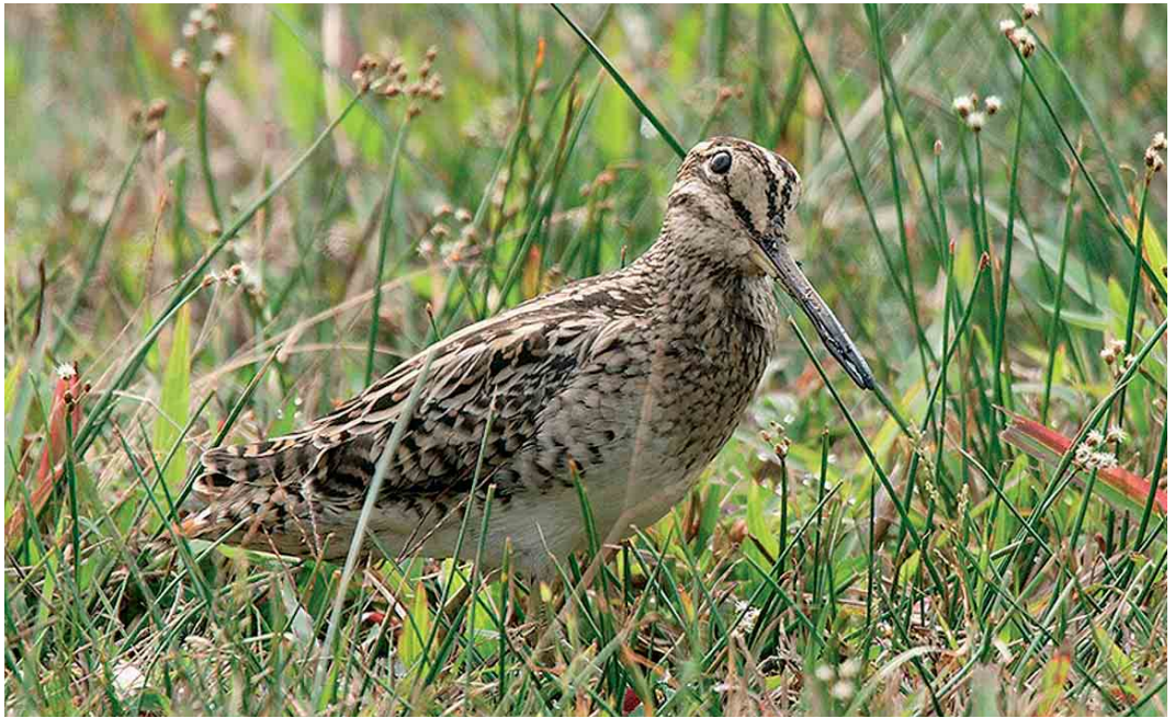
482 Swinhoe's Snipe / Siberische Snip Gallinago megala , Lim Chu Kang, Singapore, 24 March 2005 (Cheah Weng Kwong). Note long tail projection, bulging supercilium in front of eye and lateral crown-stripe joining over the bill. Note also the extreme similarity with Pintail Snipe G. stenura . 483 Pintail Snipe / Stekelstaartsnip Gallinago stenura , Lumlukka, Pathum Thani, Thailand, 17 September 2005 (Peter Ericsson). Note relatively short bill, bulging supercilium in front of eye, absence of contrast between colour of supercilium and buffish patch between eye-stripe and cheek-stripe and narrow loreal stripe. Note also the extreme similarity with Swinhoe's Snipe G. megala .