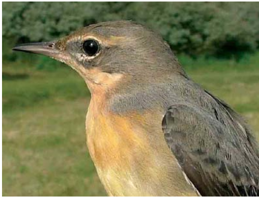
Mystery photograph XI (September)