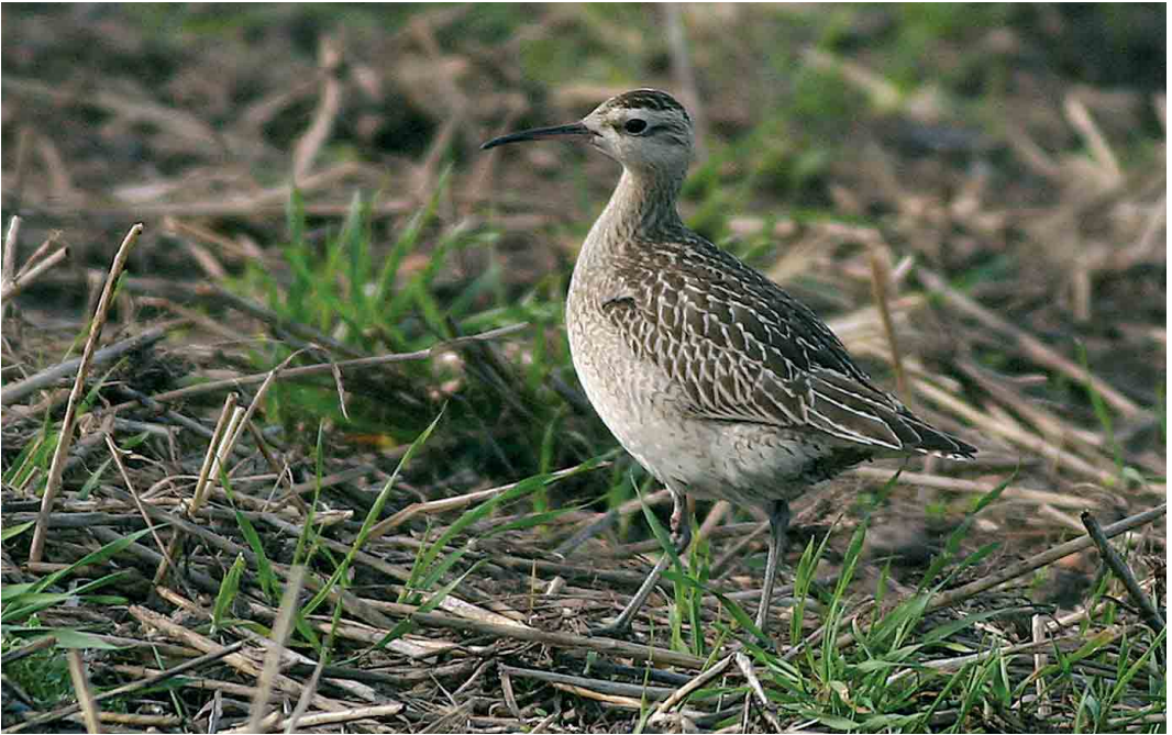
501 Little Curlew / Kleine Regenwulp Numenius minutus , juvenile, Ventlinge, Öland, Sweden, 18 October 2005