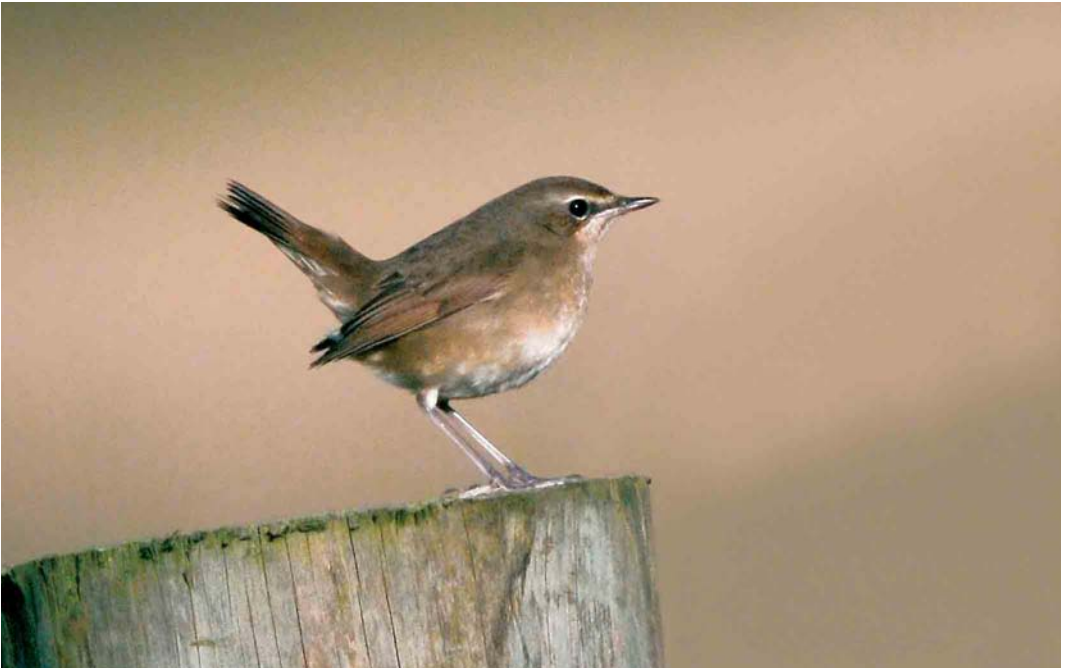
507 Siberian Rubythroat / Roodkeelnachtegaal Luscinia calliope , first-year female, Fair Isle, Shetland, Scotland, October 2005