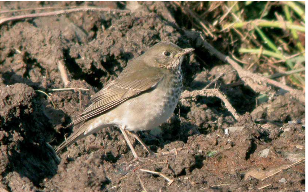
510 Grey-cheeked Thrush / Grijswangdwerglijster Catharus minimus , Cape Clear, Cork, Ireland, October 2005