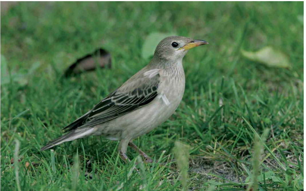
544 Roze Spreeuw / Rose-coloured Starling Sturnus roseus , juveniel, Terschelling, Friesland, 12 september 2005