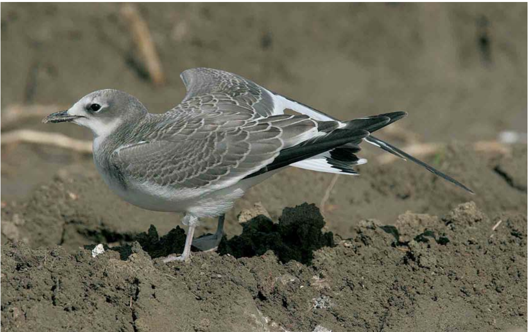
532 Vorkstaartmeeuw / Sabine's Gull Larus sabini , juveniel, Westkapelle, 29 september 2005