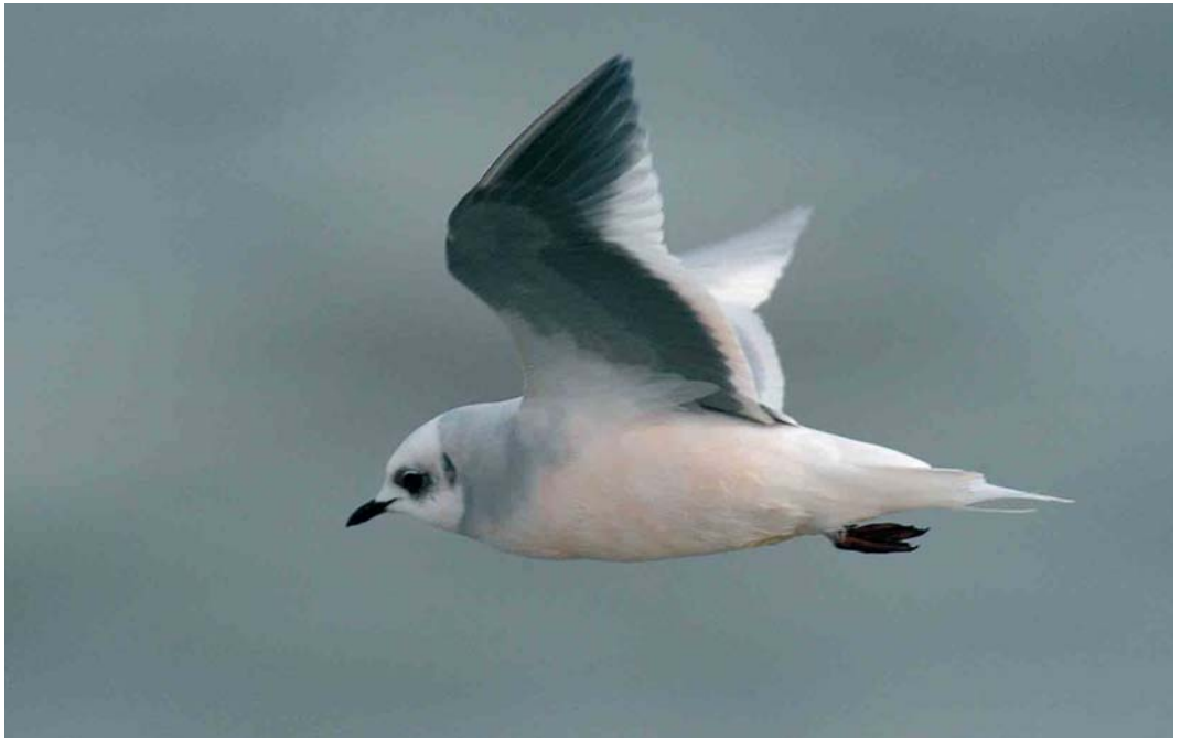
464 Ross's Gull / Ross' Meeuw Rhodostethia rosea , adult, Scheveningen, Zuid-Holland, 21 November 2004