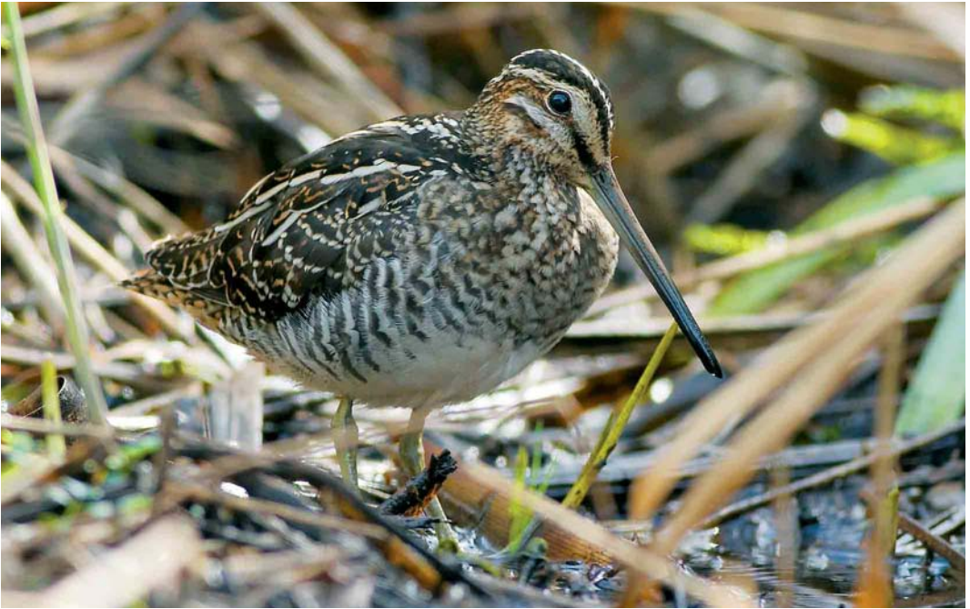
485 Wilson's Snipe / Amerikaanse Watersnip Gallinago delicata , Ty Crenn, Ouessant, Finistère, France, 19 October 2005