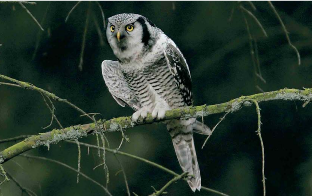
533 Sperweruil / Northern Hawk Owl Surnia ulula , eerstejaars, Westerbork, Drenthe, 31 oktober 2005 (Daan Schoonhoven)