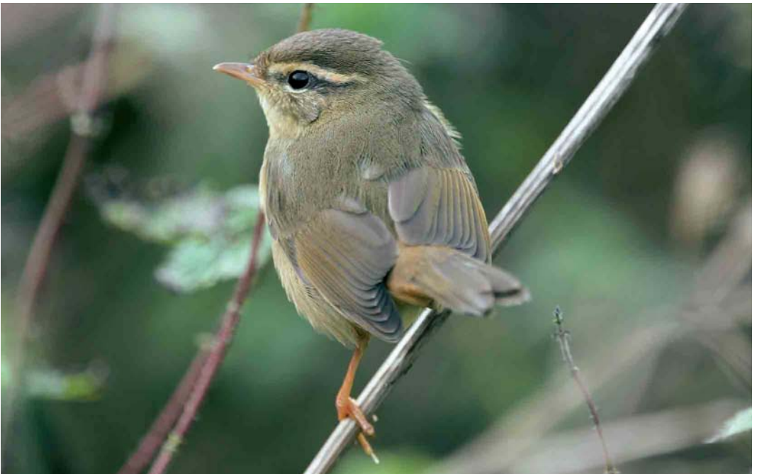
524 Radde's Warbler / Raddes Boszanger Phylloscopus schwarzi , Segerstad, Öland, Sweden, 13 October 2005 (Kris De Rouck)