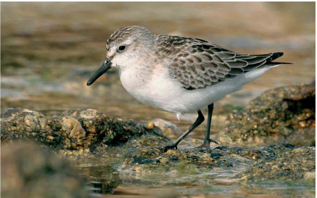
502 Semipalmated Sandpiper / Grijsze Strandloper Calidris pusilla , juvenile, Ouessant, Finistère, France, 26 September 2005