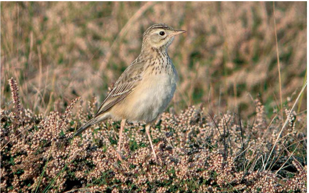
506 Blyth's Pipit / Mongoolse Pieper Anthus godlewskii , Ouessant, Finistère, France, 14 October 2005