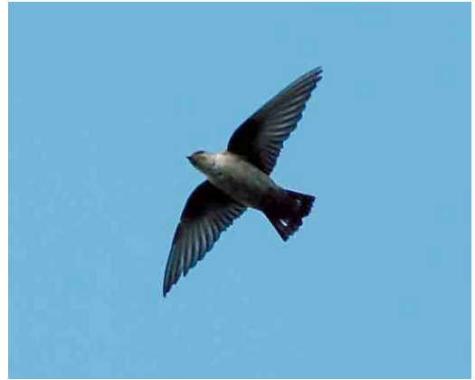
563-564 Rotszwaluw / Eurasian Crag Martin Ptyonoprogne rupestris , Mechelen, Antwerpen, 4 november 2005