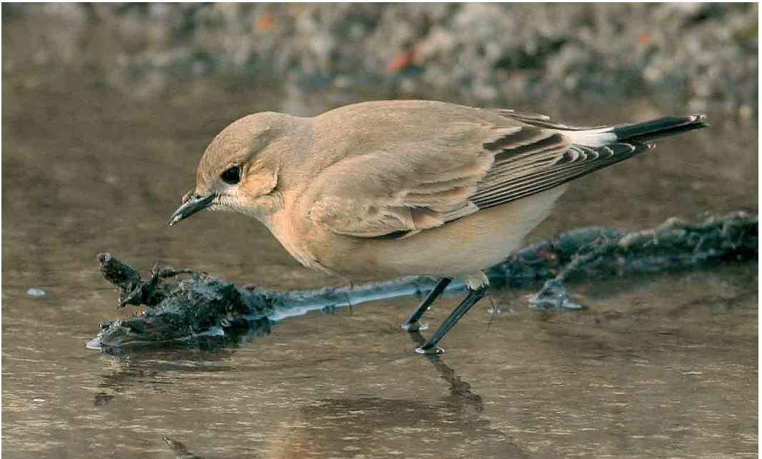
554 Izabeltapuit / Isabelline Wheatear Oenanthe isabellina , Aarschot, Vlaams-Brabant, 21 oktober 2005 (Raymond De Smet)