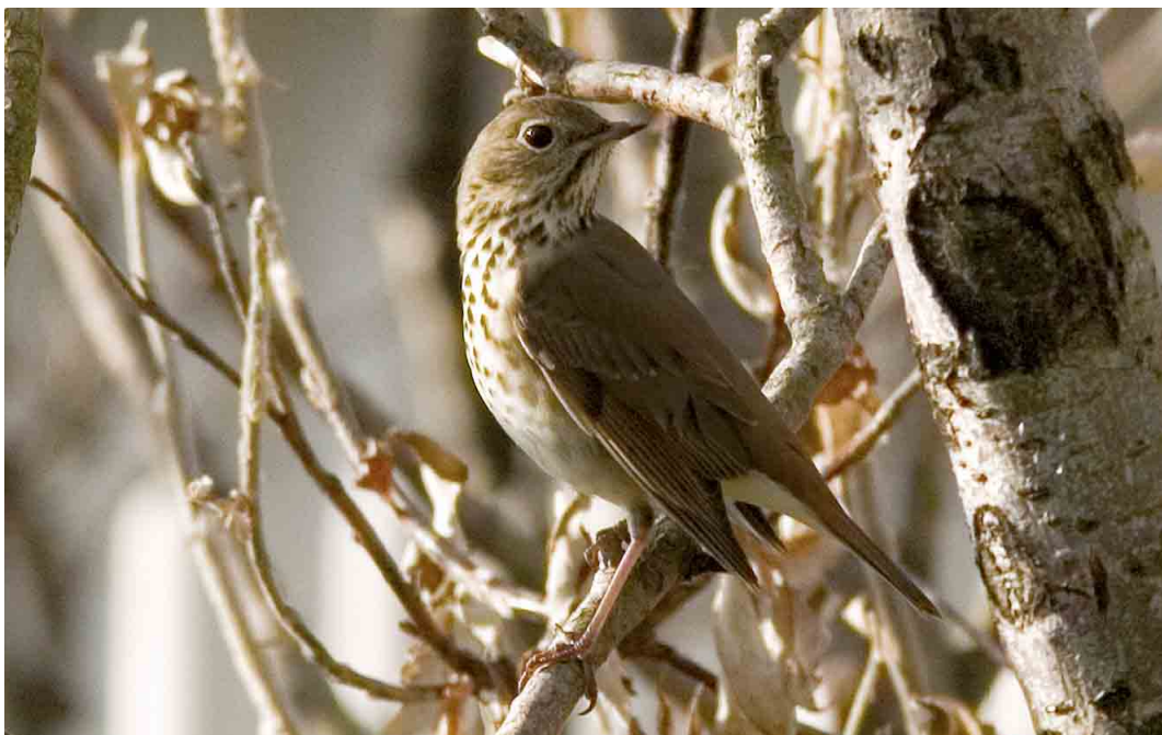
509 Hermit Thrush / Heremietlijster Catharus guttatus , Heimaey, Vestmannaeyjar, Iceland, 13 October 2005 (Yann Kolbeinsson)