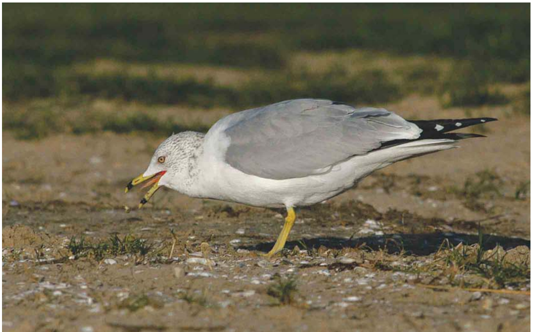
465 Ring-billed Gull / Ringsnavelmeeuw Larus delawarensis , adult, Tiel, Gelderland, 30 January 2004