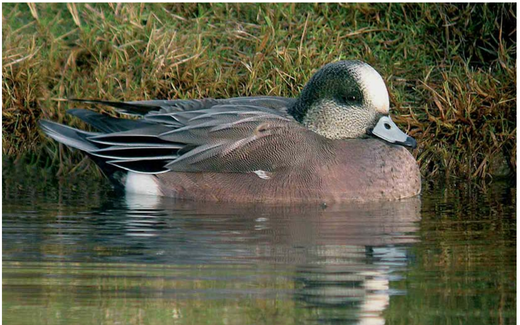
450 American Wigeon / Amerikaanse Smient Anas americana , male, Heerpolderweg, Zeeland, 6 January 2005