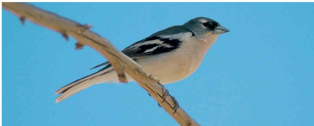
478 Tunisian Chaffinch / Tunesische Vink Fringilla coelebs spodiogenys , male, north of Skhira, Sfax, Tunisia, 1 May 2005

In the caption of plate 444 (Dutch Birding 27: 361, 2005) unfortunately the wrong photographer was mentioned. The photograph was taken by Koen Verbanck. EDITORS