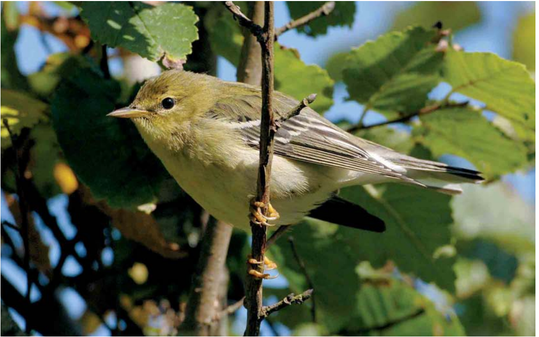
523 Blackpoll Warbler / Zwartkapzanger Dendroica striata , first-year, St Mary's, Scilly, England, October 2005