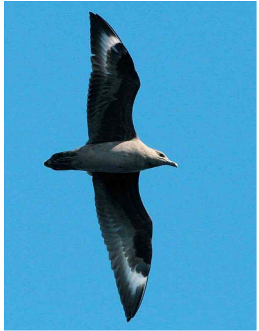
490 Pallid Swift / Vale Gierzwaluw Apus palidus , Skagen, Nordjylland, Denmark, 7 November 2005 ( Ole Krogh ) 491-492 Presumed South Polar Skua / vermoedelijke Zuidpooljager Stercorarius maccormicki , off La Palma, Canary Islands, 7 October 2005 ( Edwin Winkel )