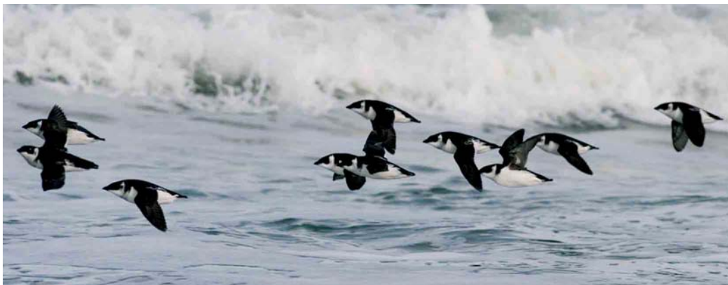
561 Kleine Alken / Little Auks Alle alle , Paal 7, Schiermonnikoog, Friesland, 23 oktober 2005

Nauwelijks nabij de vloedlijn aangekomen zagen