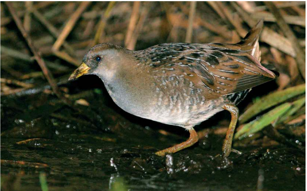
486 Sora Rail / Soraral Porzana carolina , Ty Crenn, Ouessant, Finistère, France, October 2005