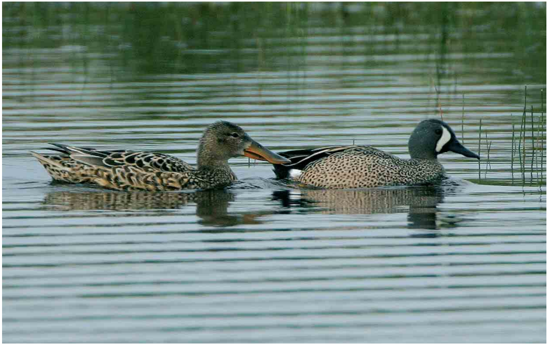
449 Blue-winged Teal / Blauwvleugeltaling Anas discors , male, with Northern Shoveler / Slobeend A clypeata , female, Grootte Vlak, Texel, Noord-Holland, 20 May 2004 ( Bas van den Boogaard )