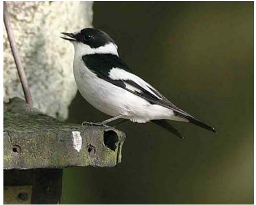
473 Collared Flycatcher / Withalsvliegenvanger Ficedula albicollis , male, Noord-Ginkel, Gelderland, May 2004 (Arjen Heeres)

2003 11-12 October, De Cocksdorp, Texel , Noord-Holland, photographed (D Kok, J de Bruijn, L B Steijn et al).