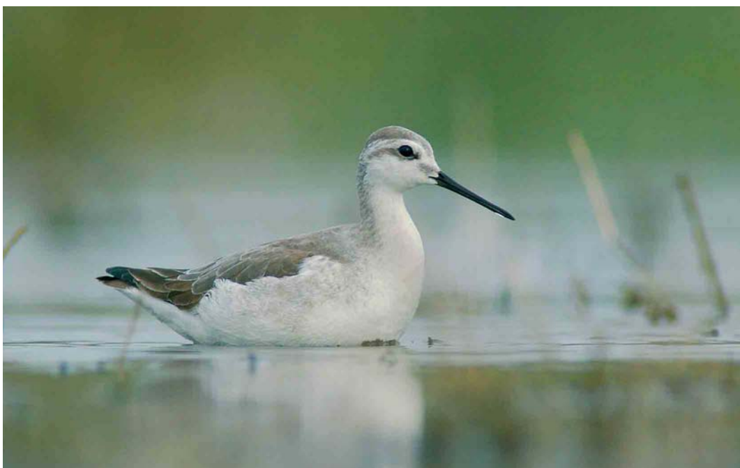
500 Wilson's Phalarope / Grote Franjepoot Phalaropus tricolor , first-winter, Balaton lake, Hungary, October 2005 (János Oláh)