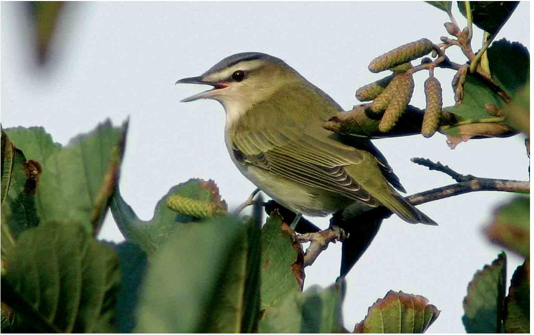
547-548 Roodoogvireo / Red-eyed Vireo Vireo olivaceus , Westkapelle, Zeeland, 9 oktober 2005