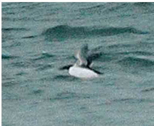
560 Kortbekzeekoet / Brünnich's Murre Uria lomvia, eerstejaars, Paal 7, Schiermonnikoog, Friesland, 23 oktober 2005