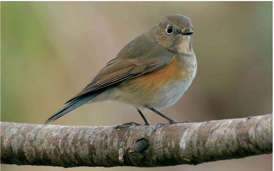
508 Red-flanked Bluetail / Blauwstaart Tarsiger cyanurus , first-winter, Ouessant, Finistère, France, 23 October 2005 (Thierry Queleennec)