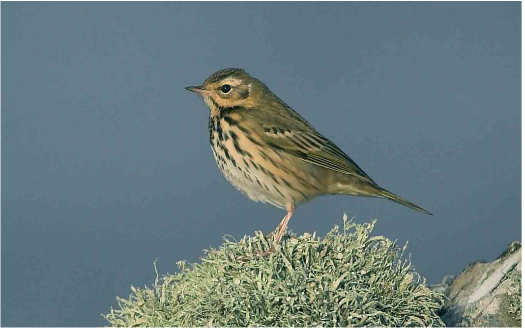
505 Olive-backed Pipit / Siberische Boompieper Anthus hodgsoni , Sumburgh, Mainland, Shetland, Scotland, October 2005