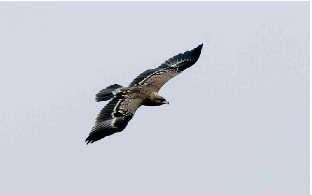
528 Schreeuwarend / Lesser Spotted Eagle Aquila pomarina , juveniel, Domburg, Zeeland, 25 september 2005 529 Schreeuwarend / Lesser Spotted Eagle Aquila pomarina , juveniel, Domburg, Zeeland, 24 september 2005 530 Schreeuwarend / Lesser Spotted Eagle Aquila pomarina , juveniel, Domburg, Zeeland, 25 september 2005