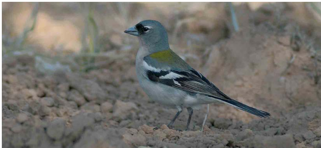
479 Tunisian Chaffinch / Tunesische Vink Fringilla coelebs spodiogenys , male, Arram, Gabès, Tunisia, 1 May 2005 (René Pop)