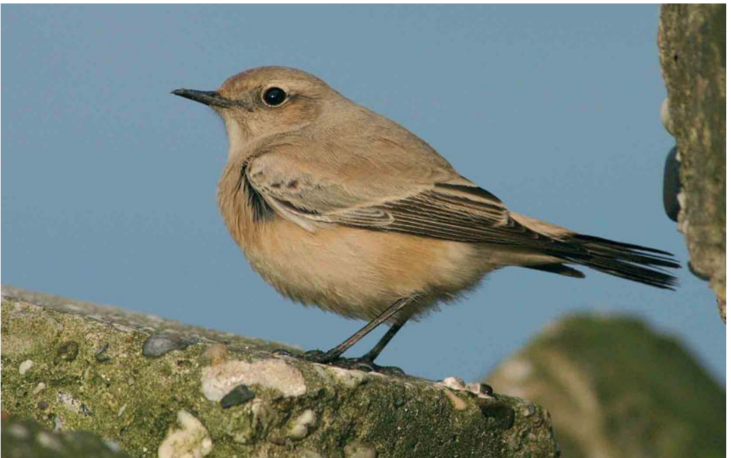
542 Woestijntapuit / Desert Wheatear Oenanthe deserti , vrouwtje, Wierum, Friesland, 30 oktober 2005