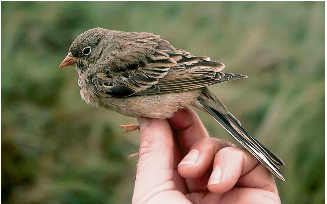
474 Grey-necked Bunting / Steenortolaan Emberiza buchanani , first-winter, Castricum, Noord-Holland, 16 October 2005 (Arnold Wijker)