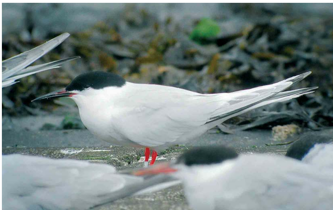
467 Roseate Tern / Dougalls Stern Sterna dougallii , adult, Roggenplaat, Zeeland, 13 August 2004