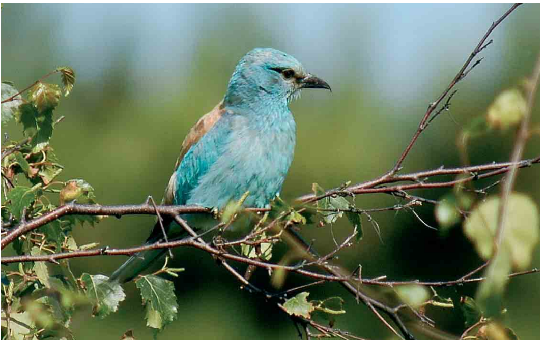
534 Scharrelaar / European Roller Coracias garrulus , adult, Texel, Noord-Holland, september 2005 (Harm Niesen)