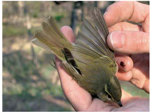
Mystery photograph XII (May)

bird must be either a Pintail Snipe or a Swinhoe's Snipe. A certain identification of these two species is extremely difficult and nearly impossible if only based on a single character. However, using the above mentioned set of characters, it can be argued that the mystery bird is a Pintail. The identification is based on the combination of a very broad supercilium (on average less so in Swinhoe's) creating a rather bare-faced expression, together with the relative fine barring on the underparts (on average stronger and darker in Swinhoe's), the overall colour, which is not so dark as in Swinhoe's, and the pattern of the central crown-stripe (cf plate 482).