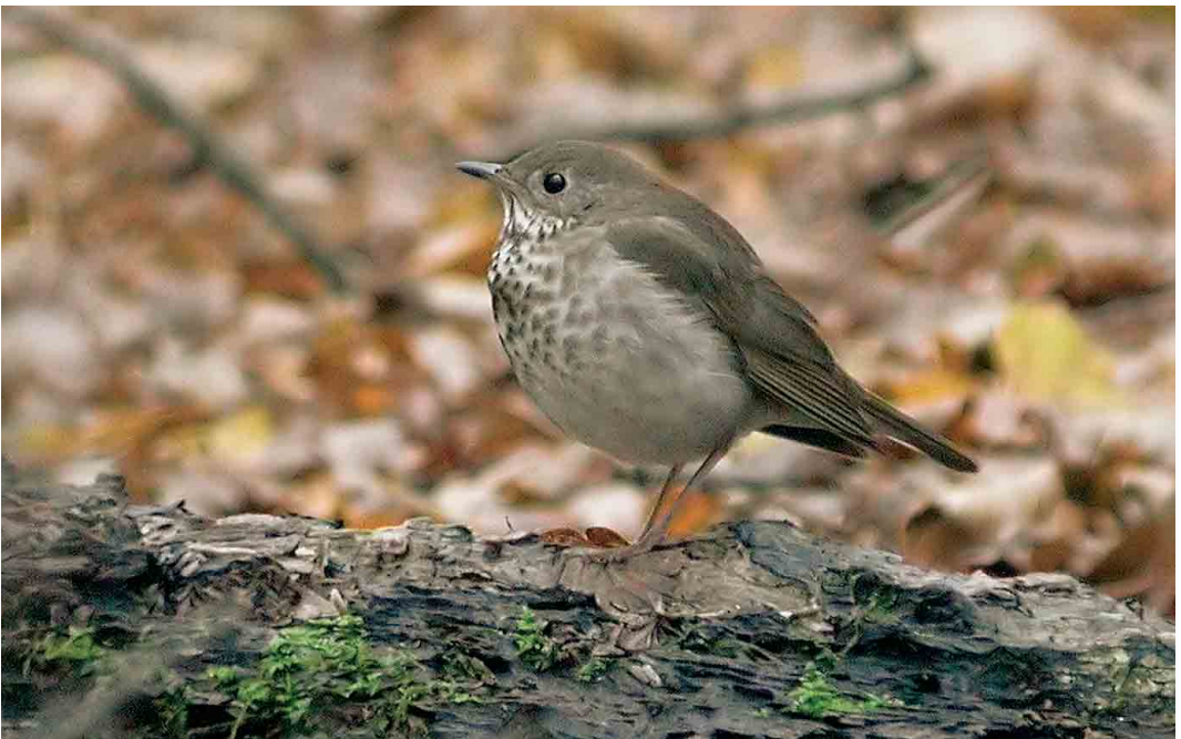
512 Grey-cheeked Thrush / Grijswangdwerglijster Catharus minimus , Northaw Great Wood, Hertfordshire, England, 14 November 2005 (Dave Stewart)