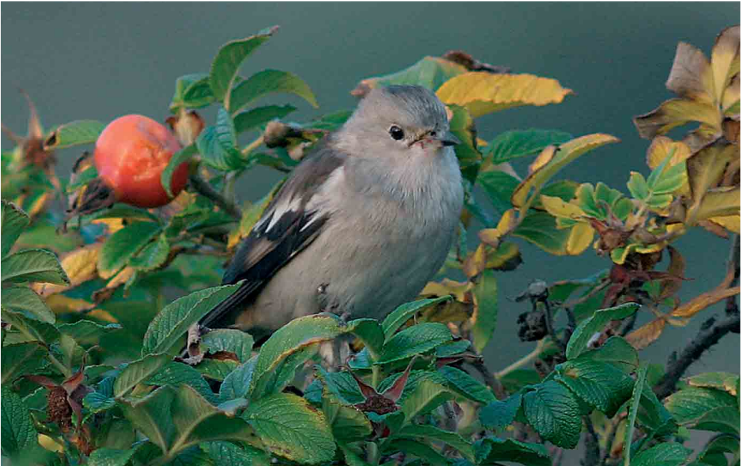
543 Daurische Spreeuw / Purple-backed Starling Sturnus sturninus , eerstejaars mannetje, Vlieland, Friesland, 12 oktober 2005