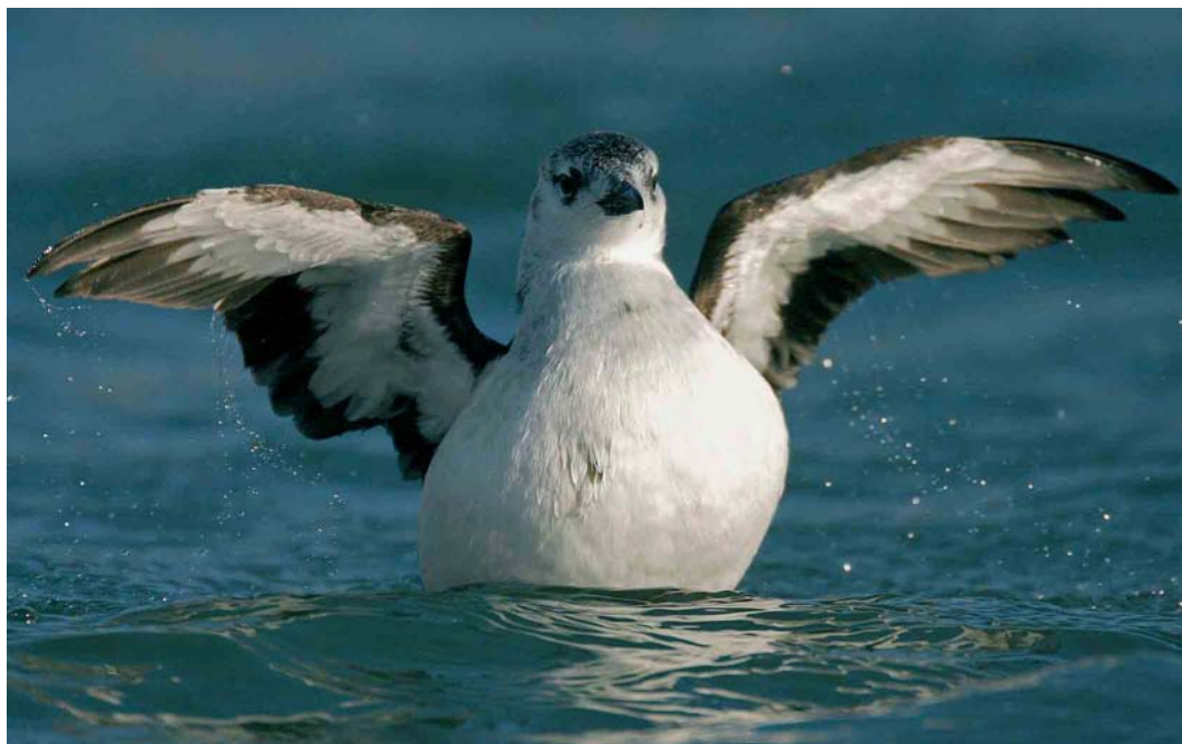
466 Black Guillemot / Zwarte Zeekoet Cepphus grylle , adult, West-Terschelling, Terschelling, Friesland, 16 January 2005