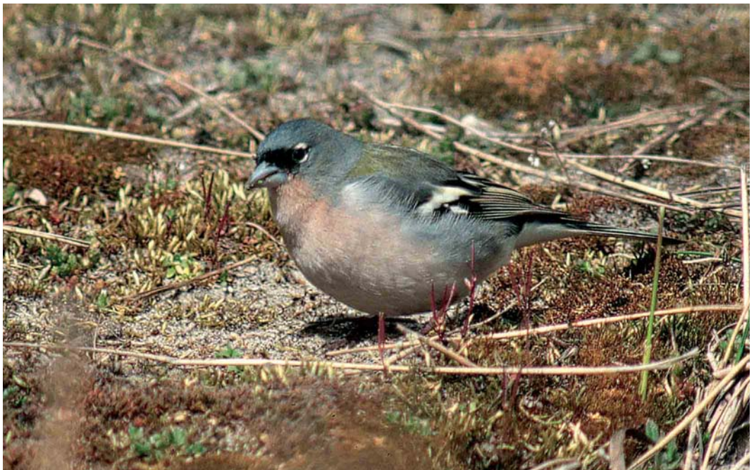
475 Atlas Chaffinch / Atlasvink Fringilla coelebs africana , first-summer male, Maasvlakte, Zuid-Holland, 5 April 2003 (Harm Niesen)