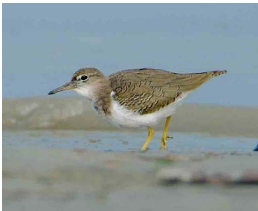
503 Spotted Sandpiper / Amerikaanse Oeverloper Actitis macularius , juvenile, Rheindelta, Austria, 2 November 2005 (Georg Juen)