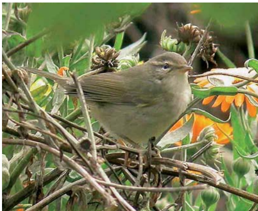
555 Raddes Boszanger / Radde's Warbler Phylloscopus schwarzi , Huldenberg, Vlaams-Brabant, Limburg, 8 oktober 2005 (Freek Fluyt)