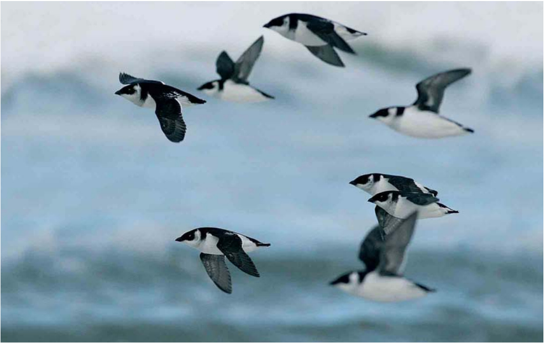
531 Kleine Alken / Little Auks Alle alle , Paal 7, Schiermonnikoog, Friesland, 23 oktober 2005 (Ralph Buij)