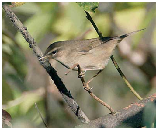
556 Bruine Boszanger / Dusky Warbler Phylloscopus fuscatus , Heist, West-Vlaanderen, 16 oktober 2005 (Patrick Beirens)