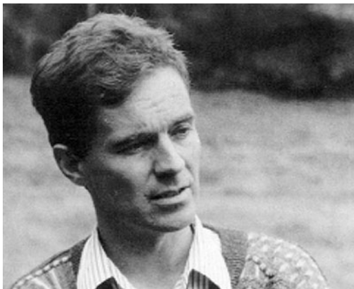
557 Andreas Helbig. Published with permission from Journal für Ornithologie.

vocally distinct Phylloscopus warblers (J Avian Biol 26: 139-153, 1995). Although surprising at the time, this pattern was soon found in various other Old World warblers. Andreas recognized that a phylogeny is a means to an end, rather than an end in itself and thus used his data to shed light on numerous evolutionary questions. For instance, he used molecular data to assess gene flow in the hybrid zones of chiffchaffs in the Pyrenees and Scandinavia (J Evol Biol 14: 277-287, 2001; Mol Ecol 11: 473-482, 2002) and of Greater Spotted Eagle Aquila clanga and Lesser Spotted Eagle A pomarina in eastern Europe (J Ornithol 146: 226-234, 2005) and studied the evolution of breeding distributions of Phylloscopus warblers (Evolution 51: 552-561, 1997), migratory directions in Blackcaps (Evolution 58: 1819-1832, 2004) and ecological niches in Sylvia warblers (J Evol Biol 16: 956-965, 2003). Another research highlight in his productive career was to disprove the ring species model of the Herring Gull complex (Proc R Soc Lond B 271: 893-902, 2004). His work on large white-headed gulls, which he conducted with Dorit Liebers and Peter de Knijff, offers a solid basis for revising the taxonomy of this recently-evolved complex.