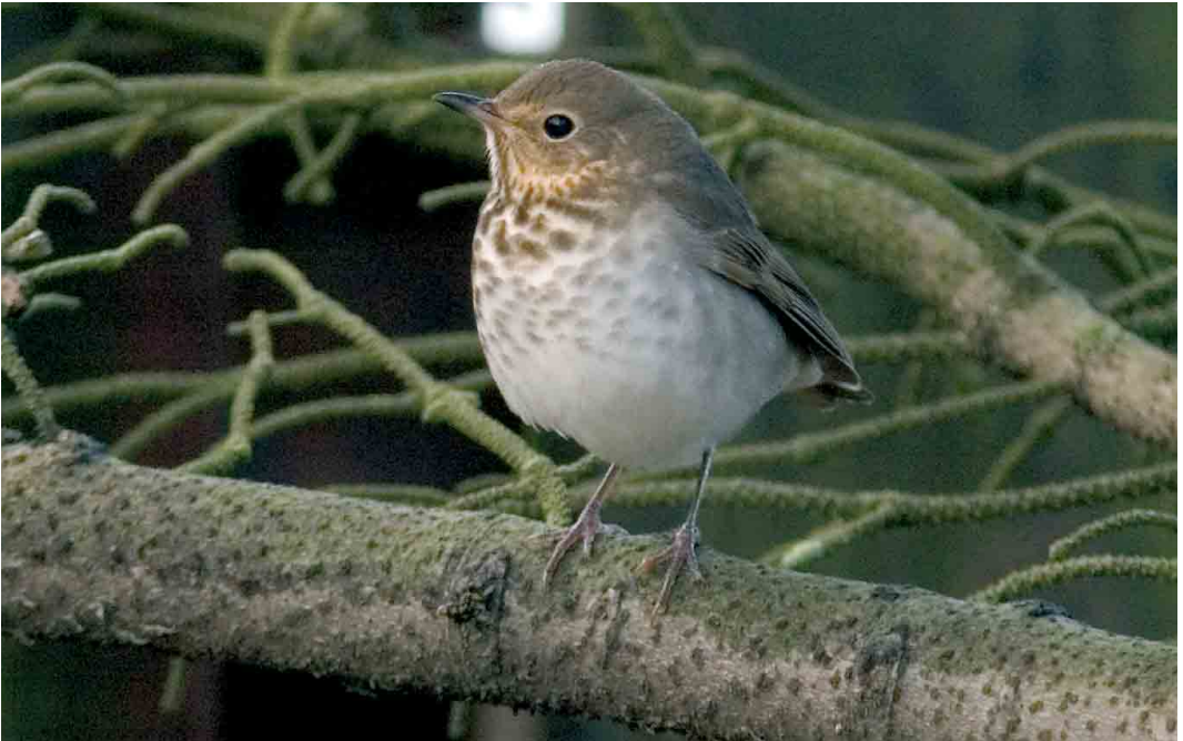
511 Swainson's Thrush / Dwerglijster Catharus ustulatus , Heimaey, Vestmannaeyjar, Iceland, 6 October 2005 (Yann Kolbeinnsson)