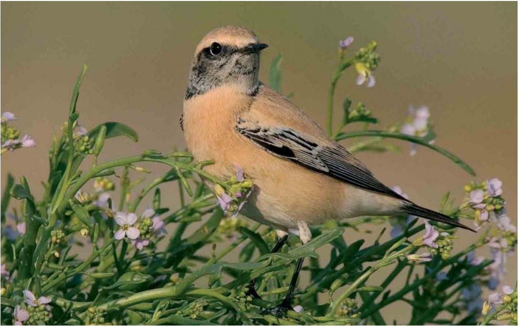
541 Woestijntapuit / Desert Wheatear Oenanthe deserti , eerstejaars mannetje, IJmuiden, Noord-Holland, 24 september 2005