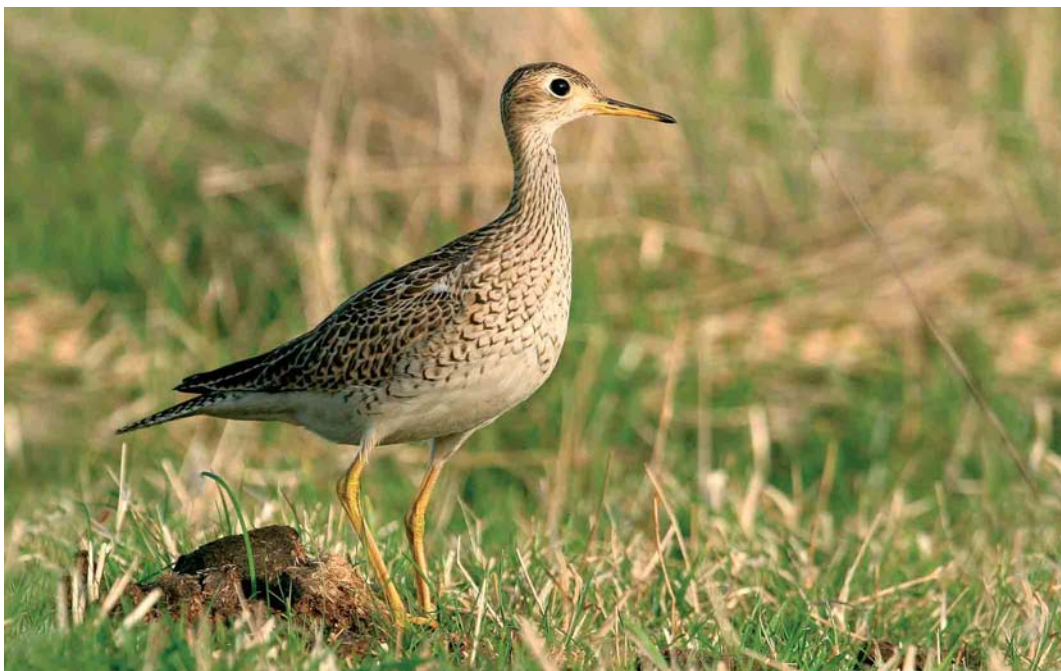
499 Upland Sandpiper / Bartrams Ruyter Bartramia longicauda , Ouessant, Finistère, France, 14 October 2005