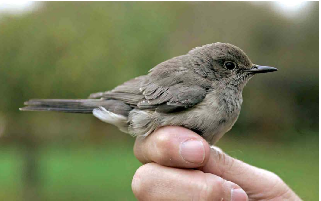
545 Perzische Roodborst / White-throated Robin Irania gutturalis , eerstejaars vrouwtje, Pietersbierum, Friesland, 31 oktober 2005