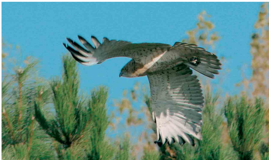
451 Short-toed Eagle / Slangenarend Circaetus gallicus , juvenile, Ilmeerdijk, Flevoland, 27 October 2004 (Karel A Mauer)

Steyl, Limburg (via J J F J Jansen; Riotte 1922, 1923; Jaarber Club Nederl Vogelk 5: 97, 1915, Natuurh Maandbl 39: 90, 1950).