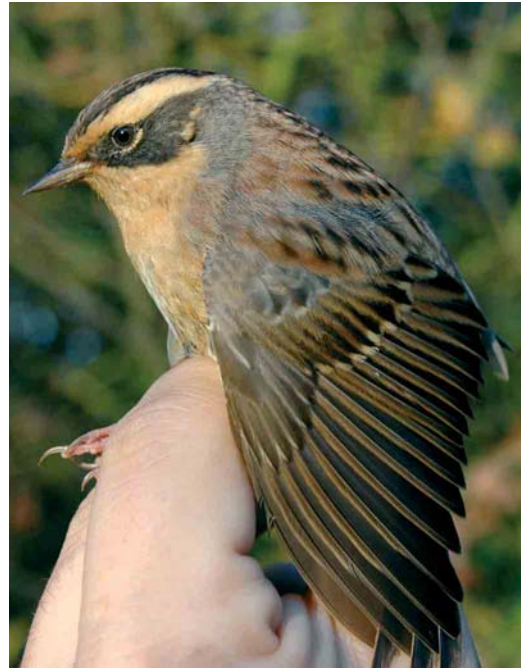
513 Brown Shrike / Bruine Klauwier Lanius cristatus , Utsira, Rogaland, Norway, 3 October 2005 (Christian Tiller) 514 Siberian Accentor / Bergheggenmus Prunella montanella , Schiffflange, Luxemburg, 2 November 2005 (Patric Lorgé) 515 Paddyfield Warbler / Veldrietzanger Acrocephalus agricola , St Mary's, Scilly, England, October 2005 (Mike Malpass) 516 Booted Warbler / Kleine Spotvogel Acrocephalus caligatus , Helgoland, Schleswig-Holstein, Germany, 13 October 2005 (Felix Jachmann)