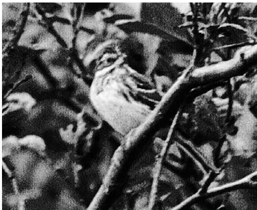
476 Rustic Bunting / Bosgors Emberiza rustica , Lies, Terschelling, Friesland, 29 September 1972 (Leo J van Gemert)