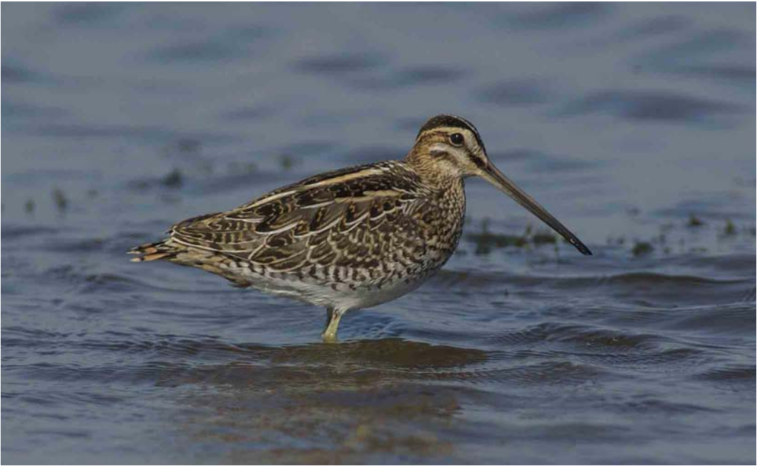
480 Common Snipe / Watersnip Gallinago gallinago , Texel, Noord-Holland, Netherlands, 12 February 2004 ( René Pop ). Note parallel-sided supercilium in front of eye, broad loral stripe and contrast between buffish coloured supercilium and whitish patch between eye-stripe and cheek-stripe. 481 Wilson's Snipe / Amerikaanse Watersnip Gallinago delicata , Kougarak Road, Nome, Alaska, 1 June 2004 ( René Pop ). Note parallel-sided supercilium in front of eye and contrast between buffish coloured supercilium and whitish patch between eye-stripe and cheek-stripe. Note also that the loral stripe is narrower compared with Common Snipe G. gallinago .