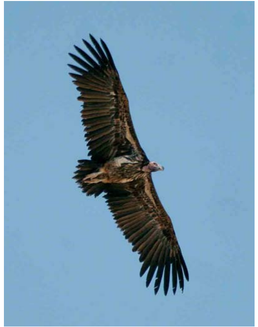
487 Magnificent Frigatebird / Amerikaanse Fregatvogel Fregata magnificens , Chester Zoo, Cheshire, England (found near Whitchurch, Shropshire, England, on 7 November 2005), 8 November 2005 (Mark Eaton) 488 Lappet-faced Vulture / Oorgier Torgos tracheliotus , Shalatin, Egypt, 18 October 2005 (Dominic Mitchell/Birdwatch) 489 Namaqua Dove / Maskerduif Oena capensis , female, Wadi Gimal, Egypt, 19 October 2005 (Dominic Mitchell/Birdwatch)