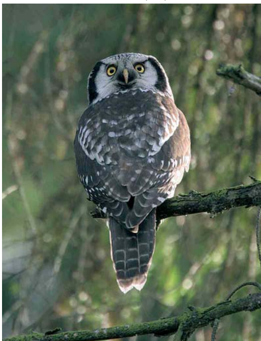
562 Sperweruil / Northern Hawk Owl Surnia ulula, eerstejaars, Westerbork, Drenthe, 31 oktober 2005