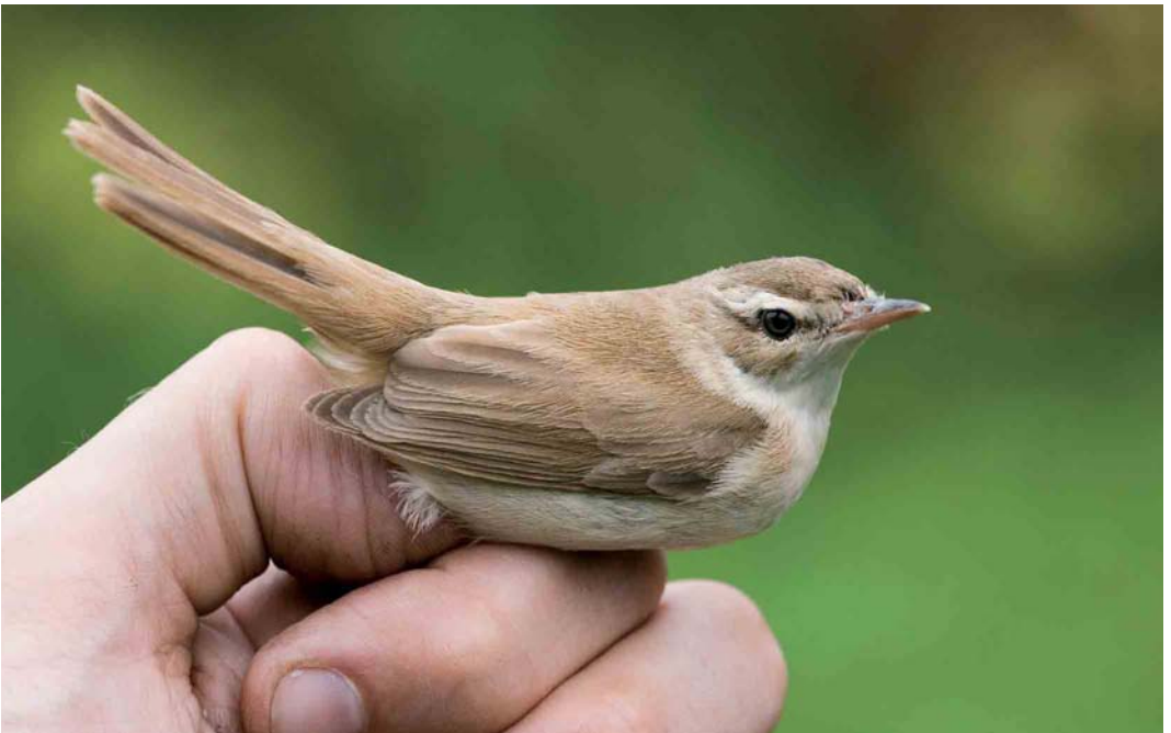
546 Veldrietzanger / Paddyfield Warbler Acrocephalus agricola , Wormer- en Jisperveld, Noord-Holland, 11 september 2005 ( Jan van der Geld )