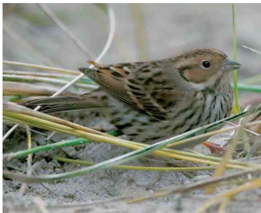
550 Kleine Klapekster / Lesser Grey Shrike Lanius minor , Grote Vlak, Texel, Noord-Holland, 5 oktober 2005 551 Aziatische Roodborsttapuit / Siberian Stonechat Saxicola maurus , eerstejaars, Westduinpark, Den Haag, Zuid-Holland, 26 oktober 2005 552 Bosgors / Rustic Bunting Emberiza rustica , Vlieland, Friesland, 16 oktober 2005 553 Dwerggors / Little Bunting Emberiza pusilla , Vlieland, Friesland, oktober 2005

schaars met begin oktober drie en na 21 oktober 15 meldingen. Van de 39 gemelde Kleinste Jagers Stercorarius longicaudus vlogen er 19 langs tussen 28 september en 2 oktober. In het binnenland was er een waarneming bij Zwolle op 17 september. Op 29 september werden langs Terschelling 91 Grote Jagers S skua geteld en op 23 oktober langs Westkapelle 60 Middelste Jagers S pomarinus . Slechts 30 Vorkstaartmeeuwen Larus sabini werden opgemerkt, waarvan 15 tussen 28 september en 2 oktober. Van 18 september tot 1 oktober liet een juveniel exemplaar zich mooi bekijken op een akker bij Westkapelle. Op 29 september vloog er één langs Lelystad, Flevoland, en op 16 oktober één langs de Ketelbrug. De Ringsnavelmeeuw L delawarensis van Tiel, Gelderland, liet zich daar weer bekijken van 17 september tot 14 oktober. De subadulte Grote Burgemeester L hyperboreus werd de gehele periode gezien bij Katwijk aan Zee, Zuid-