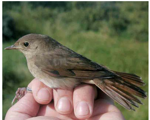
469 Melodious Warbler / Orpheusspotvogel Hippolais polyglotta , Ter Apel, Groningen, 20 May 2004 470 River Warbler / Krekelzanger Locustella fluviatilis , 't Twiske, Noord-Holland, 2 June 2004 471 Hume's Leaf Warbler / Humes Bladkoning Phylloscopus humei , Reusel, Noord-Brabant, 14 November 2004 472 Thrush Nightingale / Noordse Nachtegaal Luscinia luscinia , Bloemendaal, Noord-Holland, 9 September 2004