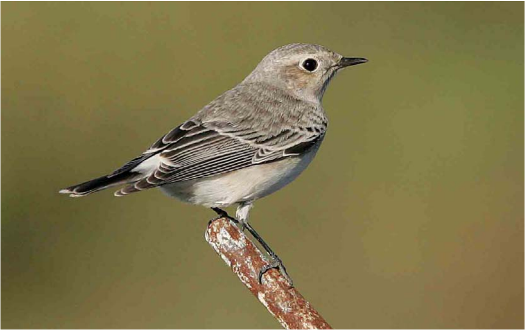
525 Pied Wheatear / Bonte Tapuit Oenanthe pleschanka , Esbjerg, Vestjylland, Denmark, 16 October 2005 ( Ole Krogh ) 526 Siberian Stonechat / Aziatische Roodborstapuit Saxicola maurus , first-year, Helgoland, Schleswig-Holstein, Germany, October 2005 ( Ole Krogh ) 527 Pine Bunting / Witkopgors Emberiza leucocephalos , male, Whalsay, Shetland, Scotland, 4 November 2005 ( Hugh Harrop )