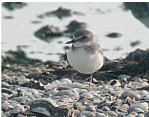
458 Pacific Golden Plover / Aziatische Goudplevier Pluvialis fulva , Grijskerke, Zeeland, 14 January 2004 ( Leo J R Boon/Cursorius ) 459 American Golden Plover / Amerikaanse Goudplevier Pluvialis dominica (centre), Grijskerke, Zeeland, 14 January 2004 ( Leo J R Boon/Cursorius ) 460 White-rumped Sandpiper / Bonapartes Strandloper Caldidris fuscicollis , De Hamert, Limburg, 22 May 2004 ( Patrick Palmen ) 461 Lesser Yellowlegs / Kleine Geelpootruiter Tringa flavipes , Eemshaven, Groningen, 10 August 2004 ( Martijn Bot ) 462 Buff-breasted Sandpiper / Blonde Ruiters Tryngites subruficollis , juvenile, De Hemmer, Texel, Noord-Holland, 28 September 2004 ( Ronald A van Dijk ) 463 Greater Sand Plover / Woestijnplevier Charadrius leschenaultii , adult, Battenoord, Zuid-Holland, 16 September 2004 ( Pim A Wolf )