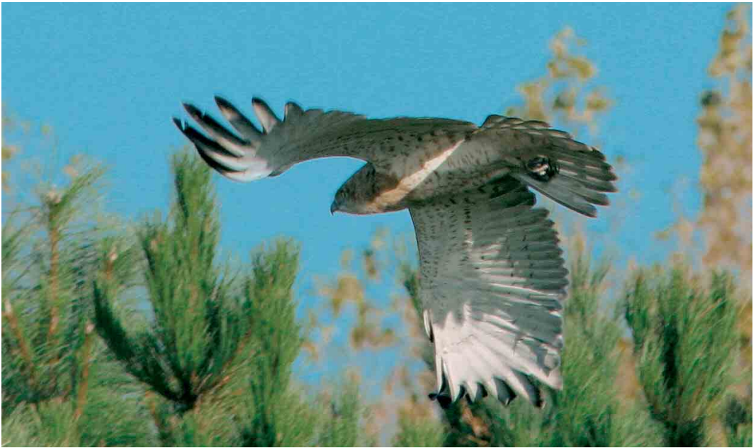
451 Short-toed Eagle / Slangenarend Circaetus gallicus , juvenile, Ilmeerdijk, Flevoland, 27 October 2004 (Karel A Mauer)

Steyl, Limburg (via J J F J Jansen; Riotte 1922, 1923; Jaarber Club Nederl Vogelk 5: 97, 1915, Natuurh Maandbl 39: 90, 1950).