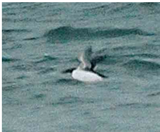
560 Kortbekzeekoet / Brünnich's Murre Uria lomvia, eerstejaars, Paal 7, Schiermonnikoog, Friesland, 23 oktober 2005