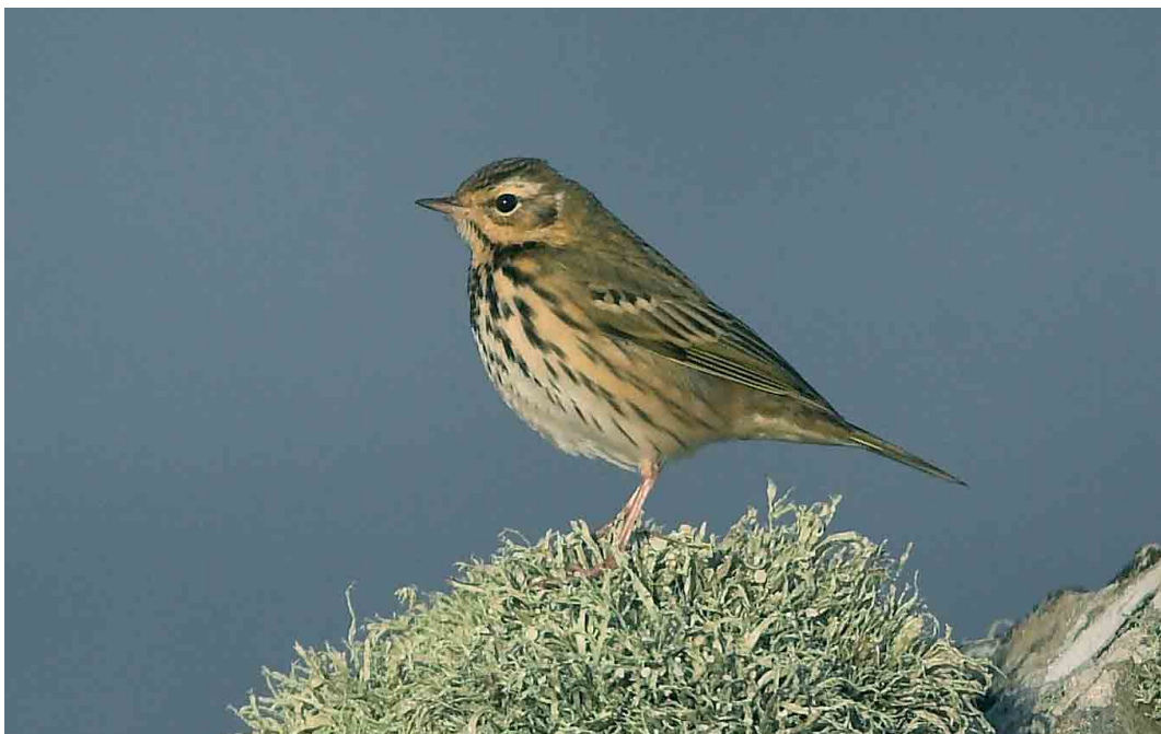
505 Olive-backed Pipit / Siberische Boompieper Anthus hodgsoni , Sumburgh, Mainland, Shetland, Scotland, October 2005