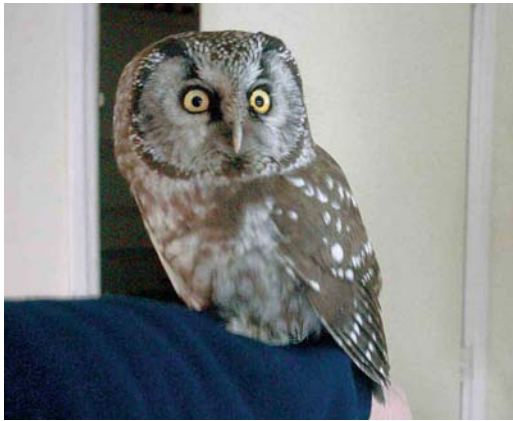
468 Tengmalm's Owl / Ruigpootuil Aegolius funereus , Hoogeveen, Drenthe, 2 April 2004 (Will Pannekoek)