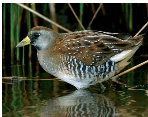
493 Chimney Swift / Schoorsteengierzwaluw Chaetura pelagica , Sein, Finistère, France, 30 October 2005 494 Chimney Swift / Schoorsteengierzwaluw Chaetura pelagica , Baltimore, Cork, Ireland, 30 October 2005 495 Chimney Swift / Schoorsteengierzwaluw Chaetura pelagica , St Mary's, Scilly, England, 31 October 2005 496 Leach's Storm-petrel / Vaal Stormvogeltje Oceanodroma leucorhoa , off Tazacorte, La Palma, Canary Islands, 6 October 2005 497 Yellow-billed Cuckoo / Geelsnavelkoekoek Coccyzus americanus , Ouessant, Finistère, France, 5 October 2005 498 Sora Rail / Soraral Porzana carolina , Lower Moors, St Mary's, Scilly, England, October 2005