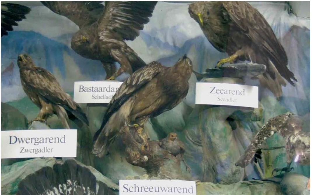
452 Greater Spotted Eagle / Bastaardarend Aquila clanga , centre (incorrectly labelled as Lesser Spotted Eagle / Schreeuwarend A pomarina ; collected at Boshoven, Limburg, on 5 November 1892), Missiemuseum, Steyl, Limburg, 8 September 2005 (Justin J F J Jansen) 453 Cream-coloured Courser / Renvogel Cursorius cursor , male (collected at Faan, Niekerk, Groningen, on 20 November 1909), Zwartsluis, Overijssel, 23 October 2005 (Bert de Bruin) 454 Stone-curlew / Griel Burhinus oedicnemus (found dead at Ohé en Laak, Limburg, on 2 May 1975), Broekhuizervorst, Limburg, 10 November 2005 (Justin J F J Jansen)