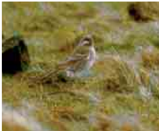
477 Pine Bunting / Witkopgors Emberiza leucocephalos , male, Kooioerdstuijdijk, Ameland, Friesland, 15 March 1998

at Natuurmuseum Fryslân, Leeuwarden), photographed (A Hoekstra; van Dijl & Bosma 2004, Bosma et al 2005; Dutch Birding 27: 316, plate 386-387, 2005); 16-20 November, Beijum, Groningen , Groningen, two, adult male and probably adult female, photographed, sound-recorded, videoed (J G Bosma, R Cazemier, E B Ebels et al; van Dijl & Bosma 2004, Bosma et al 2005, Schoonhoven 2005; Birding World 17: 461, 2004, Dutch Birding 26: 434, plate 612-613, 2004, 27: 74, plate 84, 86, 75, plate 87, 315, plate 385, 318, plate 390-391, 319, plate 392-393, 320, plate 394-395, 321, figure 1-2, 323, plate 396-398, 324, plate 399-401, 326, plate 402, 2005); 16-20 November, Huiswaard, Alkmaar , Noord-Holland, at least one, female-type, photographed (C Seijbel, J Hoedjes; Bosma et al 2005; Dutch Birding 27: 316, plate 388-389, 2005).