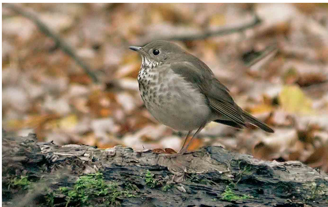
512 Grey-cheeked Thrush / Grijswangdwerglijster Catharus minimus , Northaw Great Wood, Hertfordshire, England, 14 November 2005 (Dave Stewart)