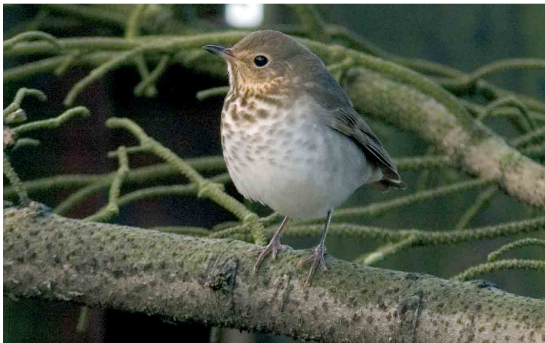
511 Swainson's Thrush / Dwerglijster Catharus ustulatus , Heimaey, Vestmannaeyjar, Iceland, 6 October 2005