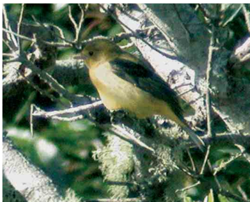
43 Upland Sandpiper / Bartrams Rüter Bartramia longicauda , Ponta Delgada, Flores, Azores, 31 October 2005 (Frédéric Jiguet) 44 Chimney Swift / Schoorsteengierzwaluw Chaetura pelagica , São Miguel, Azores, 28 October 2005 (Frédéric Jiguet) 45 Yellow-billed Cuckoo / Geelsnavelkoekoek Coccyzus americanus , Corvo, Azores, 19 October 2005 (Peter Alfrey) 46 Mourning Dove / Amerikaanse Treurduif Zenaida macroura , Corvo, Azores, 2 November 2005 (Peter Alfrey) 47 American Barn Swallow / Amerikaanse Boerenzwaluw Hirundo rustica erythrogaster , first-winter, Ponta Delgada, Flores, Azores, 30 October 2005 (Frédéric Jiguet) 48 Scarlet Tanager / Zwartvleugeltangare Piranga olivacea , first-winter male, Corvo, Azores, 28 October 2005 (Peter Alfrey) for all, cf Dutch Birding 27: 413, 424-425, 2005