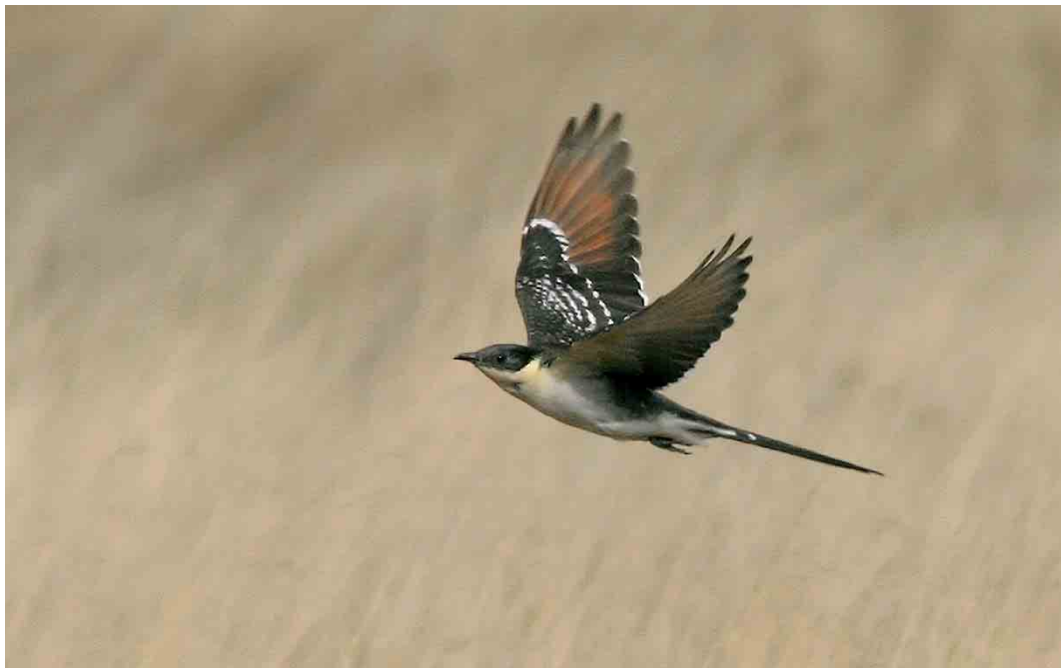
261 Kuifkoekoek / Great Spotted Cuckoo Clamator glandarius , eerste-zomer, Hoge Veluwe, Gelderland, 2 april 2006 (Lesley van Loo)