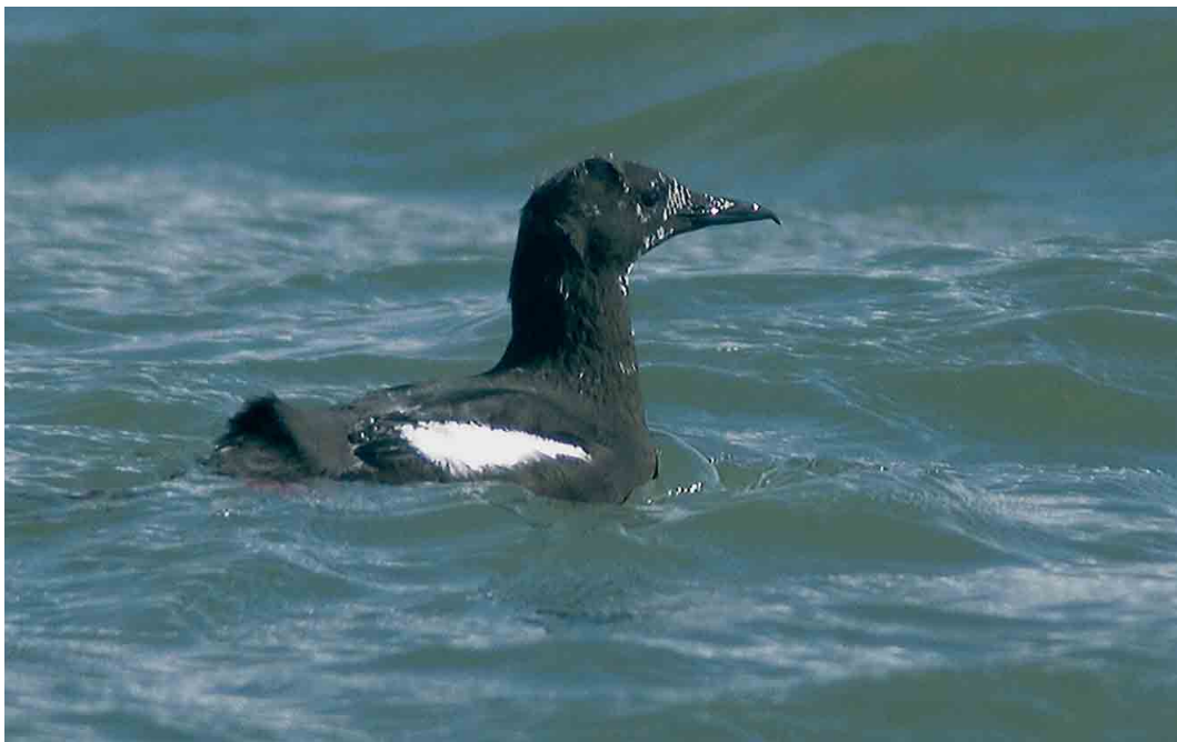
260 Zwarte Zeekoet / Black Guillemot Cephus grylle , adult, NIOZ-haven, Texel, Noord-Holland, 2 april 2006