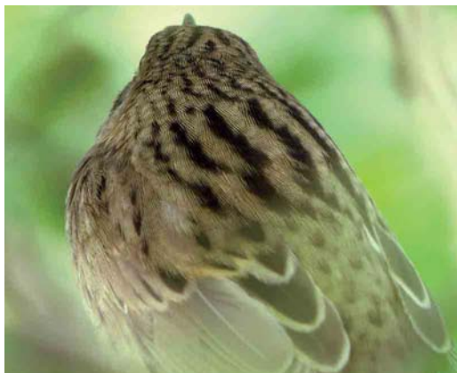
Mystery photograph II (May)

below carefully and identify the birds in the photographs. Solutions can be sent in three different ways: