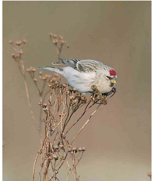
84 Witstuitbarmsijs / Arctic Redpoll Carduelis hornemanni , Zutphen, Gelderland, 29 december 2005 (Laurens B Steijn)

merkt in het noorden van het land. Op 20 november werd een groep van 11 Witkopstaartmezen Aegithalos caudatus caudatus gevangen en geringd op Schiermonnikoog, Friesland. In december waren er groepjes te Den Haag, Zuid-Holland, van 15 tot 22 december (maximaal zes) en bij het Paterswoldsemeer, Groningen, van 12 tot 26 december (ten minste 10). Tot ver in december werd nog een vijftal Taigaboomkruipers Certhia familiaris doorgegeven. Uitzonderlijk laat waren de Grauwe Klauwieren Lanius collurio op 1 en 13 november bij Den Haag en op 14 november bij het Kennemermeer, Noord-Holland. Notenkrakers Nucifraga caryocatactes werden waargenomen op 3 november in Haren, Groningen, op 10 november in Vlaardingen, Zuid-Holland, op 9 december bij Den Helder en op 22 december in Badhoevedorp, Noord-Holland. Een Roze Spreeuw Sturnus roseus verbleef nog tot 13 november bij Oudemirdum. Een andere vloog op 10 november over Vlissingen, Zeeland. Vanaf midden november tot in januari liet een eerstejaars zich bekijken te Wassenaar, Zuid-Holland. In november tekende zich een massieve invasie van Grote Barmsijzen Carduelis flammea af. Vele 1000en werden gemeld en geringd, vooral op 13 en 14 november en in mindere mate tussen 18 en 22 november. In Meijndel, Zuid-Holland, werd op 13 november een exemplaar met een Chinese ring gevangen. Er bleven grote groepen in december, zoals 350 op 24 december bij Zwolle. Met deze golf kwamen ook de meldingen van