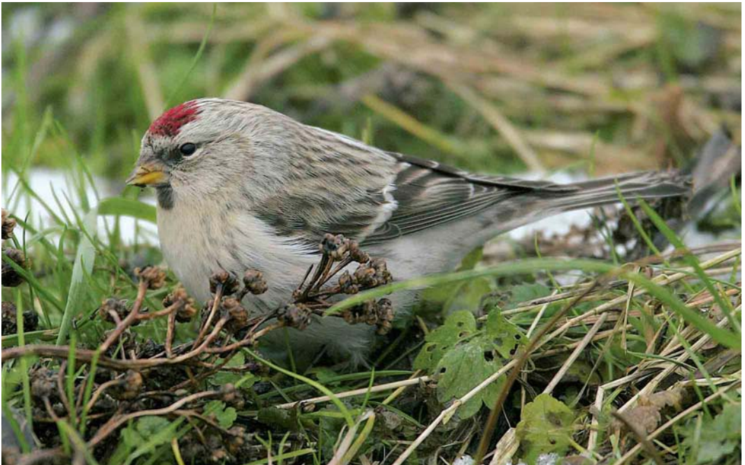
85 Witstuitbarmsijs / Arctic Redpoll Carduelis hornemanni , Zutphen, Gelderland, 31 december 2005