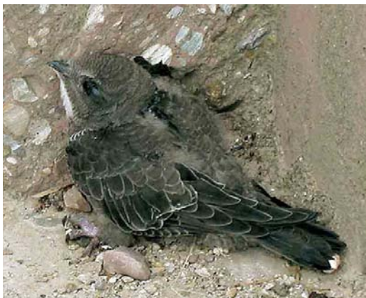
Mystery photograph I (July)