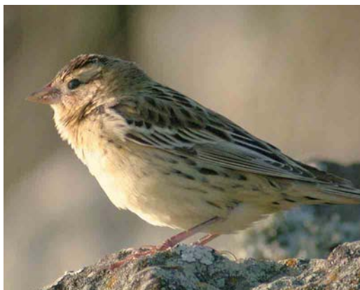
49 Hooded Warbler / Monnikszanger Wilsonia citrina , male, Corvo, Azores, 26 October 2005 (Peter Alfrey) 50 Myrtle Warbler / Mirteszanger Dendroica coronata , Lagoa Azul, São Miguel, Azores, 15 December 2005 (Stefan Pfützke) 51 Indigo Bunting / Indigogors Passerina cyanea , Corvo, Azores, 26 October 2005 (Peter Alfrey) 52 White-crowned Sparrow / Witkruingors Zonotrichia leucophrys , first-winter, Corvo, Azores, 25 October 2005 (Peter Alfrey) 53 Rose-breasted Grosbeak / Roodborstkardinaal Pheucticus ludovicianus , first-winter female, Corvo, Azores, October 2005 (Peter Alfrey) 54 Bobolink / Bobolink Dolichonyx oryzivorus , Corvo, Azores, 24 October 2005 (Peter Alfrey) for all, cf Dutch Birding 27: 413, 424-425, 2005