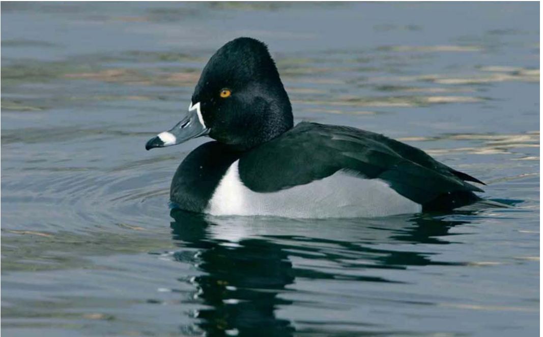
233 Ring-necked Duck / Ringsnaveleend Aythya collaris , adult male, Zürich, Switzerland, 13 March 2006