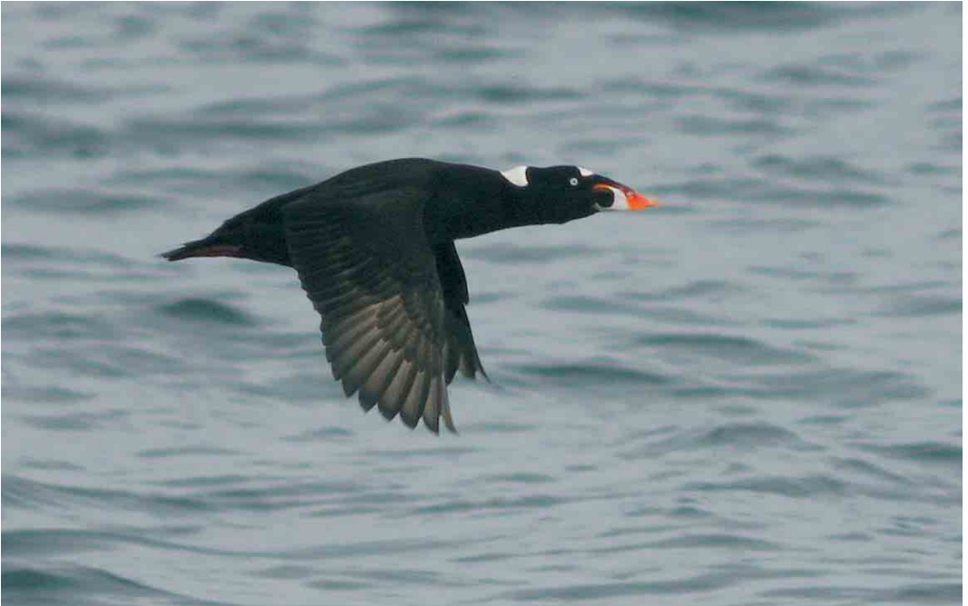
232 Surf Scoter / Brilzee-eend Melanitta perspicillata , adult male, Lista, Vest-Agder, Farsund, Norway, 1 April 2006