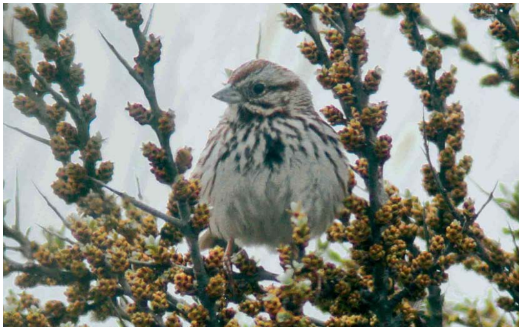
268 Zanggors / Song Sparrow Melospiza melodia , Kabellaarsbank, Zuid-Holland, 30 april 2006 (Pim A Wolf)