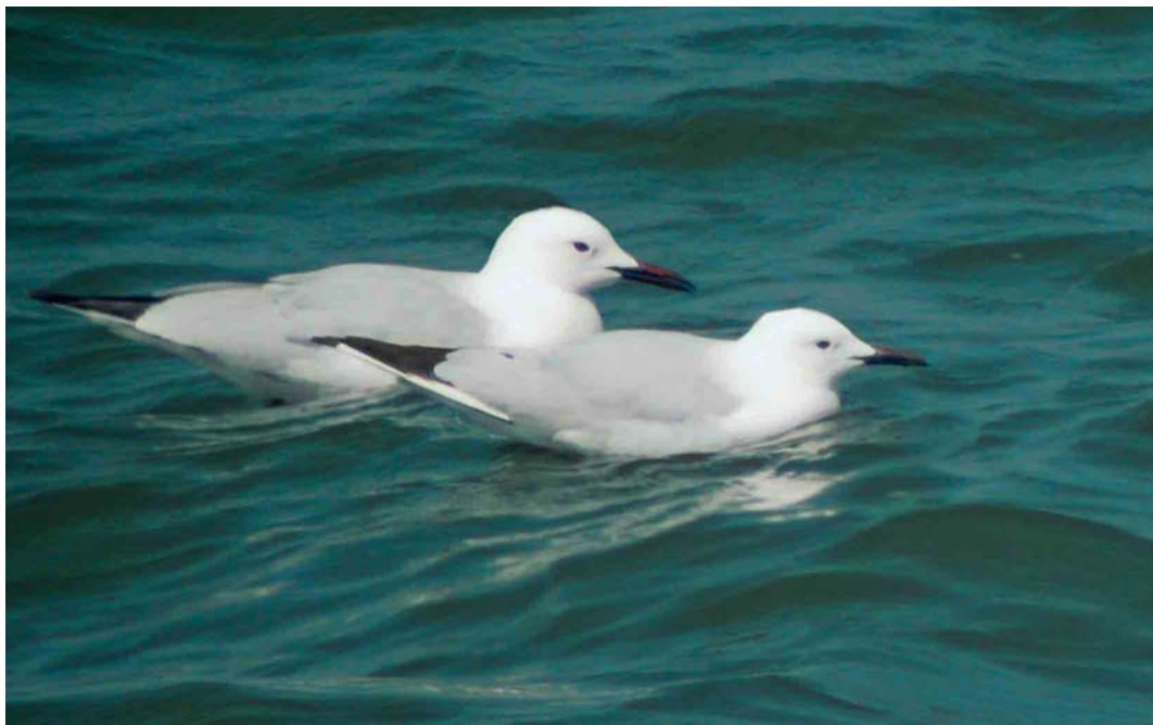
279 Dunbekmeeuwen / Slender-billed Gulls Larus genei , Enkhuizen, Noord-Holland, 6 mei 2006