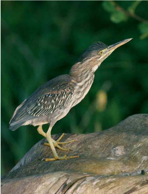
276 Groene Reiger / Green Heron Butorides virescens , eerstejaars, Nieuwe Meer, Amsterdam, Noord-Holland, 29 april 2006 (Harvey van Diek)