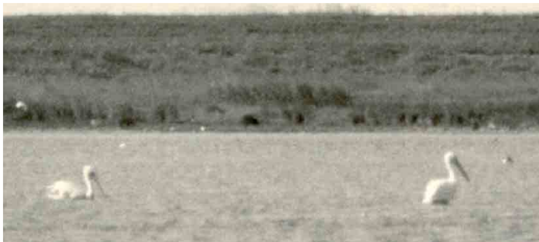
175 Kroeskoppelikaan / Dalmatian Pelican Pelecanus crispus , adult (links) en Roze Pelikaan / Great White Pelican P. onocrotalus , adult, Grevelingen, Zuid-Holland, juni 1975 (Johannes Hameeteman)

Het lijkt aannemelijk dat beide pelikanen in 1975 samen in het Deltagebied zijn gearriveerd maar het is ook denkbaar dat beide apart in Nederland zijn gearriveerd en elkaar vervolgens in het Deltagebied hebben gevonden.