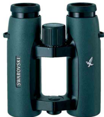
Swarovski 10x32 EL binoculars

Photographs I and II represent the first round of the 2006 competition. Please, study the rules