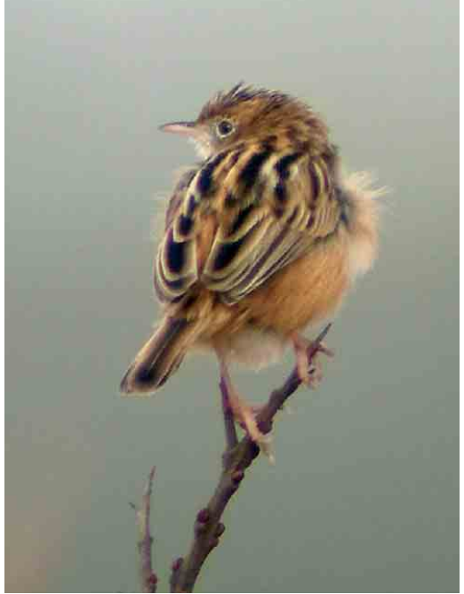
265 Graszanger / Zitting Cisticola juncidis , Lentevreugd, Katwijk, Zuid-Holland, 22 maart 2006 (Menno van Duijn) 266 Graszanger / Zitting Cisticola juncidis , Lentevreugd, Katwijk, Zuid-Holland, 16 maart 2006 (Luuk Punt) 267 Kleine Zwartkop / Sardinian Warbler Sylvia melanocephala , mannetje, Hargen aan Zee, Noord-Holland, 27 april 2006 (Christiaan Giljam)