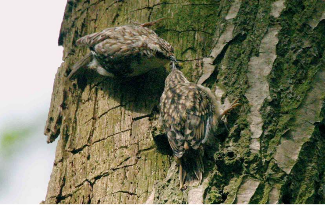
309 Taigaboomkruiper / Eurasian Treecreeper Certhia familiaris met hybride jong Taigaboomkruiper x Boomkruiper / Eurasian x Short-toed Treecreeper C familiaris x brachydactyla , Olst, Overijssel, 25 mei 2005 (Edwin Winkel)

C f familiaris (hierna nominaat familiaris ). Bovendien passen met name de erg witte onderdelen minder goed op Kortsnavelboomkruiper C f macrodactyla (hierna macrodactyla ). De gedachten gingen daarom voorzichtig richting een overzomerende nominaat familiaris die wellicht ging broeden en WT en EW belden nogmaals MZ. Deze arriveerde 's middags en concludeerde, nadat hij de zang en typische srie -roepjes had gehoord, dat het met zekerheid om een Taigaboomkruiper ( macrodactyla of nominaat familiaris ) ging. Ook Rolf de By en Carl Derks bevestigden tijdens een bezoek met MZ op zaterdag 7 mei deze bevinding.