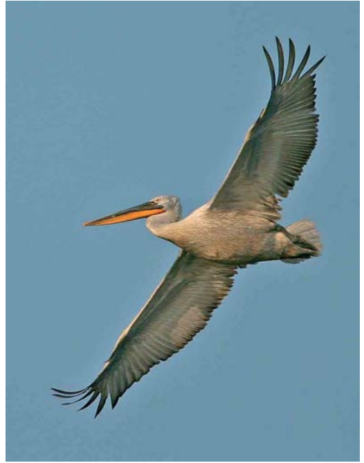
331 Dalmatian Pelican / Kroeskoppelikaan Pelecanus crispus , adult, Przemkow, Silesia, Poland, 4 July 2006 (Mateusz Matysiak)

were seen at a breeding site on Lampedusa in May. A Madeiran Little Shearwater P baroli was reported off Tønsberg, Norway, on 21 June. On a pelagic tour between Madeira and the Selvagens on 26-29 June, more than 100 White-faced Storm-petrels Pelagodroma marina were seen, most of them near the Selvagens but also one 41 nautical miles south of Funchal, Madeira, on 29 June. On the same tour, more than 10 (presumed) Fea's Petrels P feae (with many more near Deserta Grande, Madeira, on 29-30 June), a few Manx Shearwaters P puffinus , a few Madeiran Little Shearwaters , two Wilson's Storm-petrels Oceanites oceanicus , c 12 Madeiran Storm-petrels Oceanodroma castro and, on 29 June, an adult Red-billed Tropicbird Phaethon aethereus and a first-summer Sabine's Gull Larus sabini were noted. An unusual influx of European Storm-petrels Hydrobates pelagicus occurred in the English Channel from 19 May onwards; for instance, c 1000 were seen off Portland Bill, Dorset, England, both on 19 and 20 May, 232 in 2.5 h past Ouessant, Finistère, France, on 21 May, and 369 past Hope's Nose, Devon, England, on 26 May.