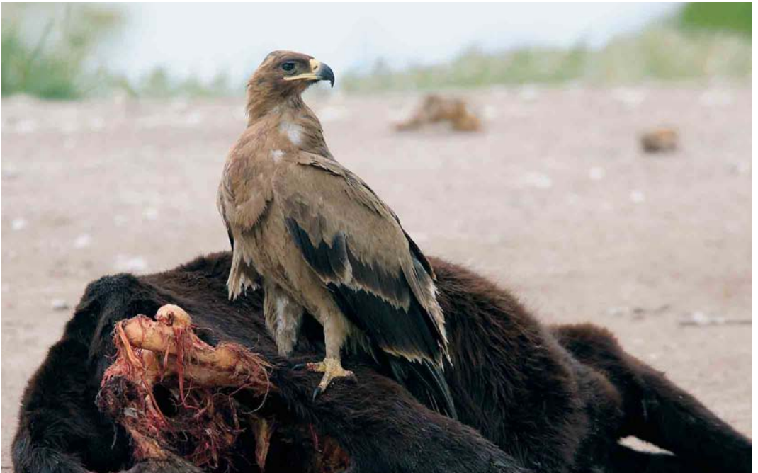
333 Steppe Eagle / Steppearend Aquila nipalensis , Evros delta, Greece, 4 May 2006