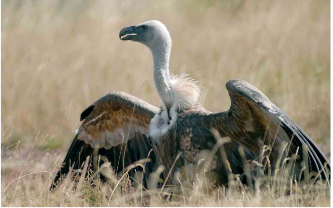
332 Eurasian Griffon Vulture / Vale Gier Gyps fulvus , Baumholder, Rheinland-Pfalz, Germany, 14 July 2006