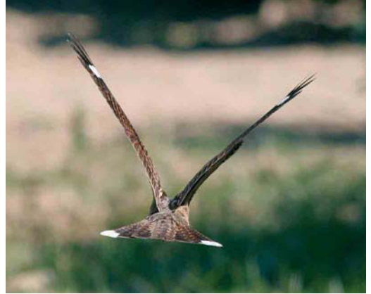
Mystery photograph VIII (June)

islands, is undoubtedly best explained by the age of the bird.