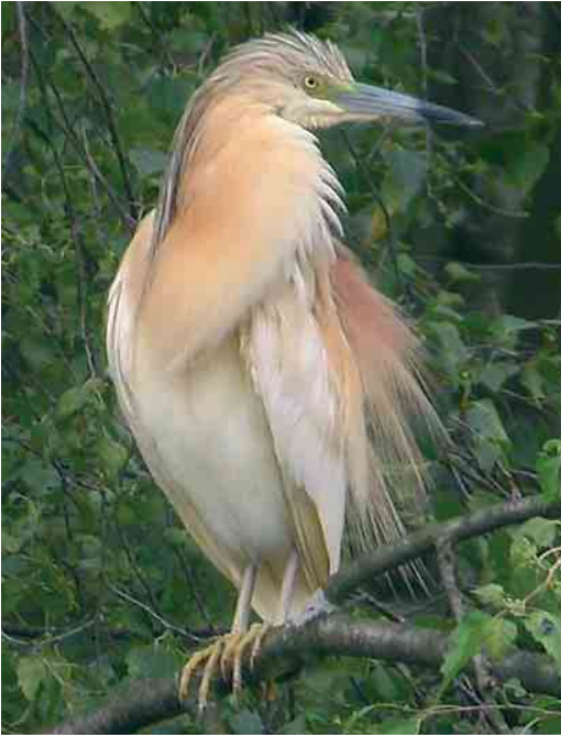
387 Ralreiger / Squacco Heron Ardeola ralloides , Wachtebeke, Oost-Vlaanderen, 27 juni 2006

9 juni in de Achterhaven van Zeebrugge en op 18 juni in Wortel, Antwerpen. Twee schijnbaar ongepaarde mannetjes Woudaap Ixobrychus minutus lieten zich vanaf 4 juni zeer goed bekijken in de Abdij van 't Park in Heverlee. Op 4 mei waren twee Kwakken Nycticorax nycticorax aanwezig bij Watervliet, Oost-Vlaanderen, en van 14 tot 25 mei nog een exemplaar. Op 6 mei was er één in Tervate, West-Vlaanderen; op 5 juni in Lille, Antwerpen; op 11 juni in Hensies; en op 27 juni in De Maten in Genk, Limburg. Een Ralreiger Ardeola ralloides die op 21 mei opdook in Het Vinne in Zoutleeuw, Vlaams-Brabant, bleef daar de hele periode maar bleek doorgaans bijzonder moeilijk te vinden. Op 24 mei foerageerde er één in de Wijvenheide in Zonhoven, Limburg, en op 27 en 28 juni verbleef er één in het Provinciaal Domein Puyenbroeck bij Wachtebeke, Oost-Vlaanderen. De Koereiger Bubulcus ibis die van 2 tot 21 mei in de Kalkense Meersen bij Laarne, Oost-Vlaanderen, verbleef, overnachtte dagelijks in het Molsbroek in Lokeren, Oost-Vlaanderen. Op 3 juni verscheen er kortstondig één in het Mechels Broek bij Mechelen, Antwerpen, en op 9 juni was er één aanwezig bij de Moervaart in Mendonk, Oost-Vlaanderen. Kleine Zilverreigers Egretta garzetta lieten het nagenoeg afweten met maxima van 33 in Het Zwin in Knokke, West-Vlaanderen, op 30 mei; vier in Zeebrugge op 11 en 31 mei; en vier in de Uitkerkse Polders, West-Vlaanderen, op 16 mei. Daarom is de waarneming inte-