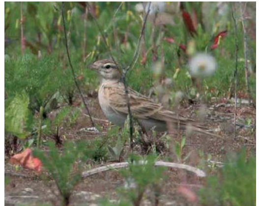
381 Rode Rotslijster / Rufous-tailed Rock Thrush Monticola saxatilis , vrouwtje, Flevocentrale, Lelystad, Flevoland, 8 mei 2006 382 Roodkopkluwvier / Woodchat Shrike Lanius senator , Diemen, Noord-Holland, 13 juni 2006 383 Citroenkwikstaart / Citrine Wagtail Motacilla citreola , vrouwtje, Mariëndal, Den Helder, 5 mei 2006 384 Kortteenleeuwerik / Greater Short-toed Lark Calandrella brachydactyla , Ramspolplaten, Ketelmeer, Overijssel, 12 mei 2006

Bijeneters Merops apiaster gesignaleerd, waaronder acht op 12 juni bij Heumensoord, Gelderland. Daarna volgden er nog vijf op 24 juni bij de Putten van Camperduin. Hoppen Upupa epops fleurden de omgeving op bij de Haringvlietdam, Zuid-Holland, op 2 mei; bij Geldermalsen, Gelderland, op 8 mei; bij De Pan, Zuid-Holland, op 14 mei; bij Nieuw-Leusen, Overijssel, op 16 mei; en in Groningen op 28 mei. Langsvliegende Kortteenleeuweriken Calandrella brachydactyla werden gedetermineerd op 6 en 12 mei bij de Eemshaven en op 8 mei bij Breskens. Op 7 mei foerageerde een exemplaar bij De Cocksdorp op Texel en op 12 mei werd een exemplaar gefotografeerd op het eilandje Ramspolplaten in het Ketelmeer bij Kampen, Overijssel. Een Rotszwaluw Ptyonoprogne rupestris werd gemeld op 3 mei langs de Eemshaven. Tussen 3 en 13 mei stoven 17 Roodstuitzwaluwen Cecropis daurica langs diverse telposten. Grote Piepers Anthus