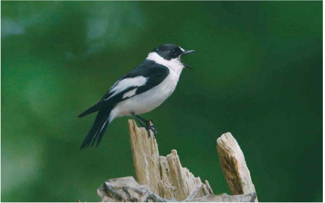
385 Withalsvliegenvanger / Collared Flycatcher Ficedula albicollis , adult mannetje, Noord-Ginkel, Ede, Gelderland, 5 juni 2006