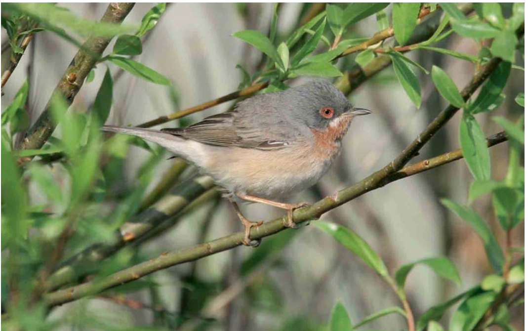
386 Baardgrasmus / Subalpine Warbler Sylvia cantillans , mannetje, Maasvlakte, Zuid-Holland, 11 mei 2006 (Chris van Rijswijk)