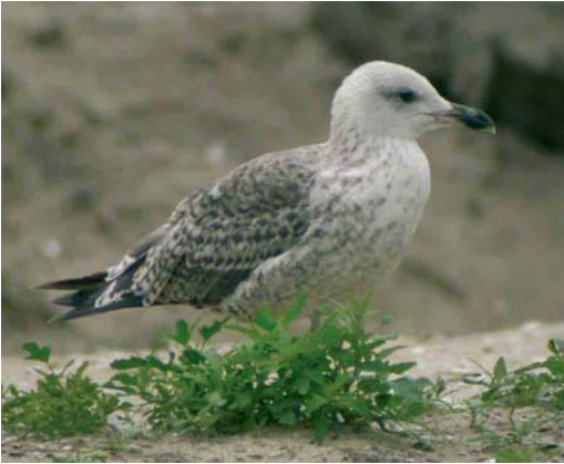
Mystery photograph VII (July)