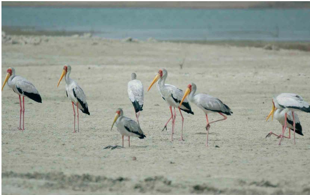
347 Yellow-billed Stork / Afrikaanse Nimmerzat Mycteria ibis , Abu Simbel, Egypt, 2 May 2006 (Eric Didner)