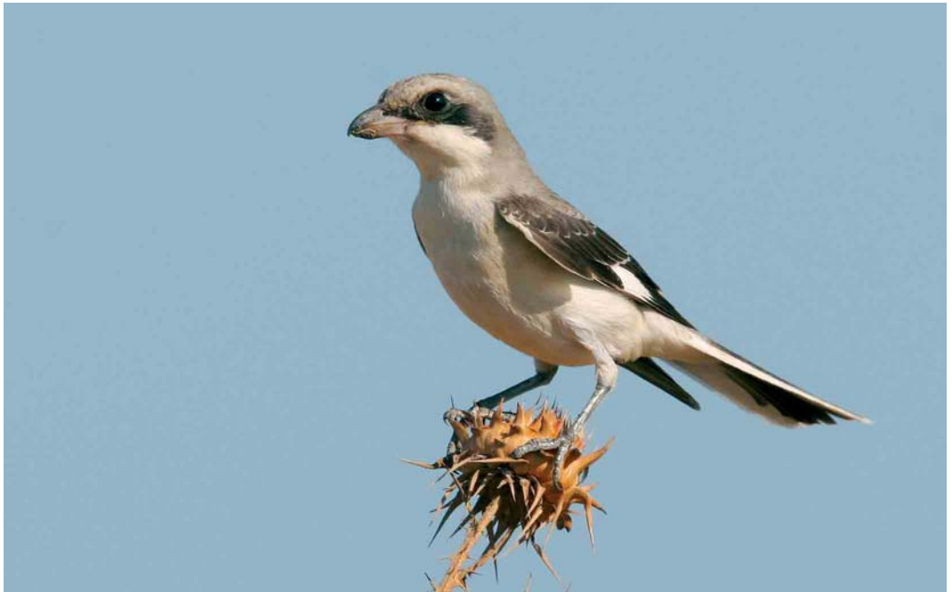
326 Lesser Grey Shrike / Kleine Klapekster Lanius minor , juvenile, Skala Koloni, Lesvos, Greece, August 2005

VI Nearly all entrants recognized the passerine in the mystery photograph as a member of the genus Regulus . Six species have been recorded in the Western Palearctic: Ruby-crowned Kinglet R calendula , Goldcrest R regulus , Azores Kinglet R azoricus , Canary Island Kinglet R teneriffae , Firecrest R ignicapilla and Madeira