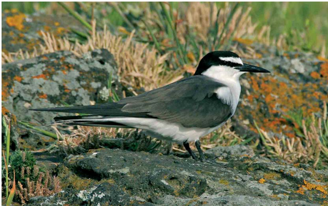
334 Bridled Tern / Brilstern Onychoprion anaethetus , adult, Praia, Graciosa, Azores, June 2006