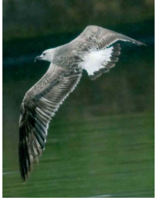
364-365 Baltische Mantelmeeuw / Baltic Gull Larus fuscus fuscus , eerste-zomer, Erasmusgracht, Amsterdam, Noord-Holland, 25 mei 2006 366 Slangenarend / Short-toed Eagle Circaetus gallicus (opgeraapt bij Maarheeze, Noord-Brabant, op 26 mei 2006), Someren, Noord-Brabant, 30 mei 2006 367 Noordse Nachtegaal / Thrush Nightingale Luscinia luscinia , Thorn, Limburg, 15 mei 2006