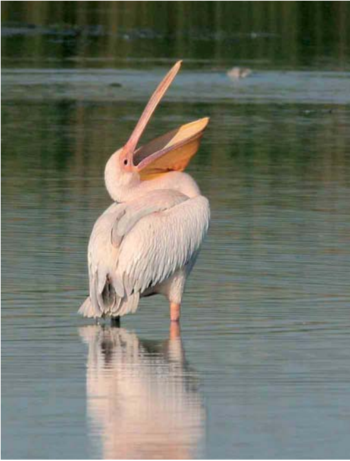
330 Great White Pelican / Roze Pelikaan Pelecanus onocrotalus , Sehlendorfer See, Schleswig-Holstein, Germany, 13 July 2006 (Stefan Pflützke)