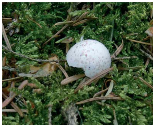
310 Kortsnavelboomkruiper / European Treecreeper Certhia familiaris macrodactyla , Lonnekerberg, Overijssel, 9 mei 2006 (Carl Derks) 311 Kortsnavelboomkruiper / European Treecreeper Certhia familiaris macrodactyla , Lonnekerberg, Overijssel, 21 mei 2006 (Carl Derks) 312 Kortsnavelboomkruiper / European Treecreeper Certhia familiaris macrodactyla , Lonnekerberg, Overijssel, 9 mei 2006 (Carl Derks) 313 Eierschaal van Kortsnavelboomkruiper / egg shell of European Treecreeper Certhia familiaris macrodactyla , Lonnekerberg, Overijssel, 15 mei 2006 (Carl Derks)

Duitse bosreservaat Samerrott nabij Schüttof, Niedersachsen, c 25 km ten oosten van Oldenzaal, Overijssel (Winkel et al 2006).