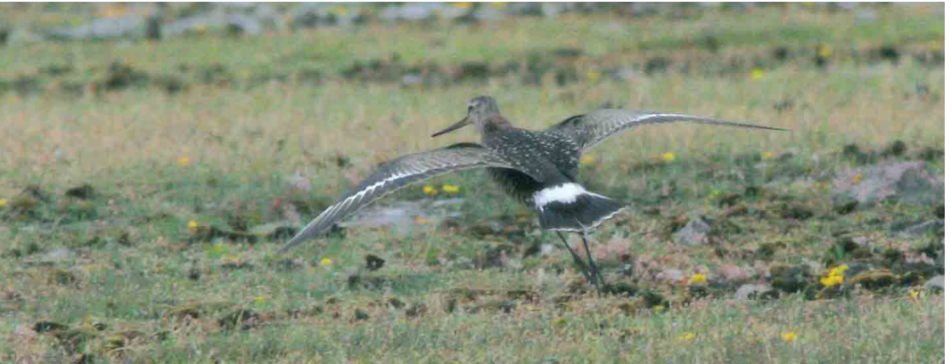
336 Crab-plovers / Krabplevieren Dromas ardeola , Hamata, Egypt, 28 April 2006 ( Eric Didner ) 337 Semipalmated Plover / Amerikaanse Bontbekplevier Charadrius semipalmatus , Cabo da Praia, Terceira, Azores, 11 June 2006 ( Mark Bolton ) 338 Greater Painted-snipe / Goudsnip Rostratula benghalensis , Abu Simbel, Egypt, 3 May 2006 ( Eric Didner ) 339 Broad-billed Sandpiper / Breedbekstrandloper Limicola falcinellus , Ghadira, Malta, 11 May 2006 ( Raymond Galea ) 340 Hudsonian Godwit / Rode Grutto Limosa haemastica , adult, Ottenby, Öland, Sweden, 27 June 2006 ( Christian Cederroth )