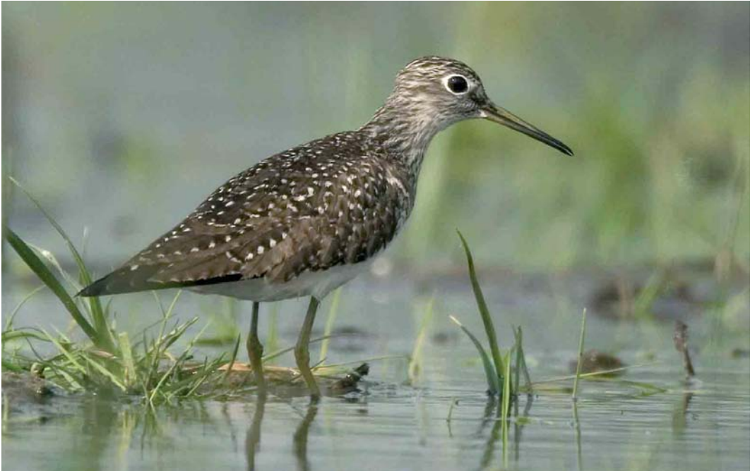
359 Amerikaanse Bosruiter / Solitary Sandpiper Tringa solitaria , Bokkegat, Wissenkerke, Zeeland, 17 mei 2006 (Harvey van Diek)