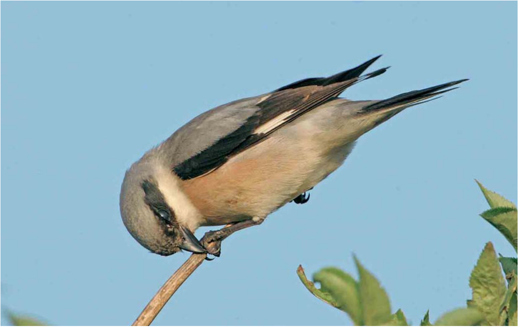
356 Lesser Grey Shrike / Kleine Klapekster Lanius minor , Shingle Street, Suffolk, England, 8 July 2006