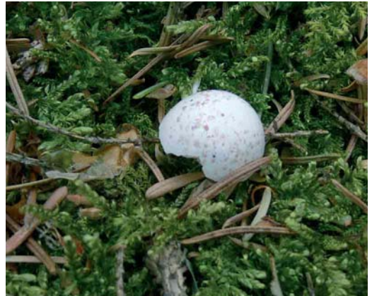
310 Kortsnavelboomkruiper / European Treecreeper Certhia familiaris macrodactyla , Lonnekerberg, Overijssel, 9 mei 2006 (Carl Derks) 311 Kortsnavelboomkruiper / European Treecreeper Certhia familiaris macrodactyla , Lonnekerberg, Overijssel, 21 mei 2006 (Carl Derks) 312 Kortsnavelboomkruiper / European Treecreeper Certhia familiaris macrodactyla , Lonnekerberg, Overijssel, 9 mei 2006 (Carl Derks) 313 Eierschaal van Kortsnavelboomkruiper / egg shell of European Treecreeper Certhia familiaris macrodactyla , Lonnekerberg, Overijssel, 15 mei 2006 (Carl Derks)

Duitse bosreservaat Samerrott nabij Schüttof, Niedersachsen, c 25 km ten oosten van Oldenzaal, Overijssel (Winkel et al 2006).