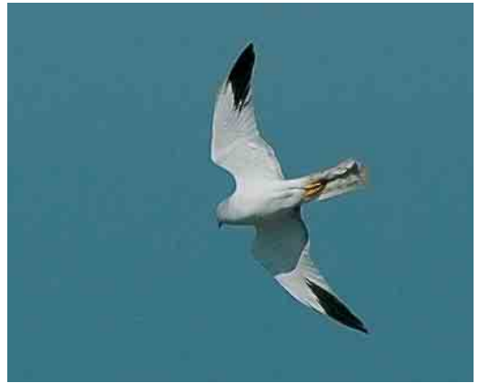
372 Vale Gier / Eurasian Griffon Vulture Gyps fulvus , Koudekerke, Zeeland, 5 juni 2006 373 Vale Gier / Eurasian Griffon Vulture Gyps fulvus , Daalakkers, Westerhoven, Noord-Brabant, 19 juni 2006 374 Lammergeier / Lammergeier Gypaetus barbatus , onvolwassen, Kale Duinen, Appelscha, Friesland, 17 mei 2006 375 Steppekiekendief / Pallid Harrier Circus macrourus , mannetje, Eemshaven, Groningen, 5 mei 2006

ge kennis van zaken is vooralsnog niet hard te maken dat het inderdaad deze soort betrof. Er werden c acht Grote Burgemeesters L hyperboreus gemeld, waaronder de trouwe vogel van Katwijk aan Zee, Zuid-Holland, die tot in juli bleef. Kleine Burgemeesters L glaucoides werden gezien op 1 mei bij Bergen op Zoom, Noord-Brabant; op 3 en 6 mei bij Egmond aan Zee, Noord-Holland; op 9 mei langs de Eemshaven; op 4 juni bij de Westerslag op Texel; en op 8 juni bij Katwijk aan Zee. Verspreid over de maand mei werden 11 Lachsterns Gelochelidon nilotica gezien en in juni nog drie, waaronder een exemplaar op 13 en 14 juni in de Balgzandpolder. Er waren veel Witwangsterns Chlidonias hybrida met in mei 53, waaronder van 6 tot 14 mei maximaal zeven op de vloeivelden van de suikerfabriek bij Hoogkerk, Groningen, tussen 6 en 14 mei 19 langs de Eemshaven, met alleen al op 14 mei negen, op 10 mei vijf bij Nieuwolda, Groningen, en