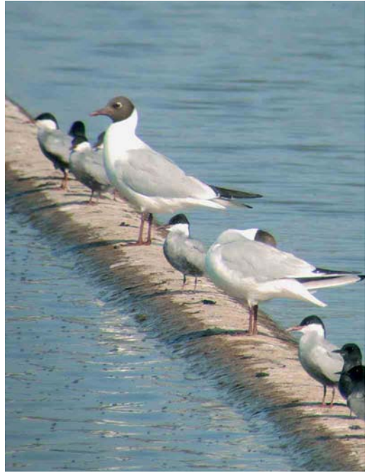
361 Witvleugelstern / White-winged Tern Chlidonias leucopterus , adult, Cellemuiden, Overijssel, 3 mei 2006 362 Witwangsterns / Whiskered Terns Chlidonias hybrida , adult, Hoogkerk, Groningen, Groningen, 10 mei 2006 363 Dougalls Stern / Roseate Tern Sterna dougallii , adult, De Putten, Camperduin, Noord-Holland, 24 mei 2006