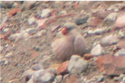
323-324 Woestijnvink / Trumpeter Finch Bucanetes githagineus , Eemshaven, Groningen, 12 juni 2005

De determinatie van de vogel was vrij eenvoudig door de combinatie van klein formaat, plompe bouw, rozeachtig verenkleed en grote rode snavel (cf Clement et al 1993, Cramp & Simmons 1994, Snow & Perrins 1998, Svensson et al 2002). Woestijnvink kan worden verward met Vale Woestijnvink Rhodospiza obsoleta . Deze is echter zandkleurig en heeft een zwarte snavel. Deze soort is grotendeels standvogel en een onwaarschijnlijke dwaalgast in Europa (de westrand van het verspreidingsgebied ligt in Oost-Turkije); er zijn echter wel verschillende waarnemingen van escapes in Nederland bekend (Ebels 1996, 2004). Verder lijkt Woestijnvink wel wat op Rode Woestijnvink Rhodopechys sanguineus . Deze soort komt voor in de berggebieden van Azië (Aziatische Rode Woestijnvink R s sanguineus ) en in de Hoge Atlas in Noordwest-Afrika (Afrikaanse Rode Woestijnvink R s alienus ). In tegenstelling tot Woestijnvink heeft Rode Woestijnvink een zwarte kruin en bruine flanken. Het is een bergvogel en grotendeels standvogel, die 's winters soms naar lager gelegen gebieden migreert. Voorkomen als wilde vogel in Europa is onwaarschijnlijk; er zijn ook (nog) geen meldingen van deze soort als escape bekend. De enige andere Bucanetes -soort is Mongoolse Woes-