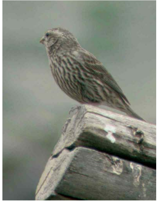
297 Blyth's Rosefinch / Blyths Roodmus Carpodacus grandis , female-type, Ladakh, India, July 2004 ( Daniel Matti ). Like in adult males, supercilium of female-type grandis is rather long. Note distinct dark streaking on underparts.

Females of the western subspecies of Himalayan White-browed Rosefinch C thura blythi are superficially similar to female grandis but are smaller, with a much narrower bill. The supercilium is more contrastingly toned buffish, the lower throat and the breast have a buffish wash and the blackish-streaked rump is yellowish-olive.