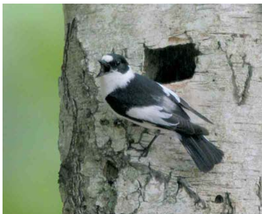
350 Audouin's Gull / Audouins Meeuw Larus audouinii , Helsingør, Sjælland, Denmark, 9 June 2006 351 Red-billed Tropicbird / Roodsnavelkeerringvogel Phaethon aethereus , south of Madeira, 29 June 2006 352 Subalpine Warbler / Baardgrasmus Sylvia cantillans , male, Helgoland, Schleswig-Holstein, Germany, 15 May 2006 353 Rock Bunting / Grijze Gors Emberiza cia , male, Helgoland, Schleswig-Holstein, Germany, 11 May 2006 354 Blyth's Reed Warbler / Struikrietzanger Acrocephalus dumetorum , male, Bialystok, Podfaskie, Poland, 3 June 2006 355 Collared Flycatcher / Withalsvliegenvanger Ficedula albicollis , adult male, Noord-Ginkel, Ede, Gelderland, Netherlands, 5 June 2006