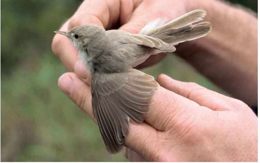
304-305 Sykes' Spotvogel / Sykes's Warbler Acrocephalus rama , Almere-Haven, Flevoland, 11 oktober 1986 (Karel A Mauer)