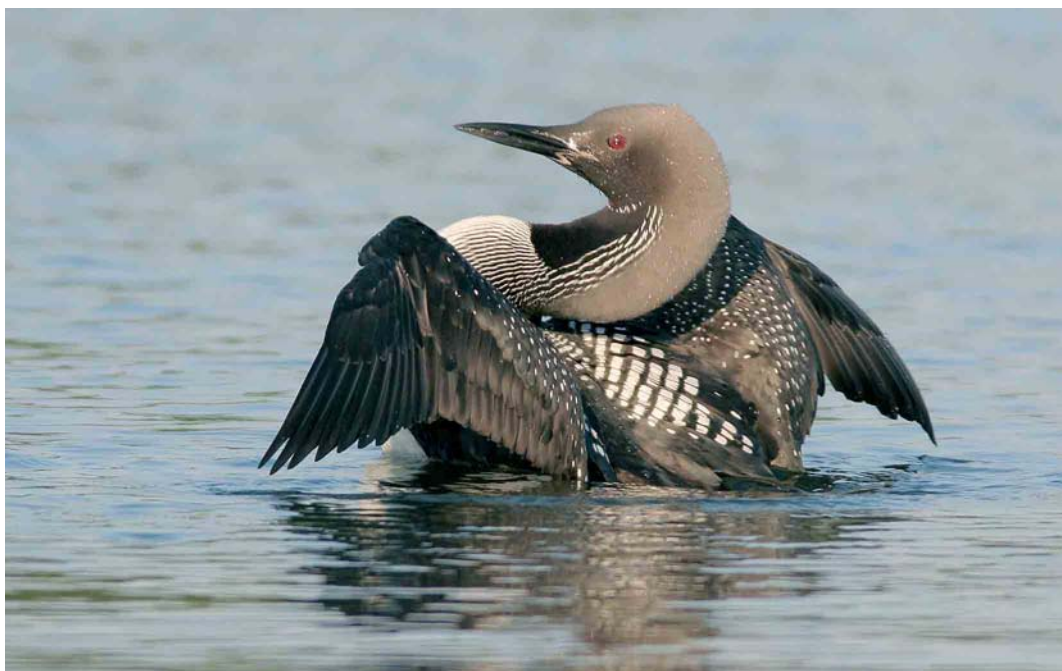
335 Black-throated Loon / Parelduiker Gavia arctica , adult summer, Bremen, Bremen, Germany, July 2006