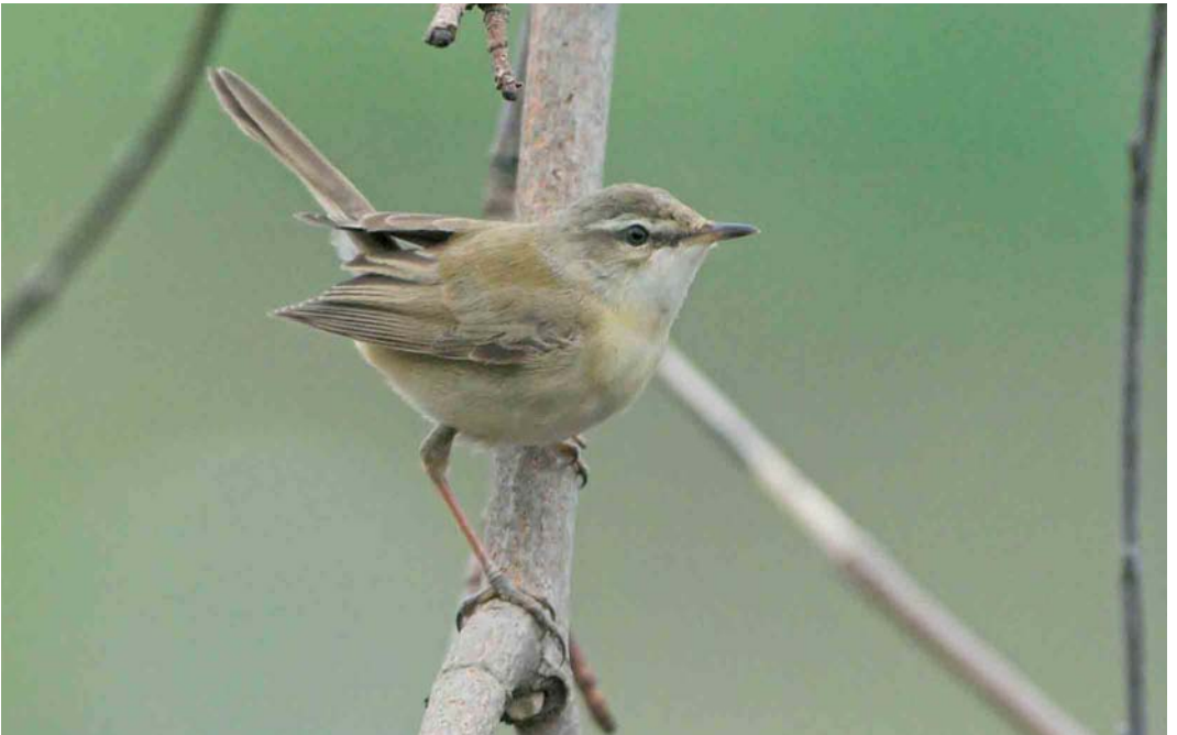
357 Paddyfield Warbler / Veldrietzanger Acrocephalus agricola , Helgoland, Schleswig-Holstein, Germany, 18 May 2006