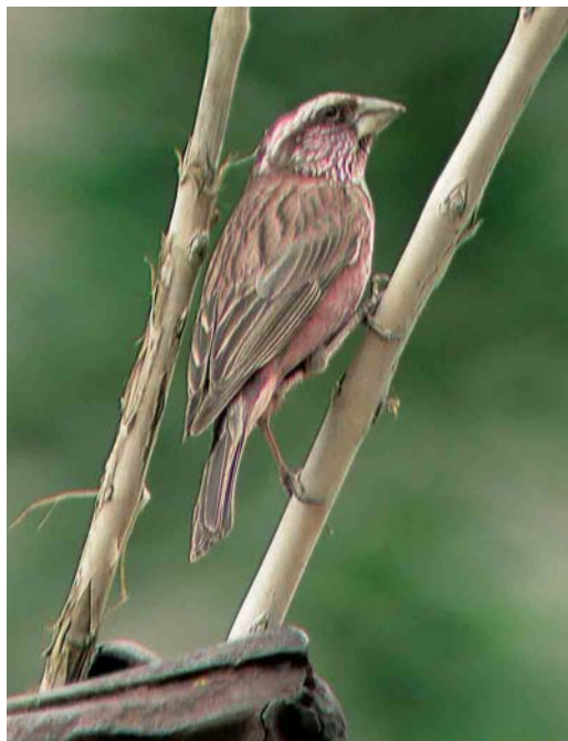
291 Blyth's Rosefinch / Blyths Roodmus Carpodacus grandis , adult male, Ladakh, India, July 2004 ( Daniel Matti ). Typical bird showing strong and sharply demarcated supercilium, strong white marking on cheek and rather long primary projection.

Numerous slight differences in basic colour have been described between the two taxa. In absence of a colour standard, however, these specifications do often not become very clear and even seem contradictory. We think that calling rhodochlamys 'brighter' is misleading, because grandis can be quite pale and intensively coloured in pinkish and even visibly orange colour tones. In the numerous skins, we found extraordinary variation in underpart coloration of both taxa and, also in the field, we could not detect any consistent differences. As far as the upperparts are concerned, we prefer to call male rhodochlamys 'richer'