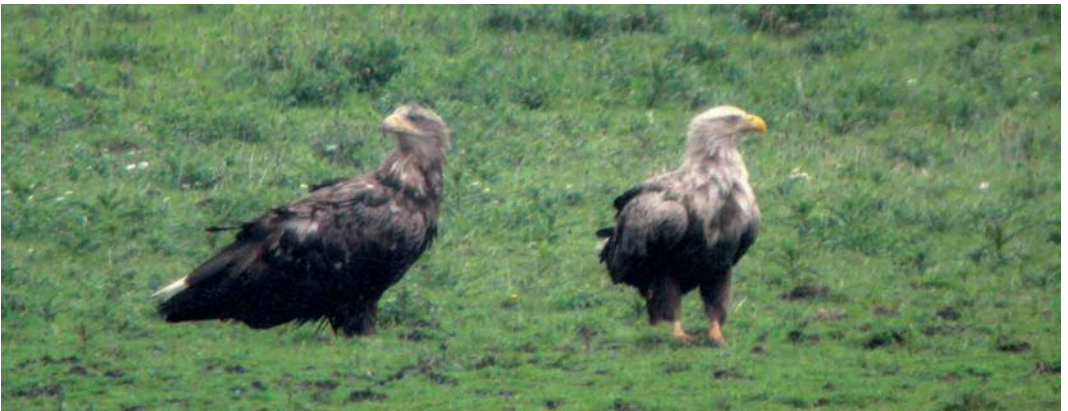
376 Rode Wouw / Red Kite Milvus milvus , Den Nul, Overijssel, 28 april 2006 377 Roodpootvalk / Red-footed Falcon Falco vespertinus , vrouwtje, Fochteloërveen, Friesland, 15 mei 2006 378 Amerikaanse Goudplevier / American Golden Plover Pluvialis dominica , Den Helder, Noord-Holland, 13 mei 2006 379 Ralreiger / Squacco Heron Ardeola ralloides , Lentevreugd, Wassenaar, Zuid-Holland, 18 juni 2006 380 Zeearenden / White-tailed Eagles Haliaeetus albicilla , adult mannetje en subadult vrouwtje, Oostvaardersplassen, Flevoland, 27 mei 2006