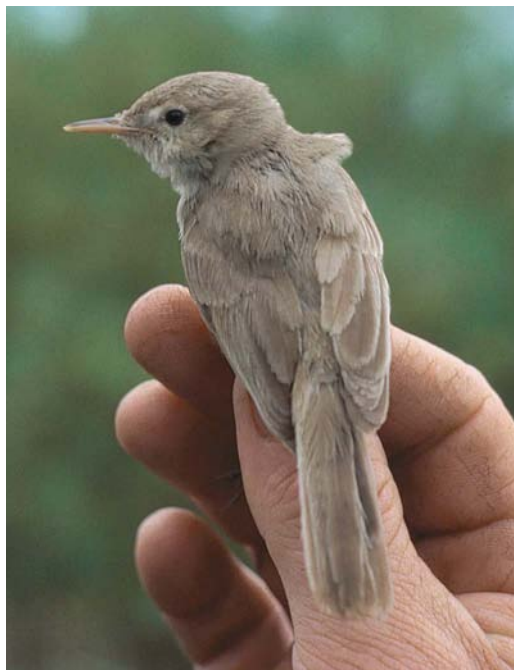
306 Sykes' Spotvogel / Sykes's Warbler Acrocephalus rama , Almere-Haven, Flevoland, 11 oktober 1986 (Karel A Mauer)

GROOTTE & BOUW Kleine Acrocephalus -achtige vogel met ronde kop als van Hippolais -spotvogel. Vleugel kort, vleugelpunt iets voorbij bovenstaartdekveren stekend. Staart vrij lang lijkend. Staarteinde hoekig, niet afgerond. Snavelbasis breed. Aan beide zijden van snavel drie snorharen. Poot relatief stevig. KOP Voorhoofd, kruin en nek grijsbruin. Oorstreek licht grijsbruin, naar voren toe lichter wordend en voor oog samenvloei-