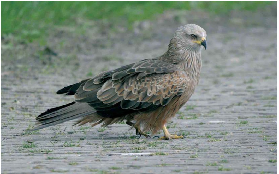
360 Zwarte Wouw / Black Kite Milvus migrans , Zuiderkwelweg, Wieringermeer, Noord-Holland, 28 mei 2006