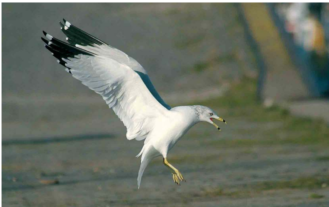
77 Ringsnavelmeeuw / Ring-billed Gull Larus delawarensis , adult, Tiel, Gelderland, 9 januari 2006