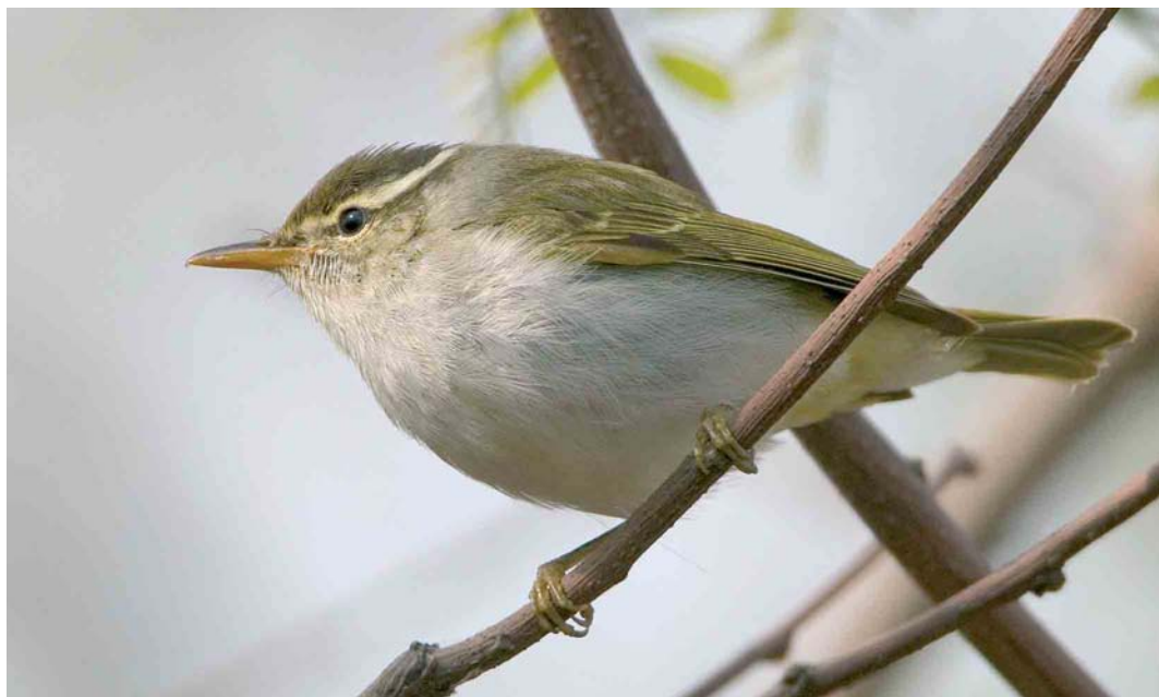
28 Eastern Crowned Warbler / Kroonboszanger Phylloscopus coronatus , Happy Island, Hebei, China, 4 May 2005. Eastern Crowned Warbler can appear rather similar to Arctic Warbler P borealis . Distinguishing features visible in this plate include the clean white underparts and the dark crown-side. 29 Eastern Crowned Warbler / Kroonboszanger Phylloscopus coronatus , Happy Island, Hebei, China, May 2005. From the Phylloscopus warblers recorded in the Western Palearctic, Eastern Crowned Warbler is the only species combining a pale median crown-stripe with plain tertials. Note also the strongly contrasting dark crown-side and the double wing-bar.