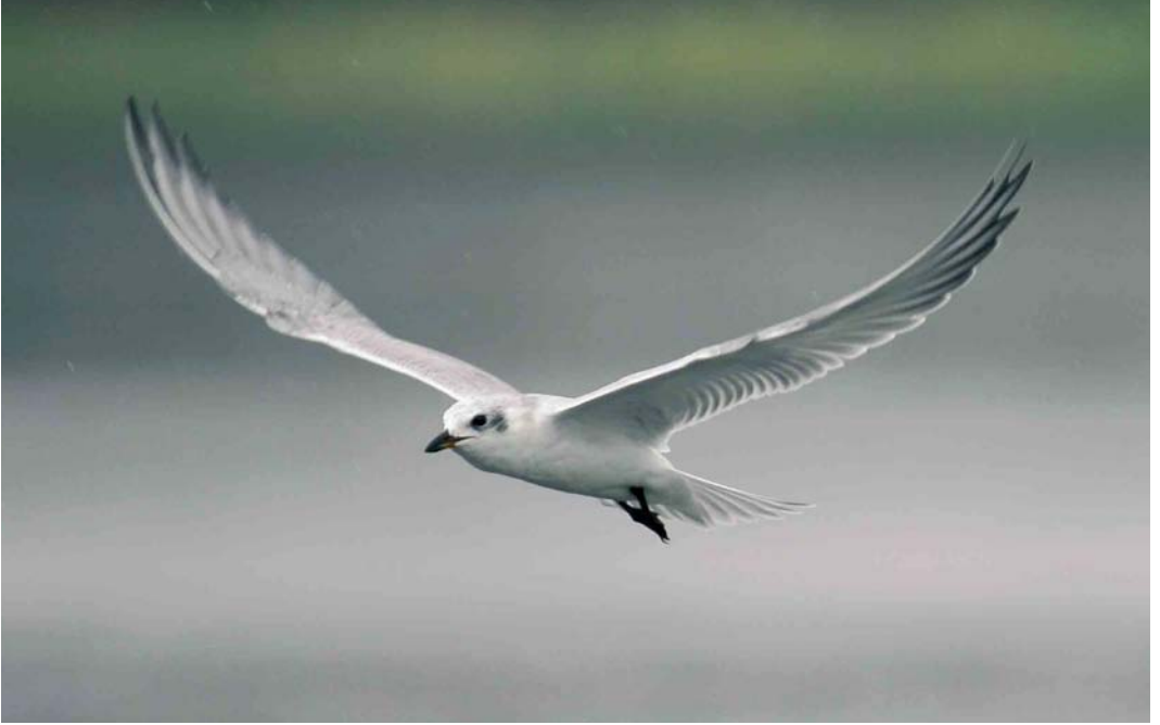
456 Lachstern / Gull-billed Tern Gelochelidon nilotica , 't Zand, Noord-Holland, 30 juli 2006