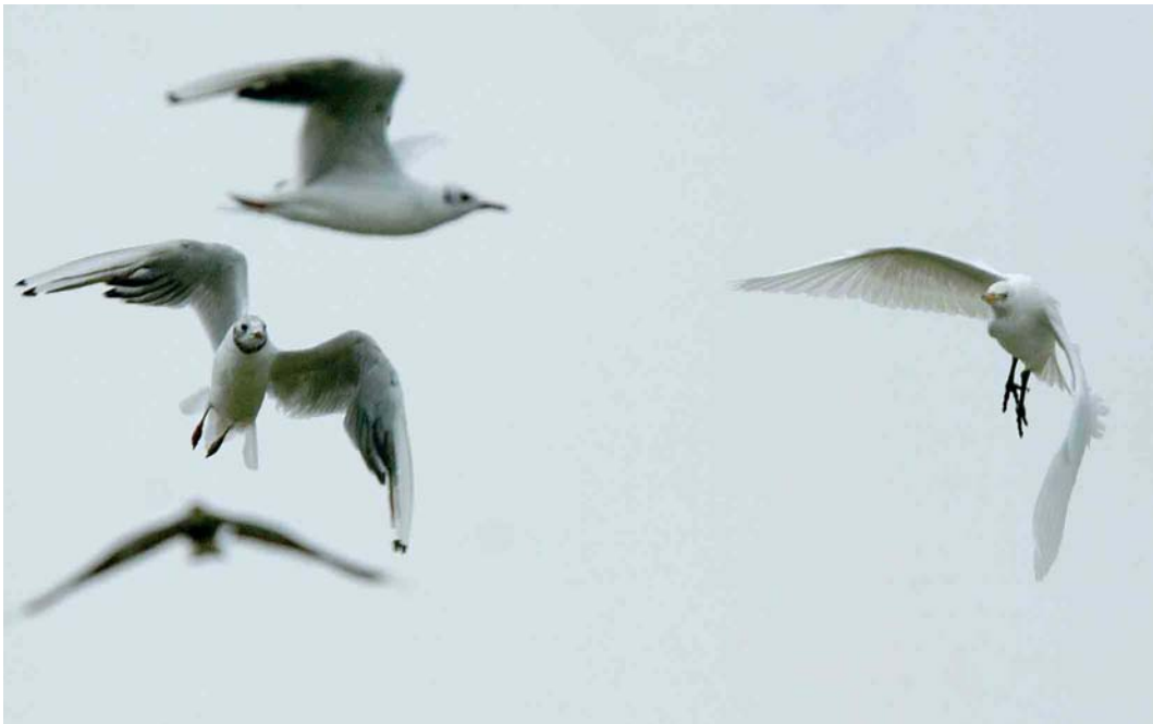
451 Koereiger / Cattle Egret Bubulcus ibis , met Kokmeeuwen / Black-headed Gulls Larus ridibundus , Middelaar, Limburg, 28 juli 2006 (Harvey van Diek)