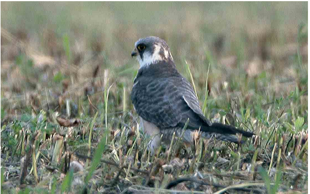
434 Amur Falcon / Amoerroodpootvalk Falco amurensis , female, Jaszbereny, Hungary, July 2006 (János Oláh)