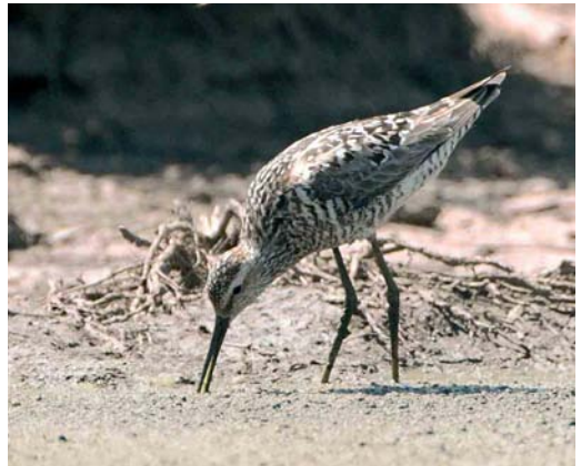
437 Dalmatian Pelican / Kroeskoppelikaan Pelecanus crispus , Ørum Sø, Thy, Denmark, 4 August 2006 438 Spotted Sandpiper / Amerikaanse Oeverloper Actitis macularius , Ballysteen, Limerick, Ireland, 22 August 2006 439 Stilt Sandpiper / Steltstrandloper Calidris himantopus (right), with Common Redshank / Tureluur Tringa totanus , Brownsea Island, Poole, Dorset, 15 August 2006 440 Stilt Sandpiper / Steltstrandloper Calidris himantopus , adult, Hortobágy, Hungary, July 2006

from 30 July into September was considered an escape because of wing damage. Also in England, one was tracked along the Norfolk coast on 16 August and seen at Preston, Lancashire, on 18-24 August and then in Cleveland on 26 August after which it headed north into Northumberland, where it remained until at least 6 September; it was rather confiding and therefore, rightly or wrongly, regarded as an escape by many observers. In the Camargue, Bouches-du-Rhône, France, one was reported on 12-13 August. The first-summer Dalmatian Pelican P. crispus at fish ponds near Przemkow, Silesia, Poland, from 25 June into July moved north and was at Dithmarscher Speicherkoog, Schleswig-Holstein, Germany, on 19-22 July and then in Denmark where it was last seen at Ørum Sø, Sydthy, Nordjylland, on 6 August. The first Indian Pond Heron Ardeola grayii for the WP was photographed on Crocodile Island, Luxor, Egypt, on 24 April 2004 (cf Alula 12: