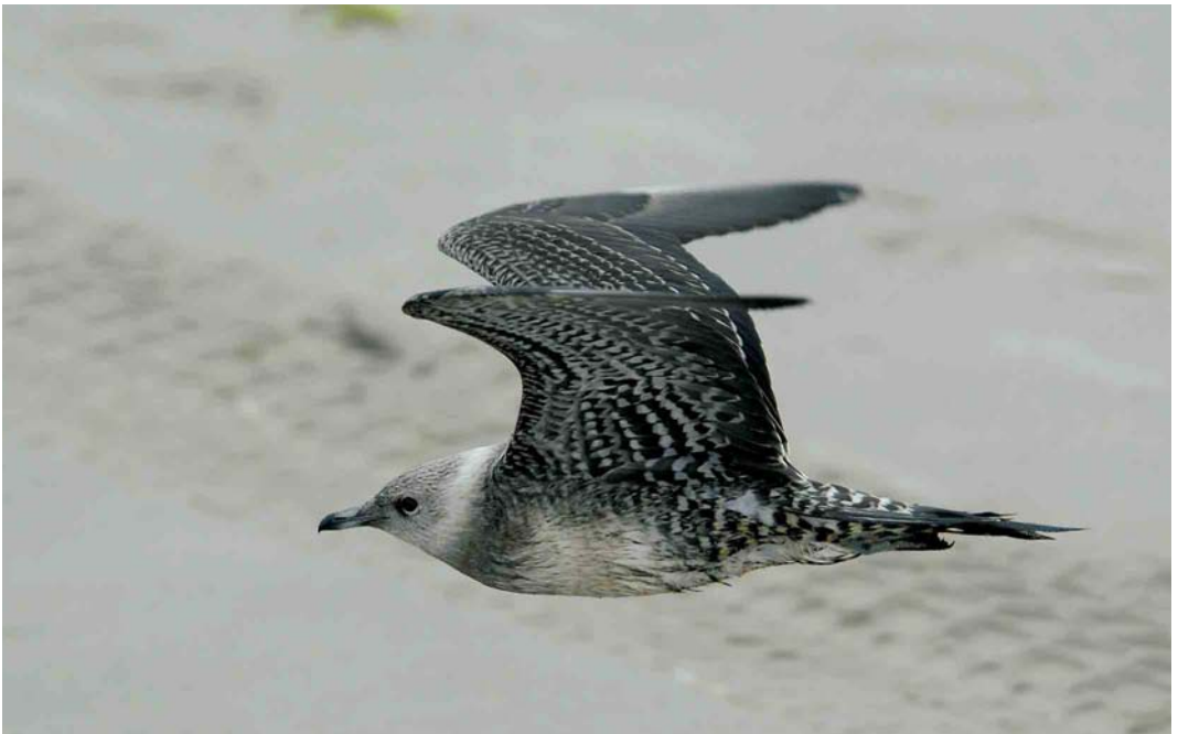
461 Kleinste Jager / Long-tailed Jaeger Stercorarius longicaudus , juveniel, Hondsbossche Zeewering, Noord-Holland, 30 augustus 2006