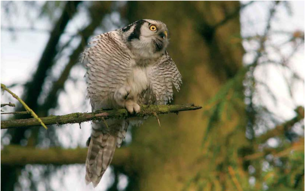
410 Sperweruil / Northern Hawk Owl Surnia ulula ulula , eerstejaars, Westerbork, Drenthe, 31 oktober 2005 (Michel Veldt)

de foto's en videobeelden op. Ondertussen joeg hij regelmatig. Dit resulteerde in de vangst van meerdere muizen, waaronder Bosmuizen Apodemus sylvaticus . Hij werd gezien tot het invallen van de duisternis, rond 16:30. Tegen de verwachting en hoop van velen in kon hij de volgende dag helaas niet meer worden gevonden (cf Alblas 2005).