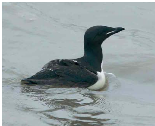
475 Kortbekzeekoet / Brunnich's Murre Uria lomvia , adult (opgeraapt bij Lille, Antwerpen, op 5 augustus 2006), Oostende, West-Vlaanderen, 15 augustus 2006 (Bart Heirweg)