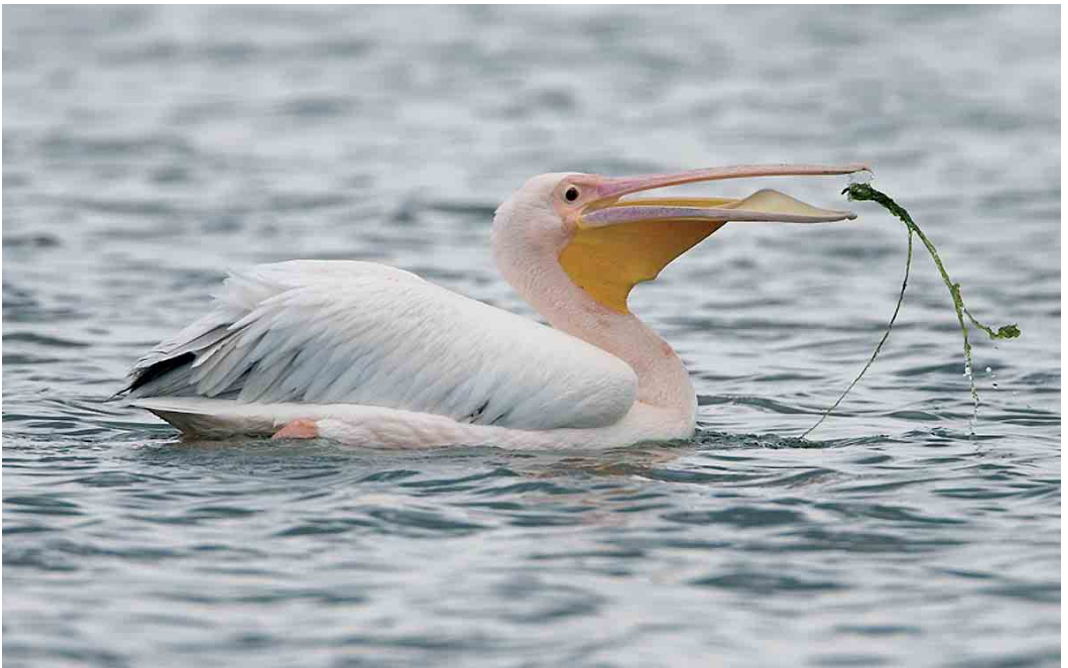
452 Roze Pelikaan / Great White Pelican Pelecanus onocrotalus , Mariëndal, Den Helder, Noord-Holland, 9 augustus 2006 (Christiaan Giljam)