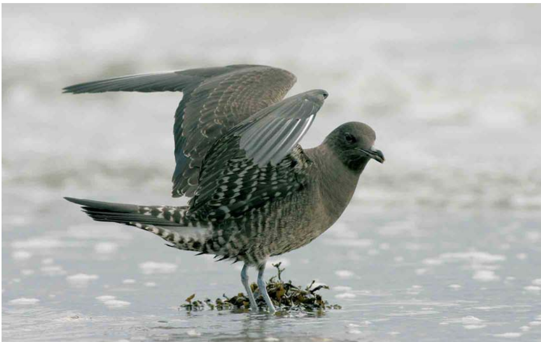
459 Kleinste Jager / Long-tailed Jaeger Stercorarius longicaudus , juveniel, Vlissingen, Zeeland, 31 augustus 2006