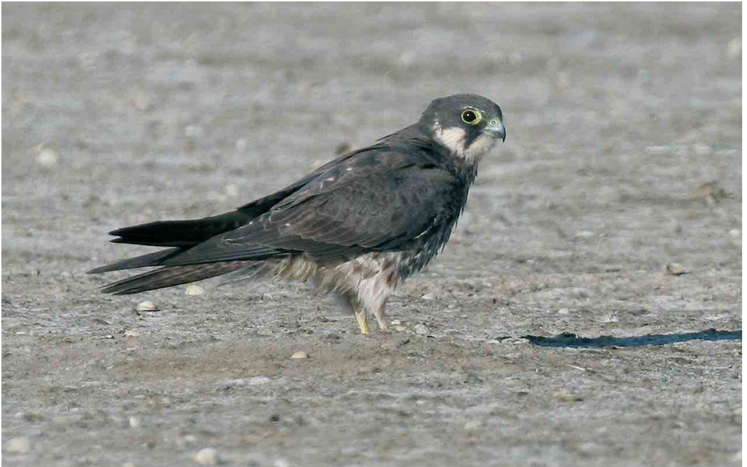
433 Eleonora's Falcon / Eleonora's Valk Falco eleonora , immature, Piémanson, Camargue, Bouches-du-Rhône, France, 14 August 2006 (Marc Thibault)