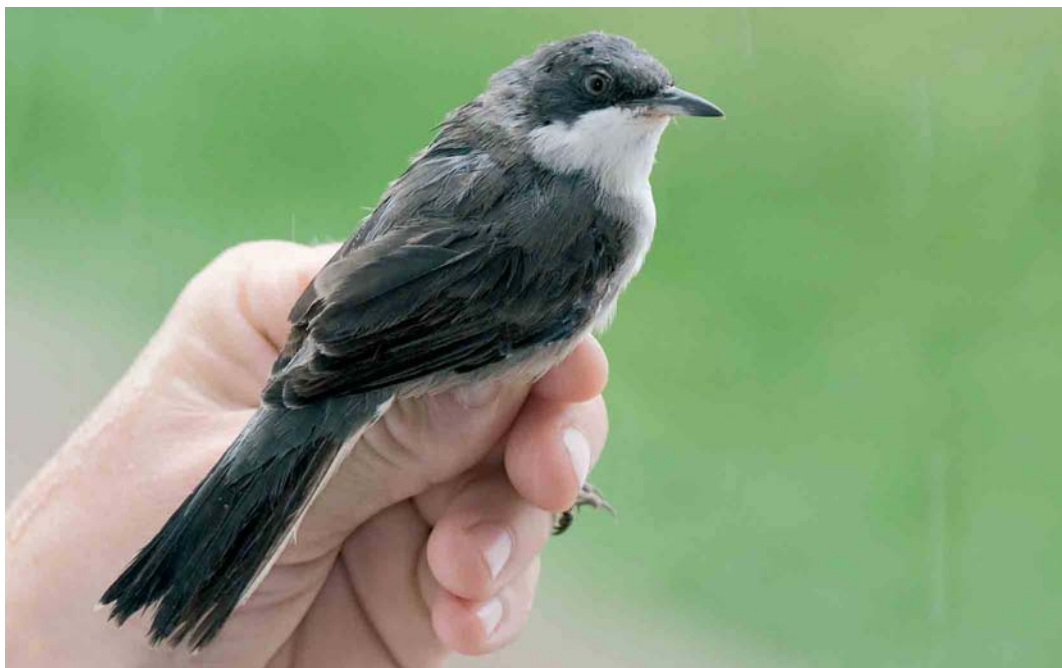
448 Eastern Orphean Warbler / Oostelijke Orpheusgrasmus Sylvia crassirostris , Halten, Sør-Trøndelag, Norway, 3 September 2006

SHRIKES TO BUNTINGS An adult female Daurian Shrike Lanius isabellinus watched briefly at Maasvlakte, Rotterdam, Zuid-Holland, on 27 August was the fifth for the Netherlands. Lesser Grey Shrikes L. minor were present at Borris Hede, Vestjylland, on 5-6 August and at Kvåle, Voss, Hordaland, Norway, on 20 August. A second pair of 'wild' Red-billed Choughs Pyrhonorax pyrrhonorax raised three young in Cornwall this summer. In 2001, the first pair turned up at Lizard after a long absence of the species from Cornwall; it bred every year since, producing a total offspring of 20 in five seasons. The second pair consists of a Cornish born male from the 2004 Lizard brood and a female that arrived naturally. The species' natural recolonization process is threatened by plans to release captive-bred individuals. A Trumpeter Finch Bucanetes githagineus was found in Toscana in central Italy on 16 July. The third Black-faced Bunting Emberiza spodocephala for Helgoland was a male trapped on 29 July. On 24 June, a male Cirl Bunting E. cirius was photographed at Zielbeek, Limburg, Belgium, c 5 km from the Dutch border. On Utsira, a Yellow-breasted Bunting E. aureola was seen on 18 August and a male Black-headed Bunting E. melanocephala on 8 August. A first-year Yellow-breasted Bunting was briefly seen at West