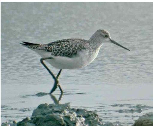
471 Poelruiter / Marsh Sandpiper Tringa stagnatilis , juveniel, Uitkerkse Polders, West-Vlaanderen, 2 augustus 2006

KRAANVOGELS TOT ALKEN Bij Elsenborn, Liège, liep op 2 juli een Kraanvogel Grus grus . Een vorkstaartplevier Glareola vloog op 27 augustus roepend over het Houbenhof in Geistingen. De eerste Morinelplevier Charadrius morinellus voor het najaar trok op 12 augustus over Lommel. Daarna volgden waarnemingen bij Boneffe, Brabant-Wallon (c 13); Burdinne, Brabant-Wallon (zeven); Clermont-Viscourt, Brabant-Wallon (c 31); Diksmuide, West-Vlaanderen; Doornzele; Erps-Kwerps, Vlaams-Brabant (20+); Marche-en-Famenne, Luxembourg (acht); Knokke; Lampernisse, West-Vlaanderen; Meer, Vlaams-Brabant (17); Relegem-Asse, Vlaams-Brabant; Seraing-le-Château, Liège; en Tourinnes-la-Grosse, Brabant-Wallon (12). Op 19 juli verscheen een Temmincks Strandloper Calidris temminckii in Hollogne-sur-Geer, Liège, en in augustus werden er in totaal negen waargenomen. Een Poelsnip Gallinago media liet zich op 19 augustus erg kortstondig bekijken in de Uitkerkse Polders, West-Vlaanderen. Hier pleisterden van 30 juli tot 2 augustus twee juveniele Poelruiters Tringa stagnatilis die het de waar-