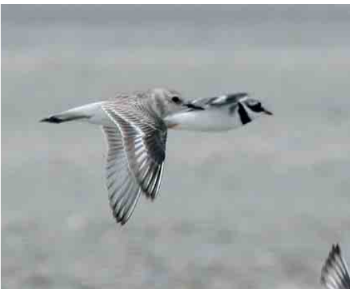
472-473 Woestijnplevier / Greater Sand Plover Charadrius leschenaultii , eerstejaars, met Bontbekplevier / Common Ringed Plover C hiaticula , IJmuiden, Noord-Holland, 4 augustus 2006

Kortbekzeekoet in Belgisch binnenland In de ochtend van 5 augustus 2006 kreeg ik (Tom Goossens), een telefoontje van boswachter Werner Van Hove met de mel-