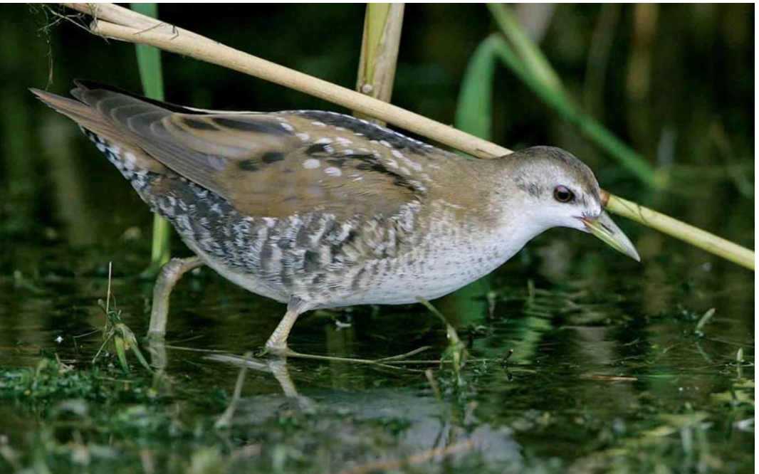
432 Little Crane / Klein Waterhoen Porzana parva , juvenile, Chablais de Cudrefin, Vaud, Switzerland, 20 August 2006 (Gabriël Schuler)