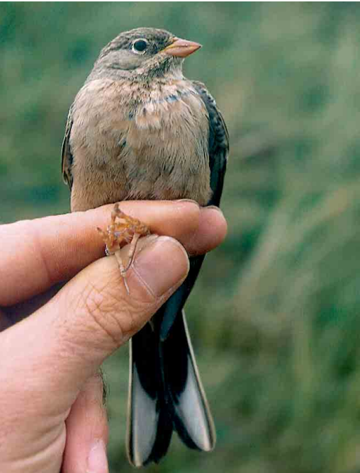
401-402 Steenortolaan / Grey-necked Bunting Emberiza buchanani , eerstejaars mannetje, Castricum, Noord-Holland, 16 oktober 2004