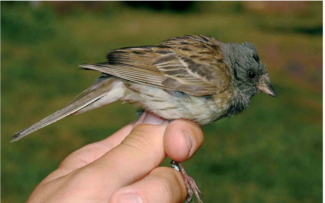
446 Black-faced Bunting / Maskergors Emberiza spodocephala , male, Helgoland, Schleswig-Holstein, Germany, 29 July 2006