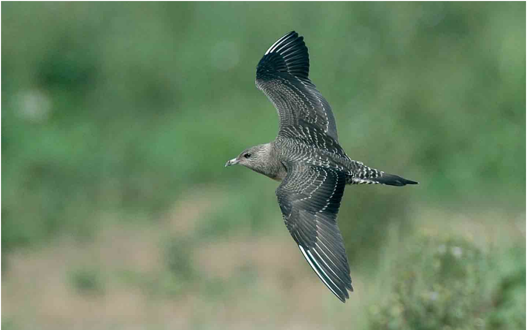
460 Kleinste Jager / Long-tailed Jaeger Stercorarius longicaudus , juveniel, Goudswaard, Zuid-Holland, 5 september 2006 (Norman D van Swelm)