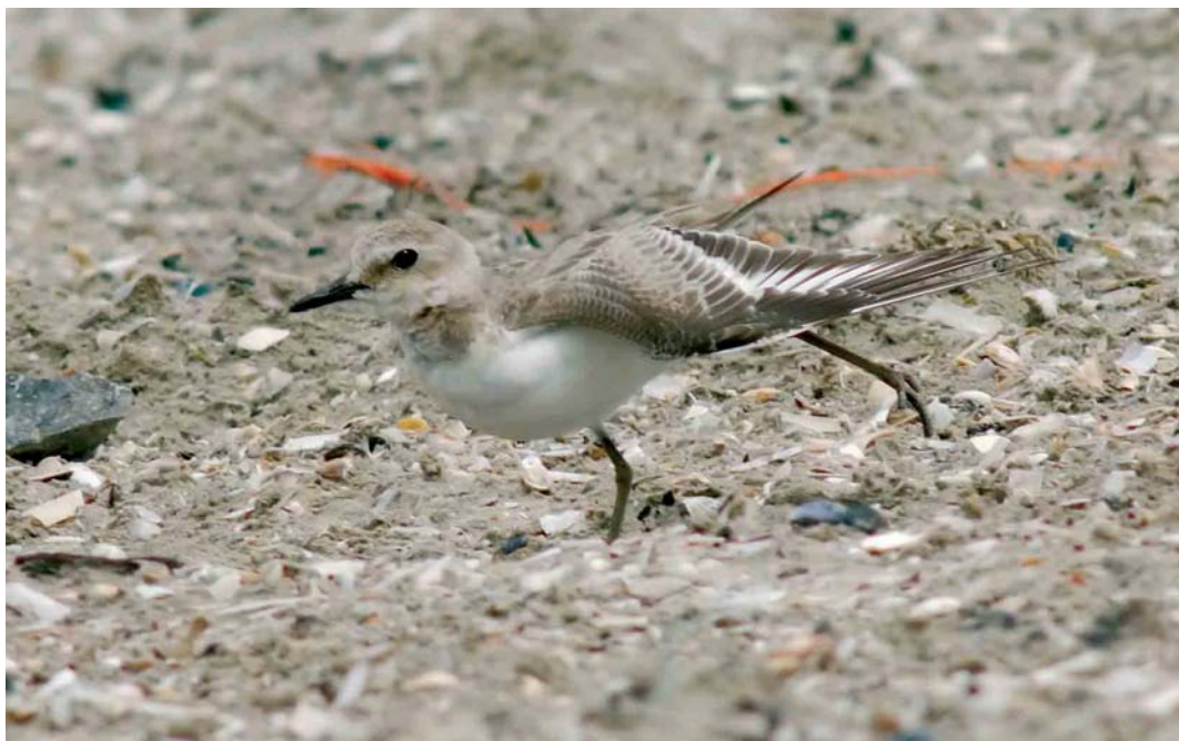
435 Greater Sand Plover / Woestijnplevier Charadrius leschenaultii , first-year, IJmuiden, Noord-Holland, Netherlands, 4 August 2006