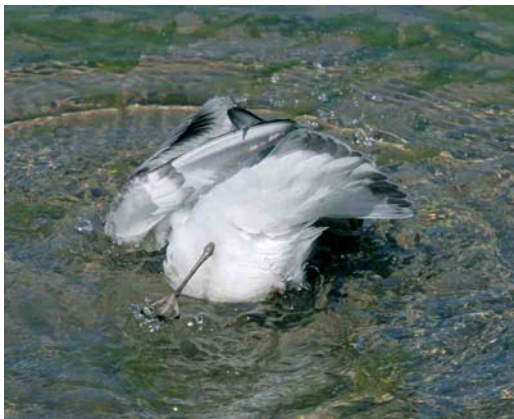
Mystery photograph IX (July)