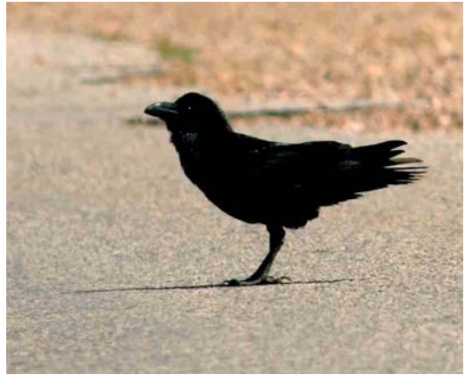
422 African Common Raven / Afrikaanse Raaf Corvus corax tingitanus , Rommani, Morocco, 28 March 2006. This taxon can be identified by its small size (being the smallest Common Raven) and oily plumage colours.