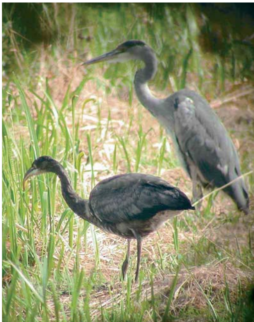
416 Blauwe Reigers / Grey Herons Ardea cinerea , Capelle aan den IJssel, Zuid-Holland, 23 juli 2006 (Willem van Rijswijk)

kant te vissen maar was hierin niet succesvol. Op basis van deze kenmerken is het het meest waarschijnlijk dat het een afwijkende (eerstejaars) Blauwe Reiger was.