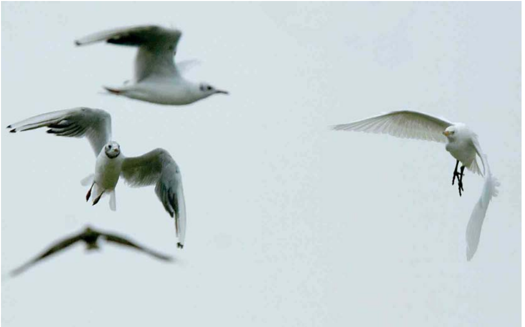
451 Koereiger / Cattle Egret Bubulcus ibis , met Kokmeeuwen / Black-headed Gulls Larus ridibundus , Middelaar, Limburg, 28 juli 2006