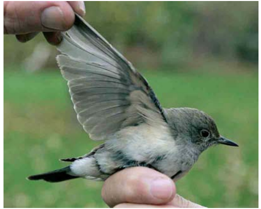
419-420 Perzische Roodborst / White-throated Robin Irania gutturalis , eerste-winter, Roptazijl, Pietersbierum, Friesland, 31 oktober 2005