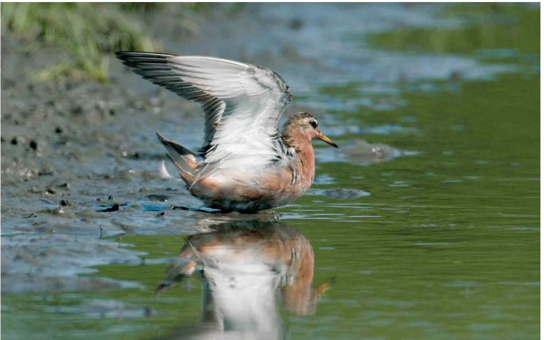
457 Rosse Franjepoot / Red Phalarope Phalaropus fulicarius , Wanteskuup, Zeeland, 1 juli 2006 (Niels de Schipper)