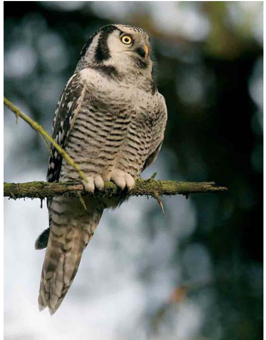
411 Sperweruil / Northern Hawk Owl Surnia ulula ulula , eerstejaars, Westerbork, Drenthe, 31 oktober 2005 (Daan Schoonhoven) 412-413 Sperweruil / Northern Hawk Owl Surnia ulula ulula , eerstejaars, Westerbork, Drenthe, 31 oktober 2005 (Chris van Rijswijk)