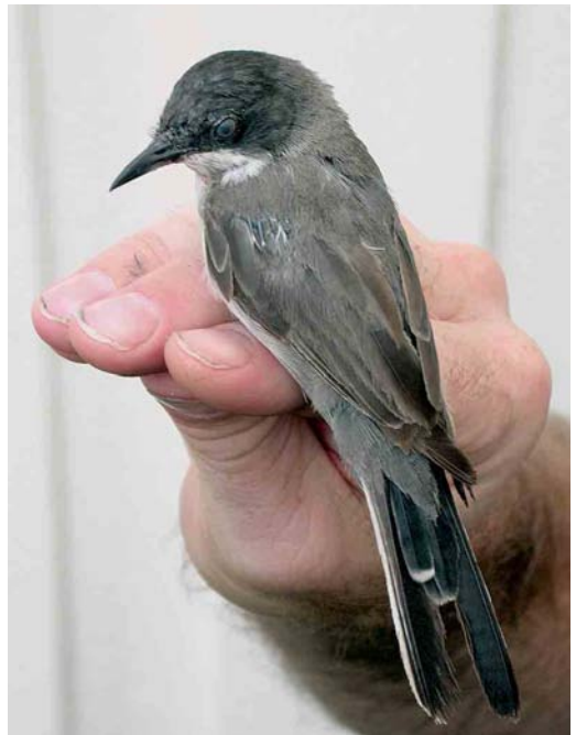
447 Eastern Orphean Warbler / Oostelijke Orpheusgrasmus Sylvia crassirostris , Halten, Sør-Trøndelag, Norway, 12 August 2006 (Magne Myklebust)

THRUSHES TO BABBLERS An Isabelline Wheatear Oenanthe isabellina at Eemshaven, Groningen, from 31 August to 4 September was the fifth for the Netherlands and the earliest ever. A Zitting Cisticola Cisticola juncidis photographed at Saint Margaret's, Cliffe, Kent, on 25 August was the fifth for Britain. A first-winter Olive-tree Warbler Hippolais olivetorum photographed at Boddam, Mainland, Shetland, on 16 August was the first for western Europe (except for claims on Helgoland in May 1860 and May 1954). Paddyfield