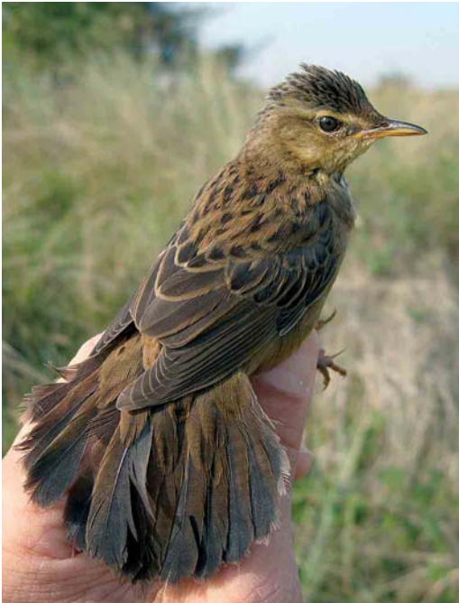
400 Siberische Sprinkhaanzanger / Pallas's Grasshopper Warbler Locustella certhiola , Castricum, Noord-Holland, 20 september 2005

wind (zuidwest 1) en vrijwel onbewolkt. Om 08:15 werd de vijfde Siberische Sprinkhaanzanger uit de geschiedenis van het ringstation gevangen. Ook deze vogel hing in een mistnet van de 'brugsectie'. Hij werd om 08:30 geringd (Arnhem AJ12720). In afwachting van de komst van de telefonisch gewaarschuwde André van Loon kreeg de vogel wat water en werd in een bewaarzak gedaan. Om 10:00 werd hij in één sessie gemeten, beschreven, gevideod en gefotografeerd, en om 11:00 bij de vinkershut losgelaten. Een beschrijving van de vogel staat in appendix 1.