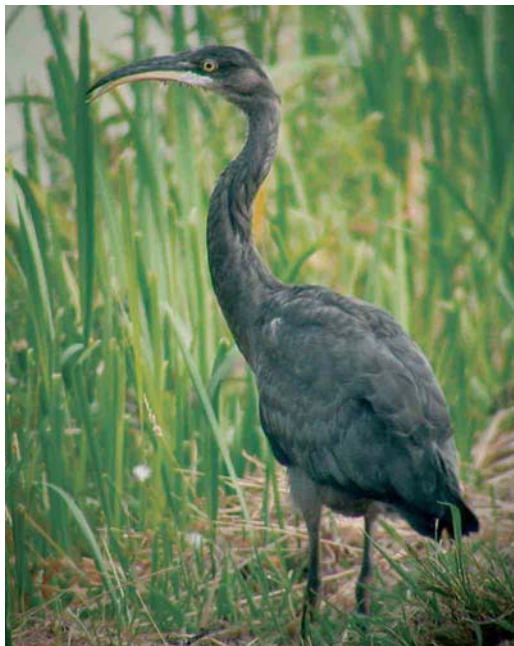
415 Blauwe Reiger / Grey Heron Ardea cinerea , Capelle aan den IJssel, Zuid-Holland, 23 juli 2006 (Willem van Rijswijk)