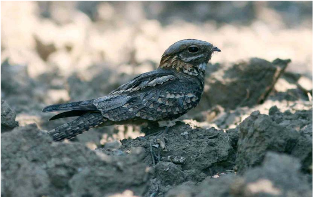
429 Red-necked Nightjar / Moose Nachtzwaluw Caprimulgus ruficollis , Brenes, Sevilla, Andalucía, Spain, 3 June 2006 (Markus Deutsch)

European Nightjar and Red-necked Nightjar are rather similar in appearance. One of the differences, also visible in the mystery photograph, is the size of the white primary spots. In European, only males have obvious spots. In Red-necked, both males and females show these white spots on the three outermost primaries. In both sexes of Red-necked, the white spots are on average larger than in European. The mystery bird shows rather large white spots and this, therefore, favours Red-necked. Another character favouring Red-necked and also visible in the mystery photograph is the rather brownish-grey colour of the uppertail and mantle. In European, these feathers lack the brownish tinge of Red-necked. The rusty-red patterning visible at the upperwing of the mystery bird is another pointer towards Red-necked. In European, the upperwing is patterned less rusty-red. The most important discriminating character, however, is just visible in the mystery photograph. In Red-necked, all wing-coverts show broad pale buff tips, creating pale wing-bars of equal width and about three rows of these buff wing-bars can be seen on the left wing of the mystery bird. European shows only one broad whitish wing-bar, formed by the