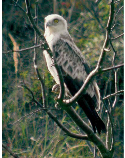
453 Lammergeier / Lammergeier Gypaetus barbatus , onvolwassen, met Zeearend / White-tailed Eagle Haliaeetus albicilla en Bruine Kiekendieven / Western Marsh Harriers Circus aeruginosus , Oostvaardersplassen, Flevoland, 15 mei 2006 ( Frank de Roder ) cf Dutch Birding 28: 247, 257, 2006 454 Slangenarend / Short-toed Eagle Circaetus gallicus , Meijndel, Zuid-Holland, 19 augustus 2006 ( Wouter Puyk ) 455 Zwarte Ooievaar / Black Stork Ciconia nigra , Wieringermeer, Noord-Holland, 2 september 2006 ( Harm Niesen )