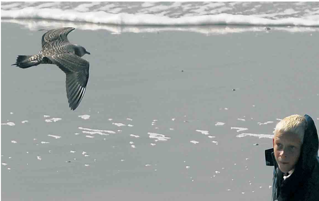
458 Kleinste Jager / Long-tailed Jaeger Stercorarius longicaudus , juveniel, Hondsbossche Zeewering, Noord-Holland, 30 augustus 2006