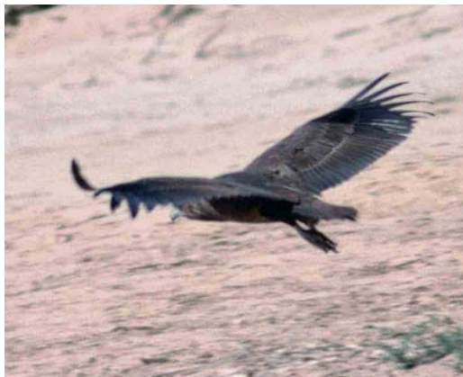
Mystery photograph X (March)