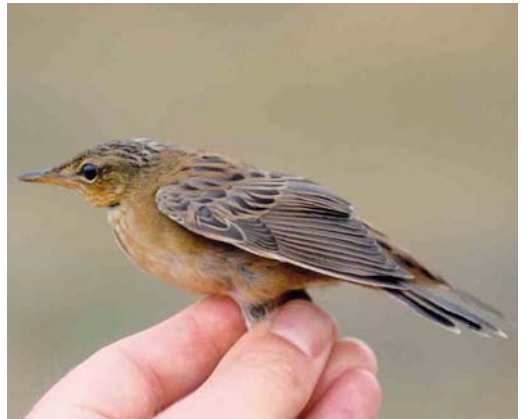
395-396 Siberische Sprinkhaanzanger / Pallas's Grasshopper Warbler Locustella certhiola , eerstejaars, Castricum, Noord-Holland, 27 september 2002 397-398 Siberische Sprinkhaanzanger / Pallas's Grasshopper Warbler Locustella certhiola , Castricum, Noord-Holland, 12 september 2003

geringd (Arnhem AE77710). Ook nu werden andere ringers telefonisch gewaarschuwd maar de belangstelling om te komen was, na de vogel van zes dagen eerder, matig. Alleen René Dekker was genegen de vogel op de gevoelige plaat vast te leggen. Hij werd nabij de ringershut losgelaten en vloog hoog naar het zuiden weg; tijdens een latere mistnetronde werd hij 100 m zuidelijker nog even in een struweel van Witte Abelen Populus alba gezien. Een beschrijving van de vogel staat in appendix 1.