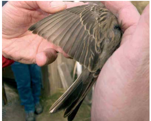
405 Steenortolaan / Grey-necked Bunting Emberiza buchanani , eerstejaars mannetje, Castricum, Noord-Holland, 16 oktober 2004 ( André J van Loon ) 406 Steenortolaan / Grey-necked Bunting Emberiza buchanani , eerstejaars mannetje, Castricum, Noord-Holland, 16 oktober 2004 ( Arnold Wijker ) 407-408 Steenortolaan / Grey-necked Bunting Emberiza buchanani , eerstejaars mannetje, Castricum, Noord-Holland, 16 oktober 2004 ( Henk Levering )

keelortolaan, het lichtst bij Steenortolaan) en een witte keel, buik en anaalstreek, en lijken daarmee op juveniele; dit is vooral bij vrouwtjes het geval. Veel vogels (vooral mannetjes) tonen echter de kleuren van het adulte kleed op de onderzijde, al zijn die kleuren vaak nog geheel of ten dele bedekt onder bredere of smalle witte veerranden. Bij Ortolaan zijn de mondstreep en keel vaak al grotendeels bleekgeel en is wat grijs zichtbaar op de bovenborst en rossig oranje op de benedenborst en buik; bij Bruinkeelortolaan en Steenortolaan kunnen mondstreep, keel, borst en buik al iets tot veel rossig oranje tonen, een tint die zich bij Bruinkeelortolaan (maar niet Steenortolaan) uitbreidt tot de onderstaartdekveren. De Castricum-vogel, met (deels verborgen) rossig oranje tinten op keel, borst en buik, kan op grond van dit kenmerk geen Ortolaan zijn, terwijl de rozewitte onderstaart Bruinkeelortolaan uitsluit.