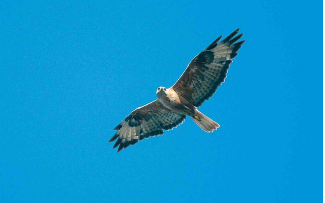
431 Long-legged Buzzard / Arendbuizerd Buteo rufinus , Helgoland, Schleswig-Holstein, Germany, 16 July 2006