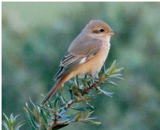
478 Daurische Klauwier / Daurian Shrike Lanius isabellinus , adult vrouwtje, Maasvlakte, Zuid-Holland, 27 augustus 2006

Dutch Birding-vogellijn in en belde veel mensen met de melding van een 'waarschijnlijke Turkse Klauwier, adult vrouwtje, aan de determinatie wordt gewerkt'.