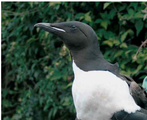
474 Kortbekzeekoet / Brunnich's Murre Uria lomvia , adult, Lille, Antwerpen, 5 augustus 2006 (Tom Goossens)