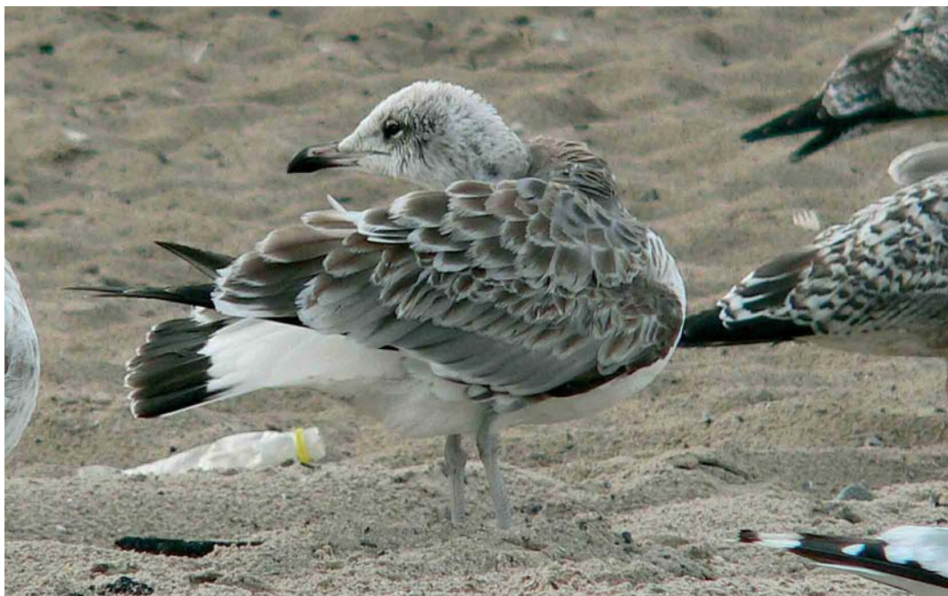
436 Pallas's Gull / Reuzenzwartkopmeeuw Larus ichthyaetus , first-year, Miedzyzdroje, Poland, 19 August 2006