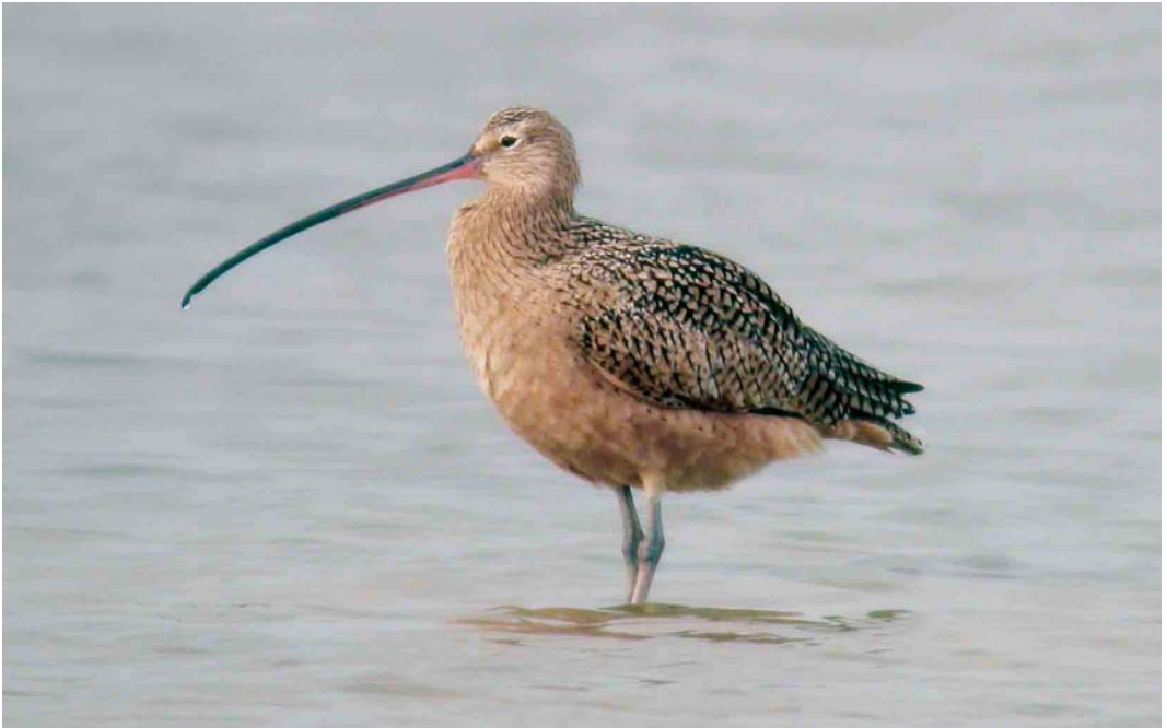
417 Long-billed Curlew / Amerikaanse Wulp Numenius americanus , Riohacha, Colombia, 16 March 2006

Long-billed Curlew is a breeding species in prairie habitats in North America. Two subspecies are recognized: the northerly breeding N a parvus and the more southerly N a americanus . Differences are very slight and probably clinal and only, as the name parvus (small) suggests, refer to size (Hayman et al 1986,