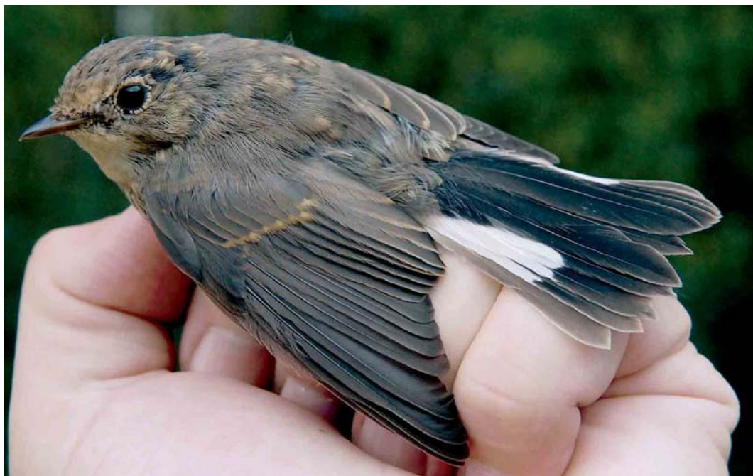
470 Kleine Vliegenvanger / Red-breasted Flycatcher Ficedula parva , eerstejaars, Groene Glop, Schiermonnikoog, Friesland, 26 augustus 2006

Camperduin, op 4 augustus over het Ballooërveld, Drenthe, en op 5 augustus bij Bennekom, Gelderland. Na 17 augustus volgden nog eens 26 exemplaren. De