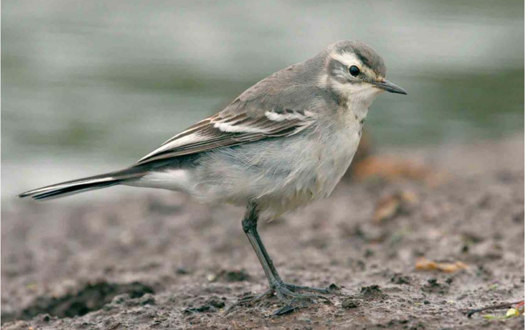
445 Citrine Wagtail / Citroenkwikstaart Motacilla citreola , first-year, Ouessant, Finistère, France, 2 September 2006 (Aurélien Audevard)