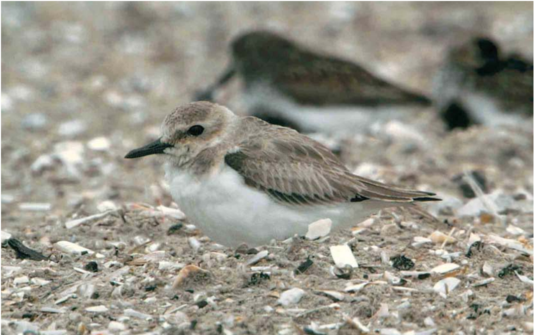
450 Woestijnplevier / Greater Sand Plover Charadrius leschenaultii , eerstejaars, IJmuiden, Noord-Holland, 4 augustus 2006 (Jan den Hertog)

26 augustus op Koarnwerterstân (Kornwerderzand), Friesland. Een (of de) Roze Pelikaan Pelecanus onocrotalus verbleef op 20 en 21 juli bij Akersloot, Noord-Holland, van 23 juli tot 8 augustus op Texel en van 8 tot 12 augustus bij Den Helder, Noord-Holland. Tot 10 juli was er sprake van twee territoria van Woudaap Ixobrychus minutus bij Tienhoven, Utrecht. Van 30 juni tot 18 juli was een mannetje aanwezig bij Kinderdijk, Zuid-Holland, met op 4 juli hier ook een vrouwtje. Op 17 juli werd er één gezien bij de Maarsseveense Plassen, Utrecht. Door het hele land werden in totaal 19 Kwakken Nycticorax nycticorax opgemerkt, voornamelijk juveniele. Koereigers Bubulcus ibis waren present op 6 juli in de Ooijpolder, Gelderland, op 14 juli bij Kloosterzande, Zeeland, op 24 juli bij Schipluiden, Zuid-Holland, en Wijhe, Overijssel, op 28 juli bij Middelaar, Limburg, en van 23 tot 26 augustus in de Oostvaardersplassen, Flevoland. Zwarte Ooievaars Ciconia nigra worden van jaar op jaar algemener met in deze periode ruim 110, met een piek in midden augustus. De grootste aantallen waren op 9 augustus zes bij Keent, Noord-Brabant, op 13 augustus zeven in de Kop van Noord-Holland, op 18 augustus 12 over de Strabrechtse Heide, Noord-Brabant, op 19 augustus negen op Texel en op 23 augustus zes over Koningsbosch, Limburg. De reeds lang aanwezige Zwarte Ibis Plegadis falcinellus van Noord-Holland was de gehele periode te bewonderen in de omgeving van het Balgzand. Daarnaast waren er