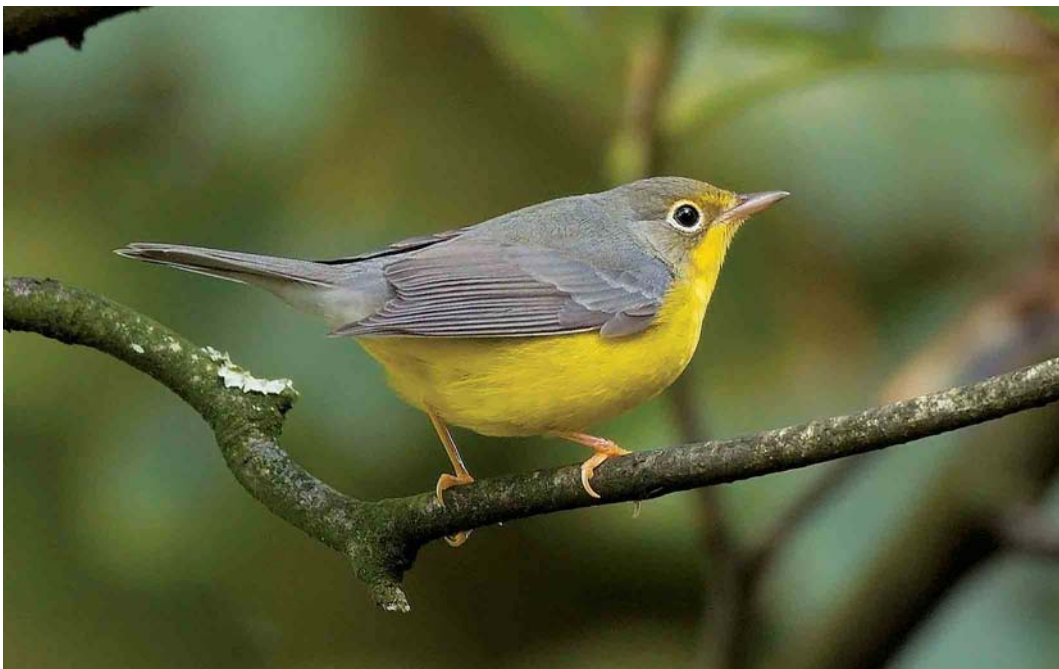
553 Canada Warbler / Canadese Zanger Wilsonia canadensis , Kilbaha, Clare, Ireland, October 2006