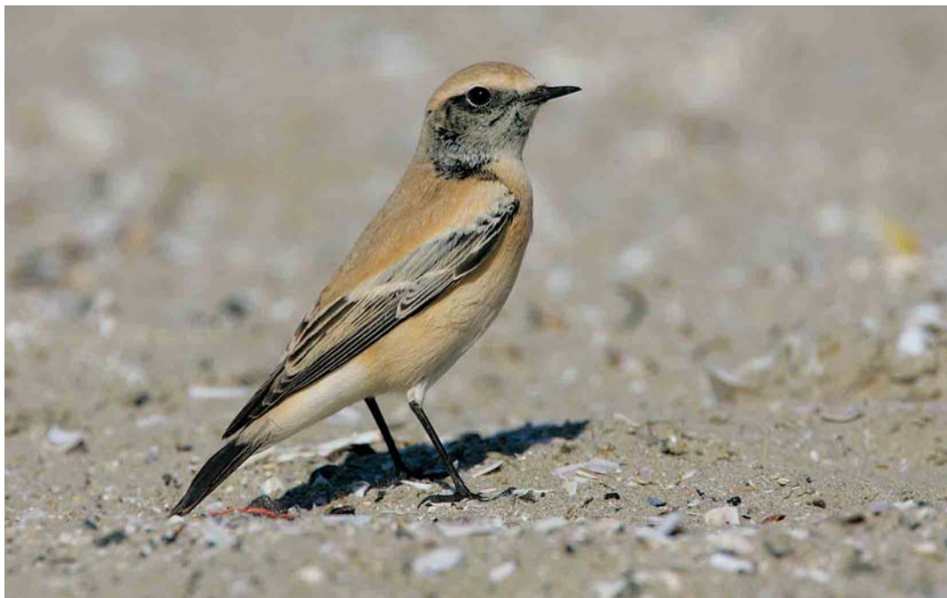
498 Desert Wheatear / Woestijntapuit Oenanthe deserti , first-year male, IJmuiden, Noord-Holland, 24 September 2005 (René van Rossum)