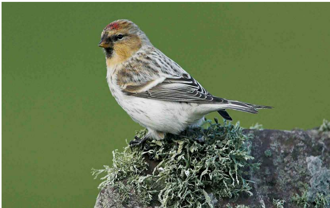
547 Hornemann's Redpoll / Groenlandse Witstuitbarmsijs Carduelis hornemanni hornemanni , Sumburgh Head, Mainland, Shetland, Scotland, 22 October 2006