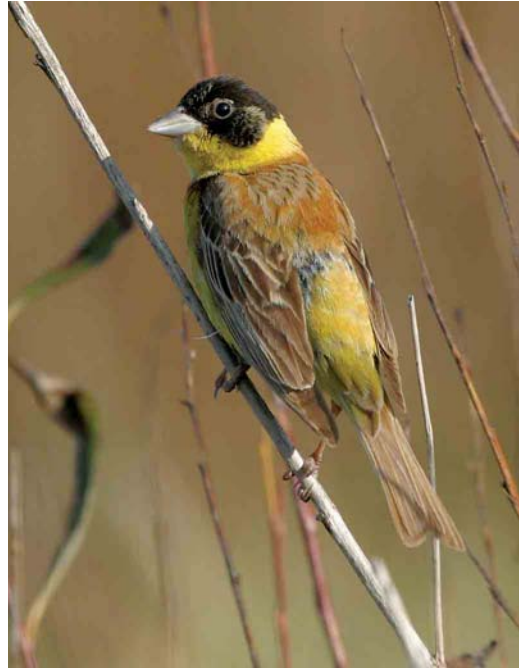
563 Roodkopklauwier / Woodchat Shrike Lanius senator , eerstejaars, De Cocksdorp, Texel, Noord-Holland, 2 september 2006 564 Zwartkopgors / Black-headed Bunting Emberiza melanocephala , mannetje, Brouwersdam, Zeeland, 17 oktober 2006 565 Daurische Klauwier / Daurian Shrike Lanius isabellinus , adult mannetje, Den Hoorn, Texel, Noord-Holland, 26 september 2006