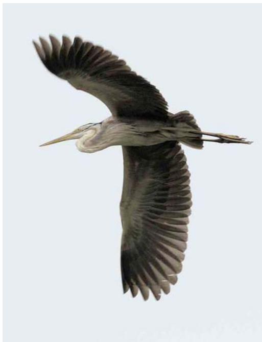
519 American Great Egret / Amerikaanse Grote Zilverreiger Casmerodius albus egretta , Povoação, São Miguel, Azores, 30 September 2006 520 Bourne's Heron / Kaapverdise Purperreiger Ardea bournei , Liberão, Santiago, Cape Verde Islands, 15 October 2006 521 Boreal Eider / Noordelijke Eider Somateria mollissima borealis , immature male, Fair Isle, Shetland, Scotland, 8 October 2006