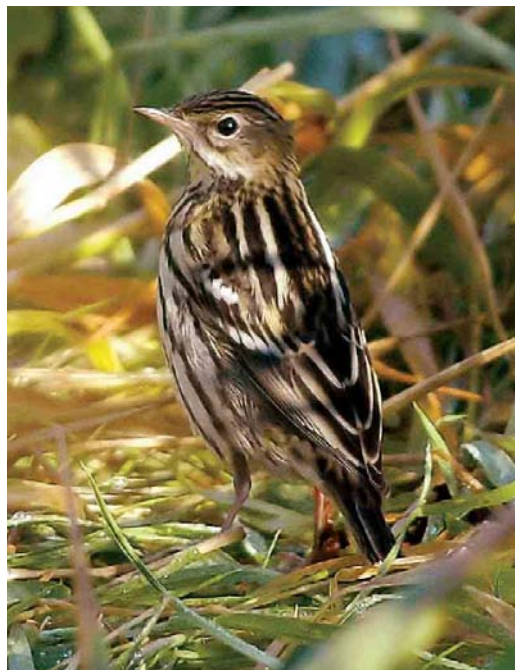
544 Black-headed Bunting / Zwartkopgors Emberiza melanocephala , Toab, Shetland, Scotland, 16 September 2006 545 Pechora Pipit / Petsjorapieper Anthus gustavi , Fair Isle, Shetland, Scotland, 23 September 2006 546 Grey-necked Bunting / Steenortolaan Emberiza buchanani , Pori, Finland, 31 October 2006