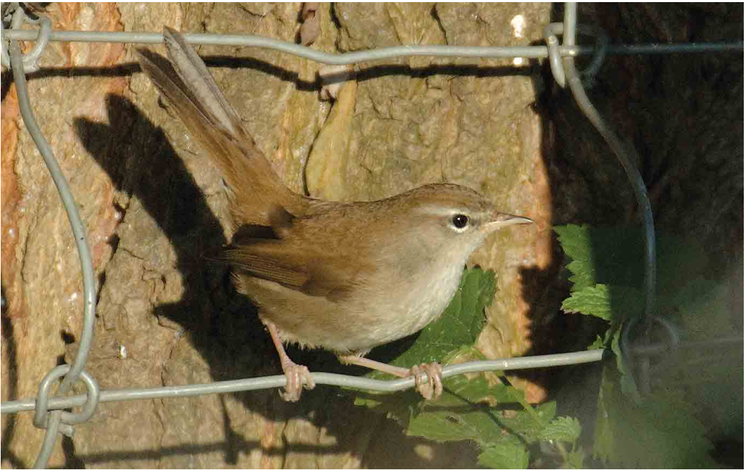
579 Cetti's Zanger / Cetti's Warbler Cettia cetti , Dordtse Biesbosch, Zuid-Holland, 10 oktober 2006