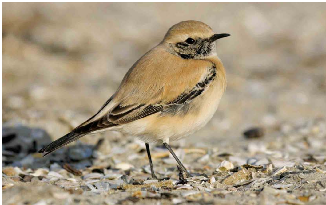
499 Desert Wheatear / Woestijntapuit Oenanthe deserti , first-year male, IJmuiden, Noord-Holland, 22 November 2005