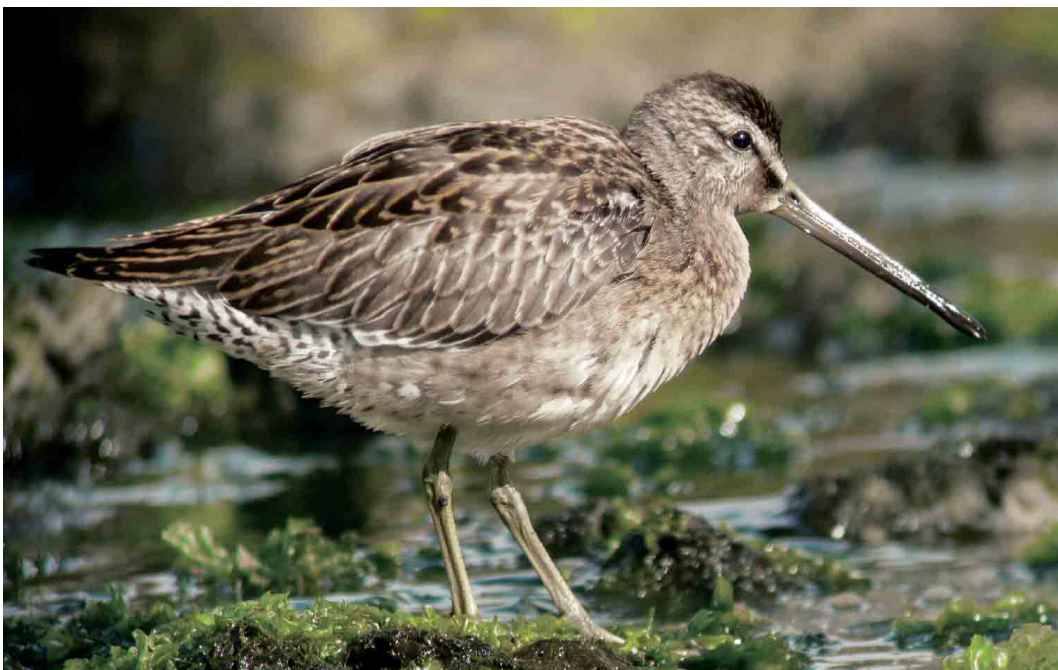
523 Short-billed Dowitcher / Kleine Grijze Snip Limnodromus griseus , juvenile, Lajes do Pico, Pico, Azores, 22 September 2006