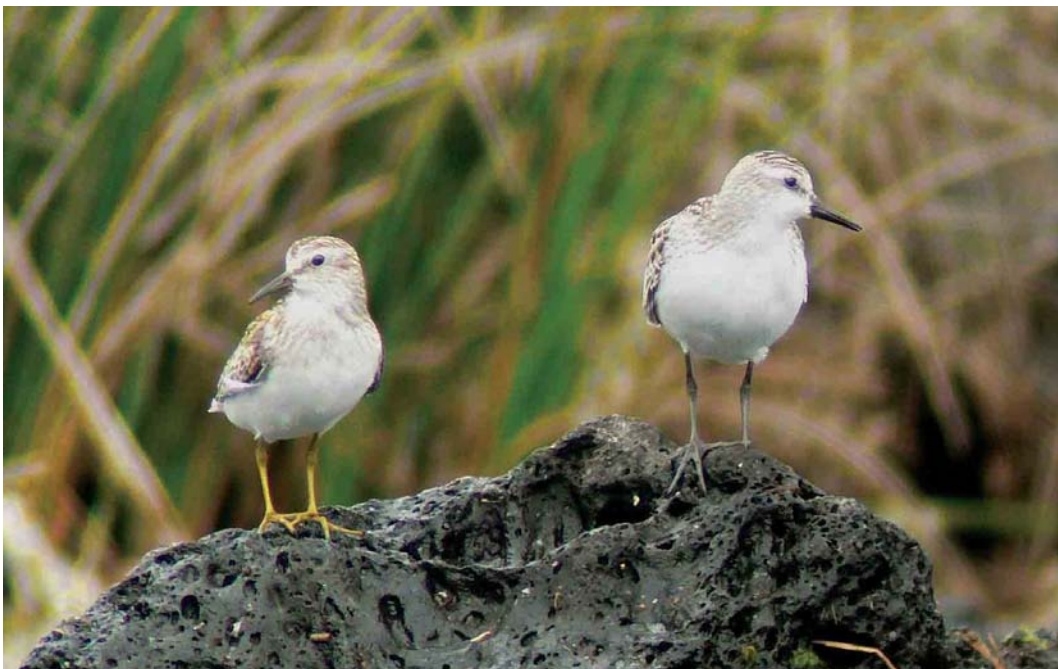
522 Least Sandpiper / Kleinste Strandloper Calidris minutilla (left) and Semipalmated Sandpiper / Grijze Strandloper C pusilla , Lajes do Pico, Pico, Azores, 19 September 2006 (Sébastien Sibley)