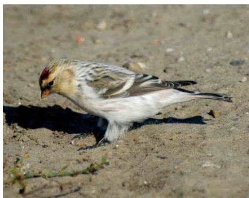
503 Lesser Grey Shrike / Kleine Klapekster Lanius minor , adult female, Groote Vlak, Texel, Noord-Holland, 5 October 504 Desert Wheatear / Woestijntapuit Oenanthe deserti , first-year male, Westerstrand, Schiermonnikoog, Friesland, 29 October 2005 505-506 Desert Wheatear / Woestijntapuit Oenanthe deserti , first-year male, IJmuiden, Noord-Holland, 13 November 2005 507 Arctic Redpoll / Witstuitbarmsijs Carduelis hornemanni exilipes , first-winter, Oosterscheldekering, Westenschouwen, Zeeland, 19 November 2005 508 Hornemann's Redpoll / Groenlandse Witstuitbarmsijs Carduelis hornemanni hornemanni , adult male, Huisduinen, Noord-Holland, 15 October 2003