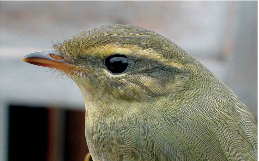
580 Raddes Boszanger / Radde's Warbler Phylloscopus schwarzi , Castricum, Noord-Holland, 19 oktober 2006 (Cock Reijnders)