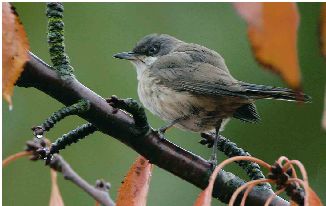
500 Western Orphea Warbler / Westelijke Orpheusgrasmus Sylvia hortensis , Middelburg, Zeeland, 31 October 2003 ( Bas van den Boogaard ) 501 Desert Wheatear / Woestijntapuit Oenanthe deserti , first-summer male, Fochteloërveen, Drenthe, 6 April 2005 ( Roland Jansen ) 502 Two-barred Crossbill / Witbandkruisbek Loxia leucoptera bifasciata , male, Wateren, Drenthe, 9 February 2005 ( Roland Jansen )