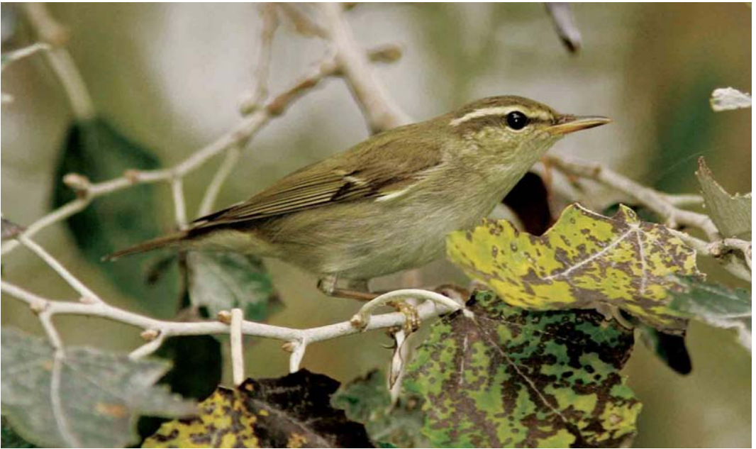
584 Noordse Boszanger / Arctic Warbler Phylloscopus borealis , Heist, West-Vlaanderen, 25 september 2006 (Koen Verbanck)