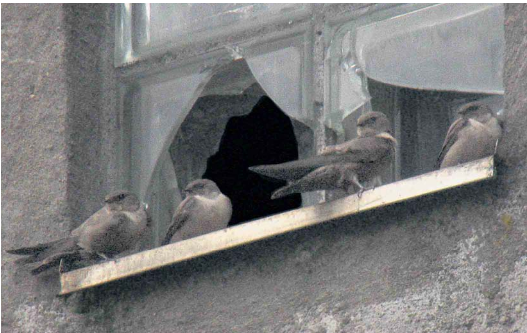
538 Eurasian Crag Martins / Rotszwaluwen Ptyonoprogne rupestris , Vaggeryd, Småland, Sweden, 20 October 2006 (Kent & Oscar Jönsson)