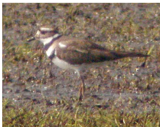
488 Buff-breasted Sandpiper / Blonde Ruiters Tryngites subruficollis , juvenile, Harpel, Groningen, 2 October 1982 (Nico de Vries) 489 Red-necked Stint / Roodkeelstrandloper Calidris ruficollis , adult, Wagejot, Texel, Noord-Holland, 24 July 2005 (René Pop) 490 Terek Sandpiper / Terekruiter Xenus cinereus , Wagejot, Texel, Noord-Holland, 15 May 2005 (René Pop) 491 Terek Sandpiper / Terekruiter Xenus cinereus , De Braakman, Zeeland, 7 June 2005 (Mark S J Hoekstein) 492 Killdeer / Killdeerplevier Charadrius vociferus , second calendar-year, Rottige Meente, Overijssel, 4 April 2005 (Roland Jansen) 493 Killdeer / Killdeerplevier Charadrius vociferus , second calendar-year, Rottige Meente, Overijssel, 4 April 2005 (Leo J R Boon/Cursorius)