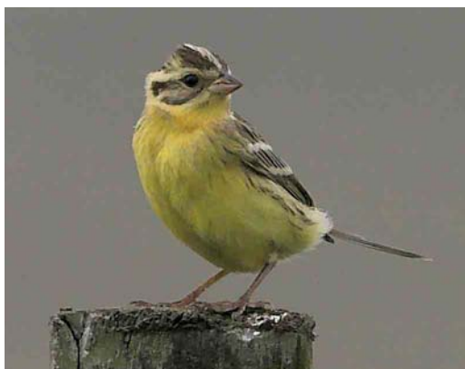
549 Baltimore Oriole Icterus galbula , Cape Clear Island, Cork, Ireland, 17 October 2006 (Paul & Andrea Kelly/irishbirdimages.com) 550 Blackpoll Warbler / Zwartkopzanger Dendroica striata , first-year, Mandø, Denmark, 16 October 2006 (Martin Søgaard Nielsen) 551 Hermit Thrush / Heremietlijster Catharus guttatus , Cape Clear Island, Cork, Ireland, 19 October 2006 (Paul & Andrea Kelly/irishbirdimages.com) 552 Yellow-breasted Bunting / Wilgengors Emberiza aureola , Whalsay, Shetland, Scotland, 11 September 2006 (Hugh Harrop)

Clare, on 7-14 October. Three single European Goldfinches Carduelis carduelis at three sites during 12-16 October were the second to fourth for Iceland (the first was on 17 October 2005); a fifth was found on 1 November. A Greenland Redpoll C flammea rostrata on Corvo on 21 October was the second redpoll for the Azores and Macaronesia. In Norway, one was found at Mønstremyr, Vest-Agder, on 2 November. Two Hornemann's Redpolls C hornemanni hornemanni were reported from Røst, Nordland, Norway, on 2 October. Four singles occurred in Shetland on Foula on 4-13 October, at Sumburgh on 19-24 October and on Fair Isle on 25 and 30 October. Recent sound-recordings of British Crossbill Loxia curvirostra type E in Estonia were the first outside Britain and the Netherlands; perhaps less surprising were the first sound-recordings of Scarce Crossbills L c type F outside the Benelux in Estonia and Russia (cf The Sound Approach to birding 2006). In coastal south-western Norway, an influx of