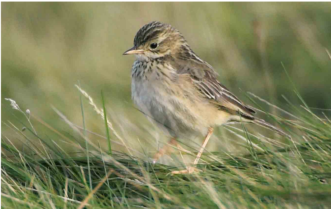
539 Blyth's Pipit / Mongoolse Pieper Anthus godlewskii , Sumburgh Head, Mainland, Shetland, Scotland, 12 October 2006