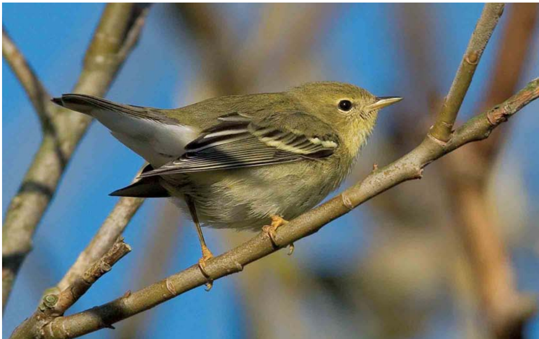
554 Blackpoll Warbler / Zwartkopzanger Dendroica striata , first-year, Reve, Klepp, Rogaland, Norway, 2 November 2006 (Christian Tiller)