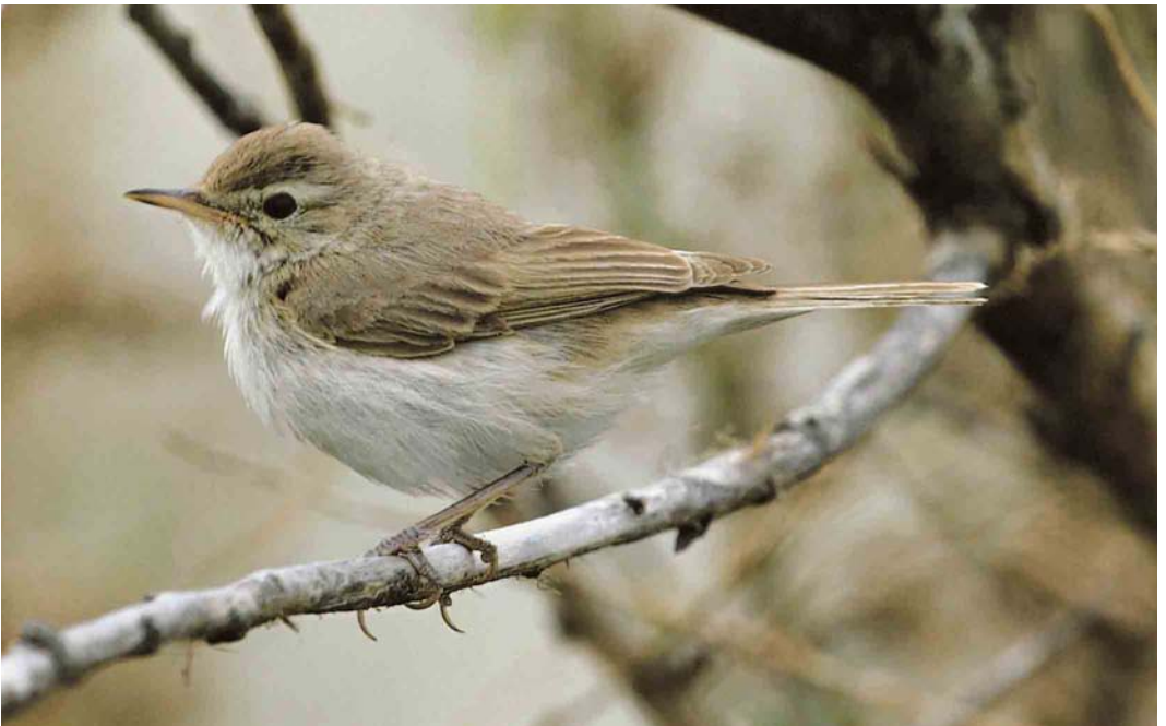
578 Kleine Spotvogel / Booted Warbler Acrocephalus caligatus , Maasvlakte, Zuid-Holland, 9 oktober 2006