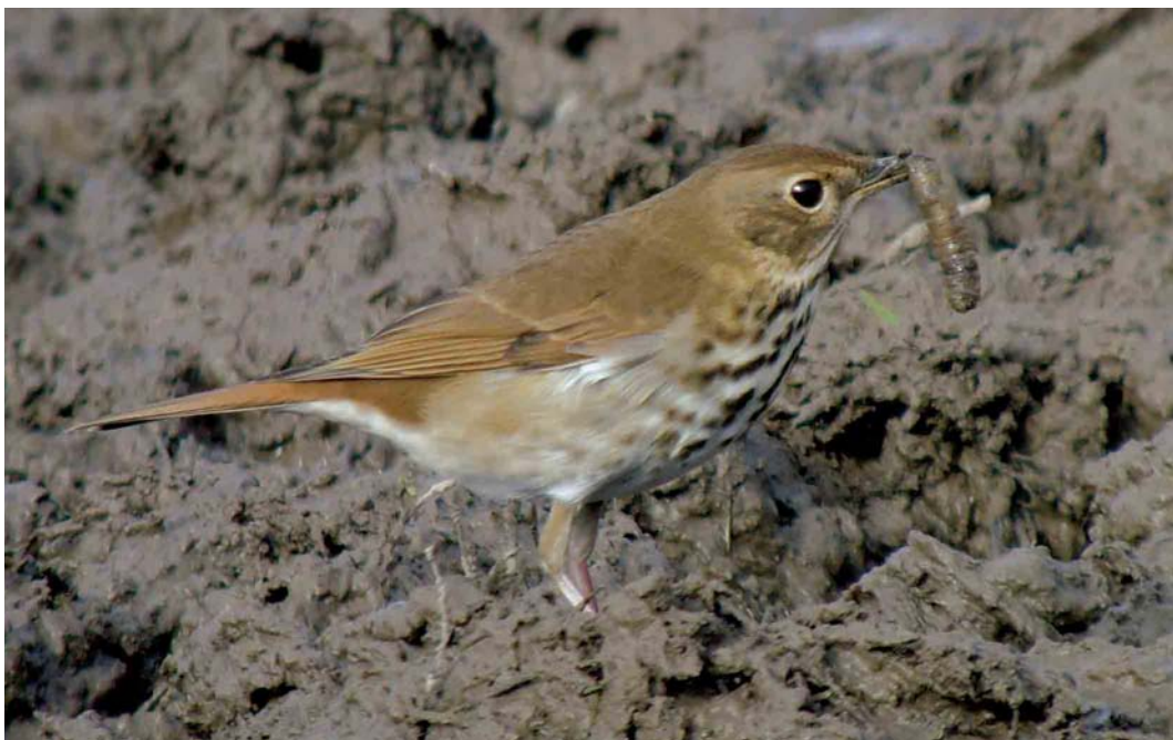
541 Hermit Thrush / Heremietlijster Catharus guttatus , Cape Clear Island, Cork, Ireland, 20 October 2006