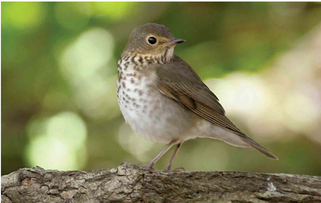
540 Swainson's Thrush / Dwerglijster Catharus ustulatus , Ouessant, Finistère, France, 3 October 2006 (Vincent Legrand)