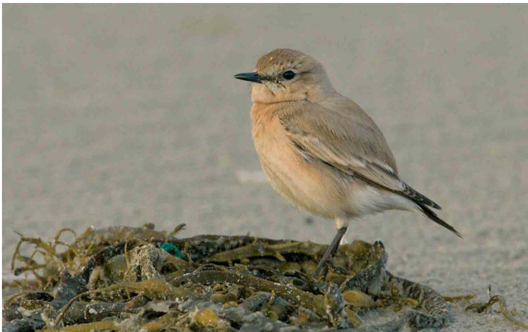
81 Izabeltapuit / Isabelline Wheatear Oenanthe isabellina , Terschelling, Friesland, 18 november 2005