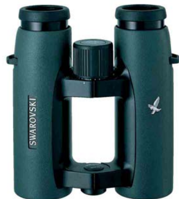
Swarovski 10x32 EL binoculars

Photographs I and II represent the first round of the 2006 competition. Please, study the rules