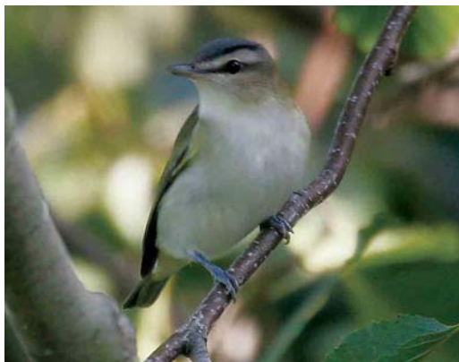
509 Greenish Warbler / Grauwe Fitis Phylloscopus trochiloides , Bodegraven, Zuid-Holland, 10 June 2005 510 Iberian Chiffchaff / Iberische Tjiftjaf Phylloscopus ibericus , Bergen, Noord-Holland, 25 May 2005 511 Siberian Chiffchaff / Siberische Tjiftjaf Phylloscopus collybita tristis , Westkapelle, Zeeland, 11 October 2005 512 Red-eyed Vireo / Roodoogvireo Vireo olivaceus , Westkapelle, Zeeland, 9 October 2005

Zuid-Holland, on 31 May 2003 (van Rijswijk 2004); it was part of an unprecedented influx to north-western and northern Europe (cf Olthoff 2006).