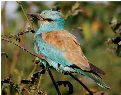
484 Squacco Heron / Ralreiger Ardeola ralloides , adult, Alblisserdam, Zuid-Holland, 2 July 2005 ( Chris van Rijswijk ) 485 Great Snipe / Poelsnip Gallinago media , Hessenpoort, Zwolle, Overijssel, 13 September 2005 ( Lennaert Steen ) 486 Eurasian Pygmy Owl / Dwerguil Glaucidium passerinum , Sumarreheide, Friesland, 4 October 2002 ( Jan Deinum ) 487 European Roller / Scharrelaar Coracias garrulus , adult, Texel, Noord-Holland, 16 September 2005 ( Leo J R Boon/Cursorius )