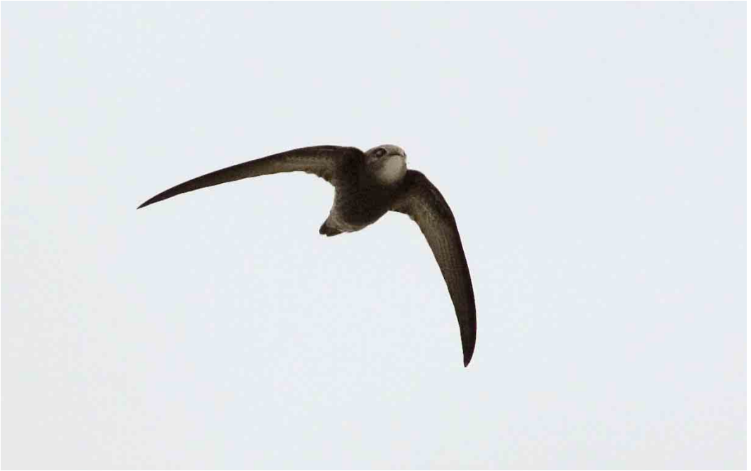
574 Vale Gierzwaluw / Pallid Swift Apus pallidus , Vlieland, Friesland, 20 oktober 2006 575 Steppevorkstaartplevier / Black-winged Pratincole Pratincola nordmanni , Eemnes, Utrecht, 17 oktober 2006 576 Roodpootvalk / Red-footed Falcon Falco vespertinus , juveniel, Westkapelle, Zeeland, 30 september 2006