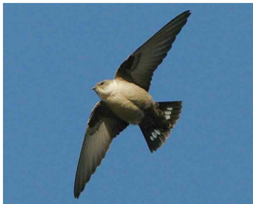
589 Rotszwaluw / Eurasian Crag Martin Ptyonoprogne rupestris , Hoorn, Noord-Holland, 18 november 2006 (René van Rossum)

op een spuyer hoog op een flatgebouw aan De Weel. Enkele fotografen konden vanuit het appartement op de bovenste verdieping prachtige foto's maken. Rond 11:00 verplaatsten de twee zwaluwen zich naar het oude centrum waar ze rond de Grote Kerk vlogen. Rond 11:45 werden ze op hun oude plek bij De Titaan gezien – en zo ging het de rest van de dag (tot c 16:30) door, waarbij enkele 100-en vogelaars de soort eindelijk op hun Nederlandse lijst konden bijschrijven. Ook de volgende dagen werden de vogels nog gezien, ten minste tot en met 24 november.