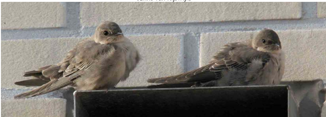
590 Rotszwaluwen / Eurasian Crag Martins Ptyonoprogne rupestris , Hoorn, Noord-Holland, 18 november 2006

EURASIAN CRAG MARTINS On 5 November 2006, two Eurasian Crag Martins Ptyonoprogne rupestris were seen briefly by one birder and his friend at IJburg, Amsterdam, Noord-Holland, the Netherlands. On 7 November, two were seen and heard calling by four observers at Westenschouwen, Zeeland. From 14 to at least 24 November, one to two were seen (almost) daily but, in the first days, briefly at Hoorn, Noord-Holland (c 30 km north of IJburg). On 17 November, the first photographs of the two birds at Hoorn were made and, on 18 November, the two were seen for long periods, both at rest and in flight, during the