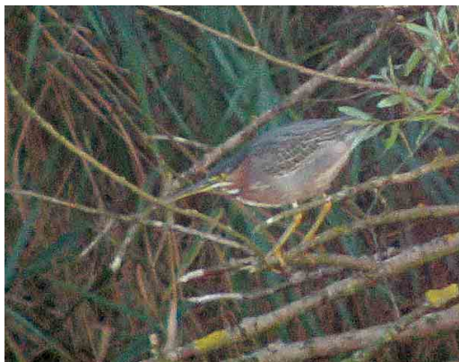
566 Grote Tafelend / Canvasback Aythya valisineria , adult mannetje, Hoefijzermeer, Castricum, Noord-Holland, 30 september 2006 ( Martijn Verdoes ) 567 Klein Waterhoen / Little Crake Porzana parva , Verdrongen Land van Saeftinghe, Zeeland, 8 september 2006 ( Alex Wieland ) 568 Groene Reiger / Green Heron Butorides virescens , tweede-kalenderjaar, Zijkanaal H-Weg, Amsterdam, Noord-Holland, 19 september 2006 ( Effendi Haidar ) 569 Groene Reiger / Green Heron Butorides virescens , tweede-kalenderjaar, Zijkanaal H-Weg, Amsterdam, Noord-Holland, 30 september 2006 ( Enno B Ebels )

6 september over Veenendaal, Utrecht, op 1 oktober bij Camperduin, op 5 oktober twee (overvliegend) bij Lexmond, Zuid-Holland, op 8 oktober over Texel, en op 9 oktober langs Katwijk aan Zee, Zuid-Holland. Uiteraard was ook de vogel van het Balgzand en omstreken, Noord-Holland, de gehele periode aanwezig. Er werd een achttal Zwarte Wouwen Milvus migrans gemeld waaronder één van 4 tot 6 september in het Markiezaat, Noord-Brabant, soms in gezelschap van twee Rode Wouwen M. milvus . Tot half oktober trokken c 10 Zeearenden Haliaeetus albicilla het land in. Het broedpaar met hun jonge vogel bleef aanwezig in de Oostvaardersplassen en vanaf 16 oktober was er één aanwezig in de wijde omgeving van de Korendijkse Slikken, Zuid-Holland. De Slangenarend Circaetus gallicus van Meijendel, Zuid-Holland, bleef tot 9 september. Een mogelijke Steppebuizerd Buteo buteo vulpinus werd op 27 oktober gefotografeerd bij Lettele,