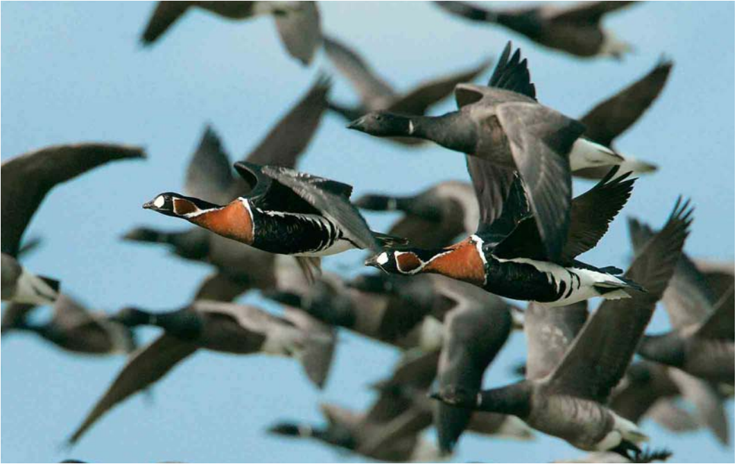
555 Roodhalsganzen / Red-breasted Geese Branta ruficollis , met Rotganzen / Dark-bellied Brent Geese B. bernicla , Terschelling, Friesland, 8 oktober 2006

Grauwe Pijlstormvogels Puffinus griseus waren schaars met als uitschieters bijvoorbeeld 36 op 7 oktober langs Texel, Noord-Holland, en 29 op 24 oktober langs Westkapelle. Tussen 26 september en 29 oktober werden slechts 30 Noordse Pijlstormvogels P. puffinus doorgegeven. Vale Pijlstormvogels P. mauretanicus werden vaker gemeld dan normaal met waarnemingen op 4 september langs Westkapelle, op 16 september langs Camperduin, Noord-Holland, op 26 september langs Scheveningen, Zuid-Holland, op 4 oktober langs Terschelling, Friesland, en op 7 oktober langs Texel, de Maasvlakte, Zuid-Holland, en Vlieland. Stormvogeltjes Hydrobates pelagicus werden opgemerkt op 4 oktober langs Terschelling en op 31 oktober langs Westkapelle. Slechts enkele Vale Stormvogeltjes Oceanodroma leucorhoa werden gemeld, met een uitzonderlijke waarneming op 18 oktober over de Looszerheide, Noord-Brabant. Dit exemplaar werd in vlucht gefotografeerd en pas achteraf door de verbaasde waarnemers gedeetermineerd. Kuifaalscholvers Phalacrocorax aristotelis werden gezien tot 8 oktober bij IJmuiden, op 1 september bij Den Helder, Noord-Holland, en op 13 en 20 oktober bij de Oosterscheldekering, Zeeland. Naar wordt aangenomen dezelfde Groene Reiger Butorides virescens als die in april-juni verbleef bij De Nieuwe Meer bij Amsterdam, Noord-Holland, werd van 14 tot 30 september (volgens lokale informatie al vanaf juli) met enige regelmaat gezien bij de Noorder IJ-plas bij Amsterdam; de vogel was nu in onvolwassen zomer-