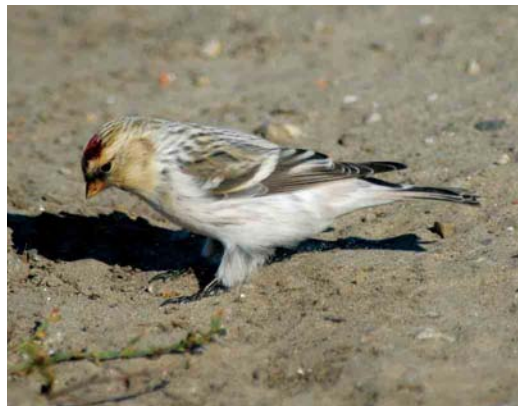
503 Lesser Grey Shrike / Kleine Klapekster Lanius minor , adult female, Groote Vlak, Texel, Noord-Holland, 5 October 504 Desert Wheatear / Woestijntapuit Oenanthe deserti , first-year male, Westerstrand, Schiermonnikoog, Friesland, 29 October 2005 505-506 Desert Wheatear / Woestijntapuit Oenanthe deserti , first-year male, IJmuiden, Noord-Holland, 13 November 2005 507 Arctic Redpoll / Witstuitbarmsijs Carduelis hornemanni exilipes , first-winter, Oosterscheldekering, Westenschouwen, Zeeland, 19 November 2005 508 Hornemann's Redpoll / Groenlandse Witstuitbarmsijs Carduelis hornemanni hornemanni , adult male, Huisduinen, Noord-Holland, 15 October 2003