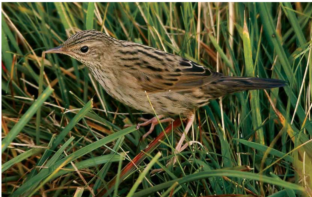
548 Lanceolated Warbler / Kleine Sprinkhaanzanger Locustella lanceolata , Fair Isle, Shetland, Scotland, 15 September 2006