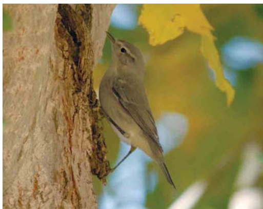
530 Eurasian Collared Dove / Turkse Tortel Streptopelia decaocto , Cabo da Praia, Teirceira, Azores, 16 September 2006 531 Common Crane / Kraanvogel Grus grus , Madeira, 19 October 2006 532 Isabelline Wheatear / Izabeltapuit Oenanthe isabellina , Carmel Head, Anglesey, Wales, 23 September 2006 533 Siberian Accentor / Bergheggenmus Prunella montanella , Rumeli Feneri, Istanbul, Turkey, 2 November 2006 534 Presumed Daurian Shrike / vermoedelijke Daurische Klauwier Lanius isabellinus , Soral, Genève, Switzerland, 7 October 2006 535 Iberian Chiffchaff / Iberische Tjiftjaf Phylloscopus ibericus , Oukaimeden, High Atlas, Morocco, 12 October 2006