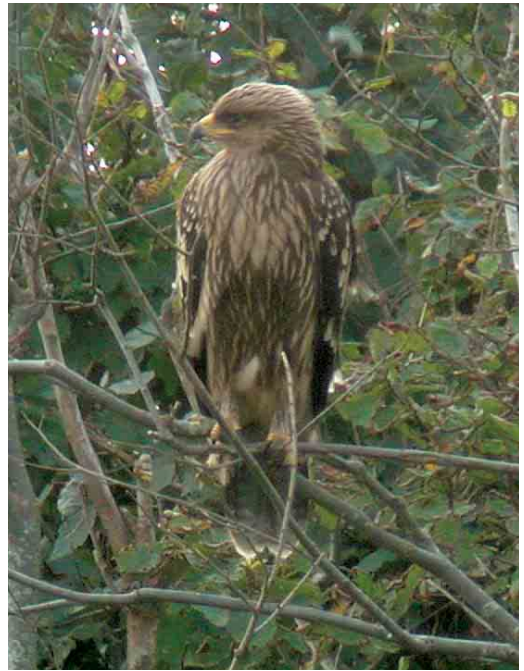
483 Lesser Spotted Eagle / Schreeuwarend Aquila pomarina , juvenile, Domburg, Zeeland, 24 September 2005

24-25 September, Domburg, Westkapelle, Oostkapelle and Grijskerke, Veere , Zeeland, juvenile, photograph-