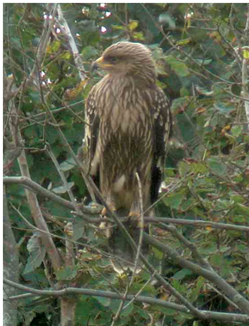
483 Lesser Spotted Eagle / Schreeuwarend Aquila pomarina , juvenile, Domburg, Zeeland, 24 September 2005

24-25 September, Domburg, Westkapelle, Oostkapelle and Grijskerke, Veere , Zeeland, juvenile, photograph-