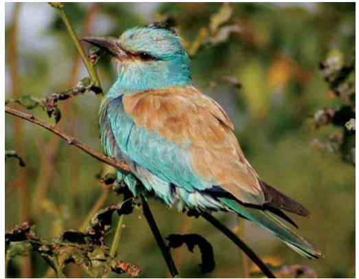
484 Squacco Heron / Ralreiger Ardeola ralloides , adult, Alblisserdam, Zuid-Holland, 2 July 2005 485 Great Snipe / Poelsnip Gallinago media , Hessenpoort, Zwolle, Overijssel, 13 September 2005 486 Eurasian Pygmy Owl / Dwerguil Glaucidium passerinum , Sumarreheide, Friesland, 4 October 2002 487 European Roller / Scharrelaar Coracias garrulus , adult, Texel, Noord-Holland, 16 September 2005