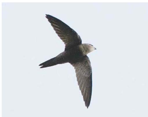
587 Vale Gierzwaluw / Pallid Swift Apus pallidus , Vlieland, Friesland, 21 oktober 2006

Net toen we er zo'n beetje klaar mee waren, kwamen de vogels wéér dichterbij – toch nog even kijken. De bij elkaar vliegende vogels bekijkend vielen ons toch echt verschillen op: één had meer contrast op de boven- en ondervleugel en een iets andere jizz met stompere vleugelpunten en leek af en toe een bruine tint te hebben. Onze gedachten aan Vale Gierzwaluw namen weer toe – of liepen we onszelf nu gek te maken? Lichtelijk in paniek probeerden we tegelijkertijd beide vogels niet kwijt te raken, kenmerken vast te stellen, foto's te maken en anderen te bellen. Jeroen de Bruyn zag beide vogels vervolgens vanaf Duinkersoord en merkte ook de verschillen op. Inmiddels hadden wij versterking gekregen van de eerste gearriveerde vogelaars, waaronder Han Zevenhuizen die op het strand enkele plaatjes wist te