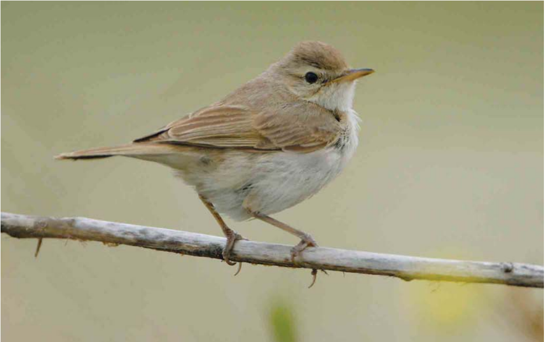
577 Kleine Spotvogel / Booted Warbler Acrocephalus caligatus , Maasvlakte, Zuid-Holland, 9 oktober 2006 (Roland Jansen)