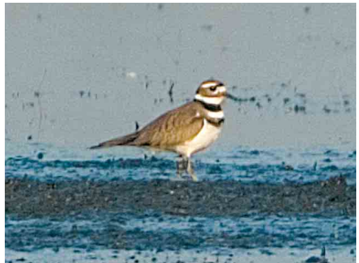
10-11 Killdeerplevier / Killdeer Charadrius vociferus , eerstejaars, Rottige Meente, Friesland, 4 april 2005

rand in veld moeilijk te zien maar op sommige foto's roodachtige tint zichtbaar. Poot grijsachtig groen.