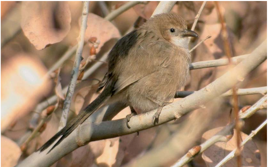
70 Iraq Babbler / Iraakse Babbelaar Turdoides altirostris , Mheimideh, Syria, January 2006