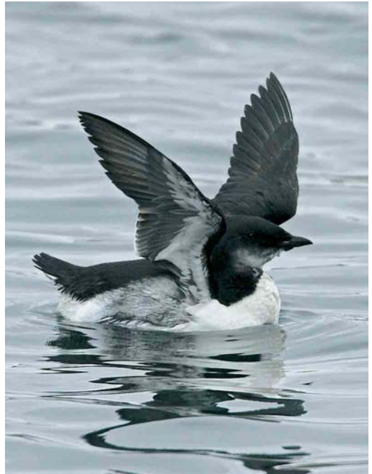
32 Kumlien's Gull / Kumliens Meeuw Larus glaucooides kumlieni , Nimmo's Pier, Galway, Ireland, 2 January 2006 33 Brännich's Murre / Kortbekzeekoet Uria lomvia , Lerwick harbour, Shetland, Scotland, November 2005 34 Forster's Tern / Forsters Stern Sterna forsteri , Cabo da Praia, Terceira, Azores, 22 November 2005