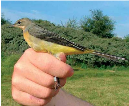
26 Grey Wagtail / Grote Gele Kwikstaart Motacilla cinerea , Meijendel, Zuid-Holland, Netherlands, 13 September 2005 (Ben M Wielstra)