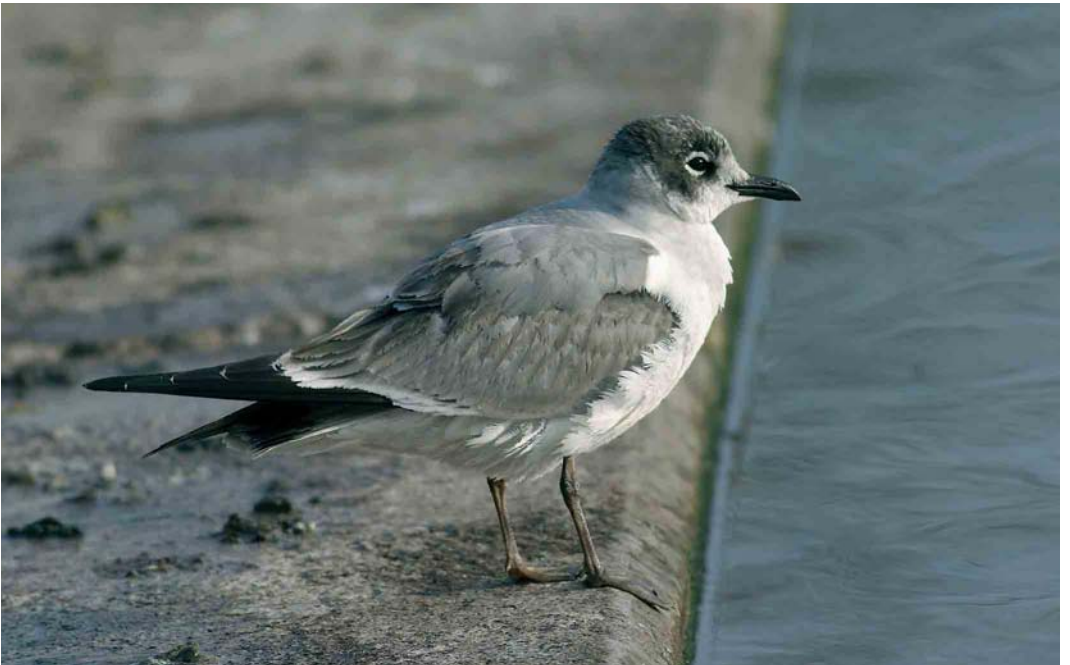
31 Franklin's Gull / Franklins Meeuw Larus pipixcan , first-winter, Schaffhausen, Switzerland, 15 January 2006