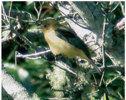
43 Upland Sandpiper / Bartrams Rüter Bartramia longicauda , Ponta Delgada, Flores, Azores, 31 October 2005 (Frédéric Jiguet) 44 Chimney Swift / Schoorsteengierzwaluw Chaetura pelagica , São Miguel, Azores, 28 October 2005 (Frédéric Jiguet) 45 Yellow-billed Cuckoo / Geelsnavelkoekoek Coccyzus americanus , Corvo, Azores, 19 October 2005 (Peter Alfrey) 46 Mourning Dove / Amerikaanse Treurduif Zenaida macroura , Corvo, Azores, 2 November 2005 (Peter Alfrey) 47 American Barn Swallow / Amerikaanse Boerenzwaluw Hirundo rustica erythrogaster , first-winter, Ponta Delgada, Flores, Azores, 30 October 2005 (Frédéric Jiguet) 48 Scarlet Tanager / Zwartvleugeltangare Piranga olivacea , first-winter male, Corvo, Azores, 28 October 2005 (Peter Alfrey) for all, cf Dutch Birding 27: 413, 424-425, 2005