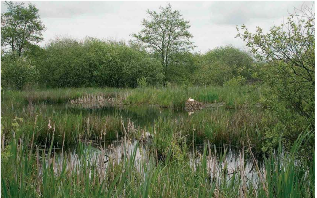
13 Wilde Zwaan / Whooper Swan Cygnus cygnus , adult vrouwtje op nest, Wapserveense Petgaten, Drenthe, 12 mei 2005