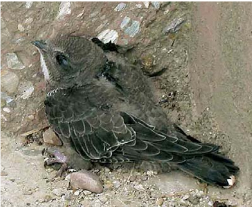
Mystery photograph I (July)