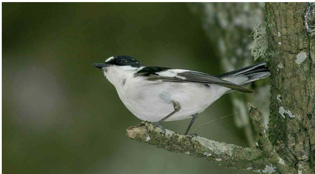
3 Atlas Flycatcher / Atlasvliegenvanger Ficedula speculigera , second-calendar-year male, Beni M'tir, Jendouba, Tunisia, 3 May 2005

limited as exceptions occur while, furthermore, ageing is essential as a number of features do not apply for second-calendar-year males. Three of the taxa (Collared, Atlas and Iberian Pied) have an extensive white forehead in adult males. One (Collared) has a complete white collar and three an almost complete white collar (not nominate European Pied). Four have an obvious white rump (not nominate European Pied), which is most obvious in Collared and Atlas. The amount of white on the greater coverts is most extensive, complete and reaching the outermost covert on the bend of the wing in Atlas and Iberian Pied. The extent of white on the tertials is greatest in Iberian Pied. The white patch at the base of the primaries is largest in Collared and smallest (often narrow and not reaching the outer primaries) in nominate European Pied, while Atlas and Iberian Pied are intermediate in this respect. Semi-collared has much white in the outer tail , while Collared, Atlas and Iberian Pied usually have little or no white. Diagnostic taxon features in adult males probably are 1 for Semi-collared, the 'extra' white wingbar formed by white tips of median coverts and the large amount of white in outer tail; 2 for Collared, the complete white collar; 3 for nominate European Pied, the lack of a large white primary patch; 4 for Atlas, the extensive white forehead; and 5 for Iberian Pied, the extensive