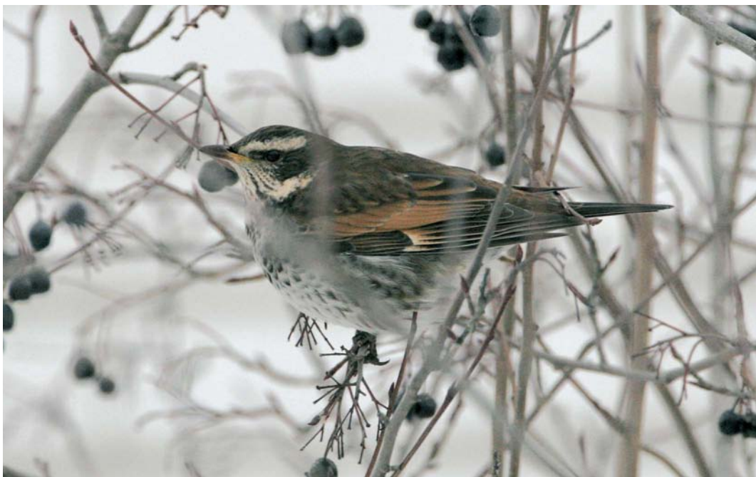
67 Dusky Thrush / Bruine Lijster Turdus eunomus , first-year, Raahe, Pitkäkari, Finland, 28 December 2005