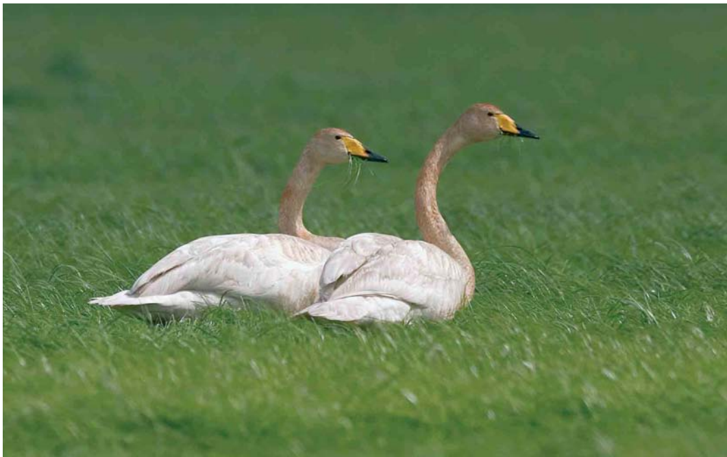
15 Wilde Zwanen / Whooper Swans Cygnus cygnus , adult vrouwtje (rechts) en adult mannetje, Wapserveense Petgaten, Drenthe, 13 juni 2005 (Harvey van Diek)