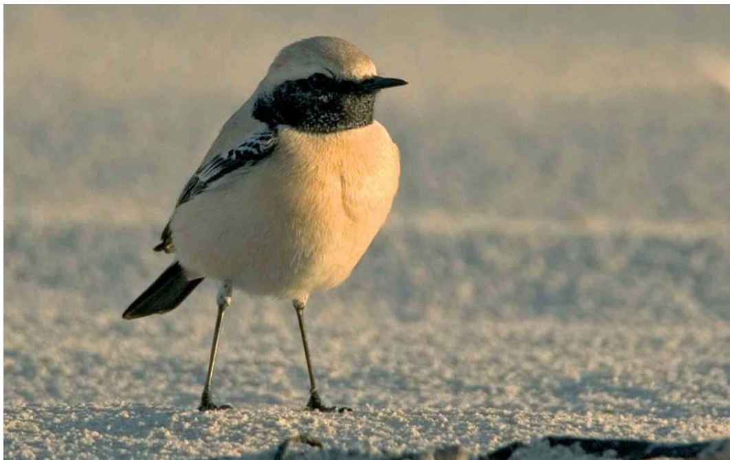
79 Woestijntapuit / Desert Wheatear Oenanthe deserti , mannetje, Vlieland, Friesland, 19 november 2005 (Jeroen Reneerkens)