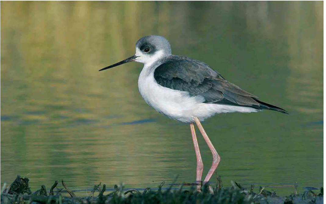
76 Steltkluut / Black-winged Stilt Himantopus himantopus , eerstejaars, Holwerd, Friesland, 25 december 2005 (Jan Bisschop)