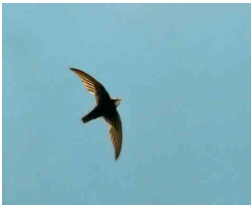
24 Little Swift / Huisgierzwaluw Apus affinis , Cádiz province, Andalucía, Spain, 14 June 2004