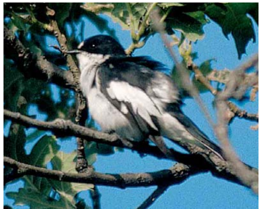
4 Atlas Flycatcher / Atlasvliegenvanger Ficedula speculigera , female, Beni M'tir, Jendouba, Tunisia, 3 May 2005 (René Pop) 5-7 Iberian Pied Flycatcher / Iberische Vliegenvanger Ficedula hypoleuca iberiae , male, Sierra de Gredos, Extremadura, Spain, 12 June 2002 (Arnoud B van den Berg) 8 Iberian Pied Flycatcher / Iberische Vliegenvanger Ficedula hypoleuca iberiae , female, Sierra de Gredos, Extremadura, Spain, 12 June 2002 (Arnoud B van den Berg) 9 Iberian Pied Flycatcher / Iberische Vliegenvanger Ficedula hypoleuca iberiae , male, Sierra de Gredos, Extremadura, Spain, 12 June 2002 (Arnoud B van den Berg)