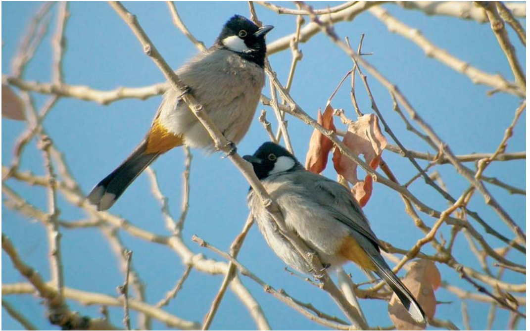
69 White-eared Bulbuls / Witoorbuulbuuls Pycnonotus leucotis , Deir ez-Zor, Syria, January 2006