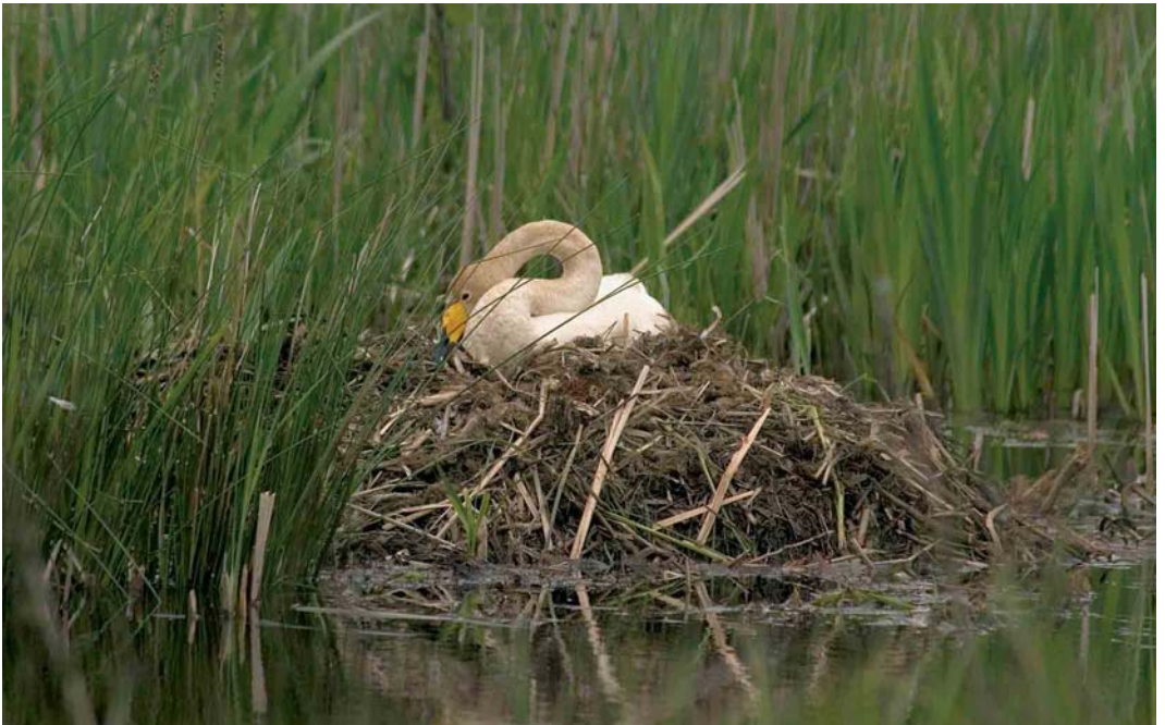
14 Wilde Zwaan / Whooper Swan Cygnus cygnus , adult vrouwtje op nest, Wapserveense Petgaten, Drenthe, 12 mei 2005