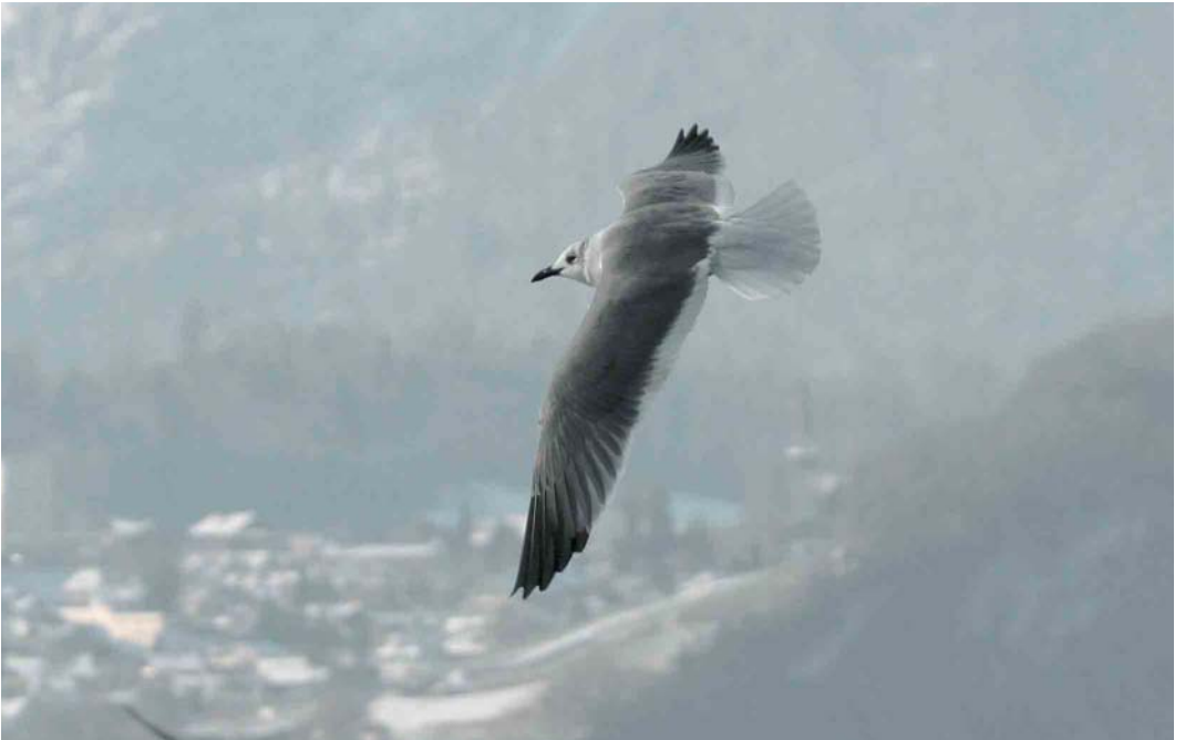
30 Laughing Gull / Lachmeeuw Larus atricilla , Merligen, Thuner See, Bern, Switzerland, 20 December 2005