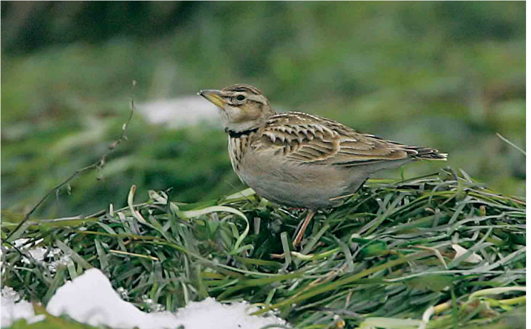
36 Bimaculated Lark / Bergkalanderleeuwerik Melanocorypha bimaculata , Ølsemagle Revle, Sjælland, Denmark, 4 January 2006