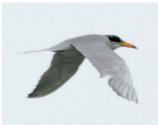
21-23 River Tern / Rivierstern Sterna aurantia , adult, Emer-Ab-Bandan, Golestan, Iran, 18 January 2005 (Jaap Schelvis)

HEAD Black cap extending beneath eye, with some white feathers on forehead and crown. Lore with some dark speckling.