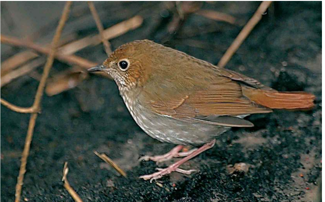
72 Rufous-tailed Robin / Snornachtegaal Luscinia sibilans , Bialystok, Poland, 30 December 2005 (Tomek Kulakowski)