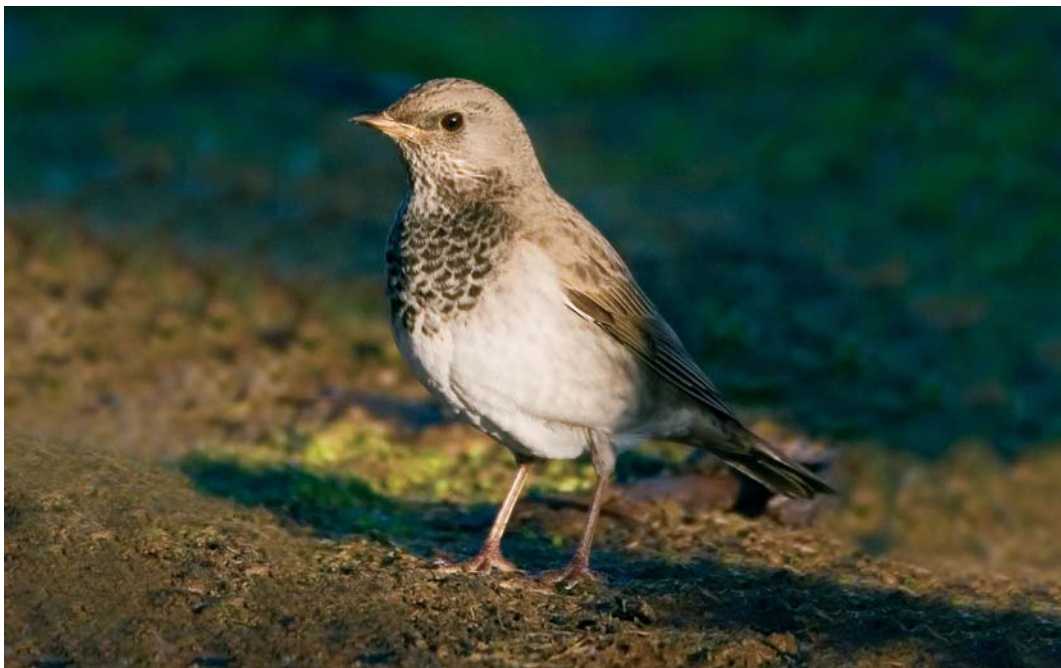
68 Black-throated Thrush / Zwartkeellijster Turdus atrogularis , male, Leira, Garður, Iceland, 14 November 2005