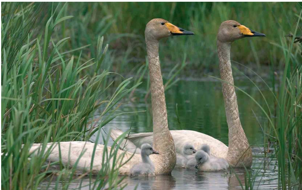
16 Wilde Zwanen / Whooper Swans Cygnus cygnus , Wapserveense Petgaten, adult vrouwtje (rechts), adult mannetje en vier jongen, Drenthe, 24 mei 2005