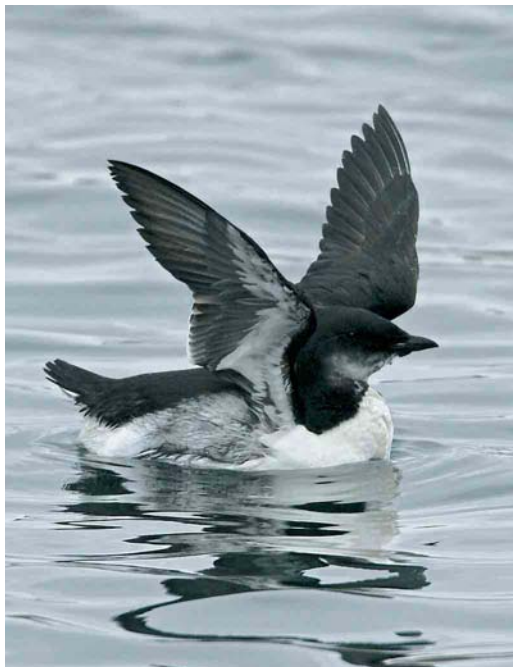
32 Kumlien's Gull / Kumliens Meeuw Larus glaucooides kumlieni , Nimmo's Pier, Galway, Ireland, 2 January 2006 33 Brännich's Murre / Kortbekzeekoet Uria lomvia , Lerwick harbour, Shetland, Scotland, November 2005 34 Forster's Tern / Forsters Stern Sterna forsteri , Cabo da Praia, Terceira, Azores, 22 November 2005