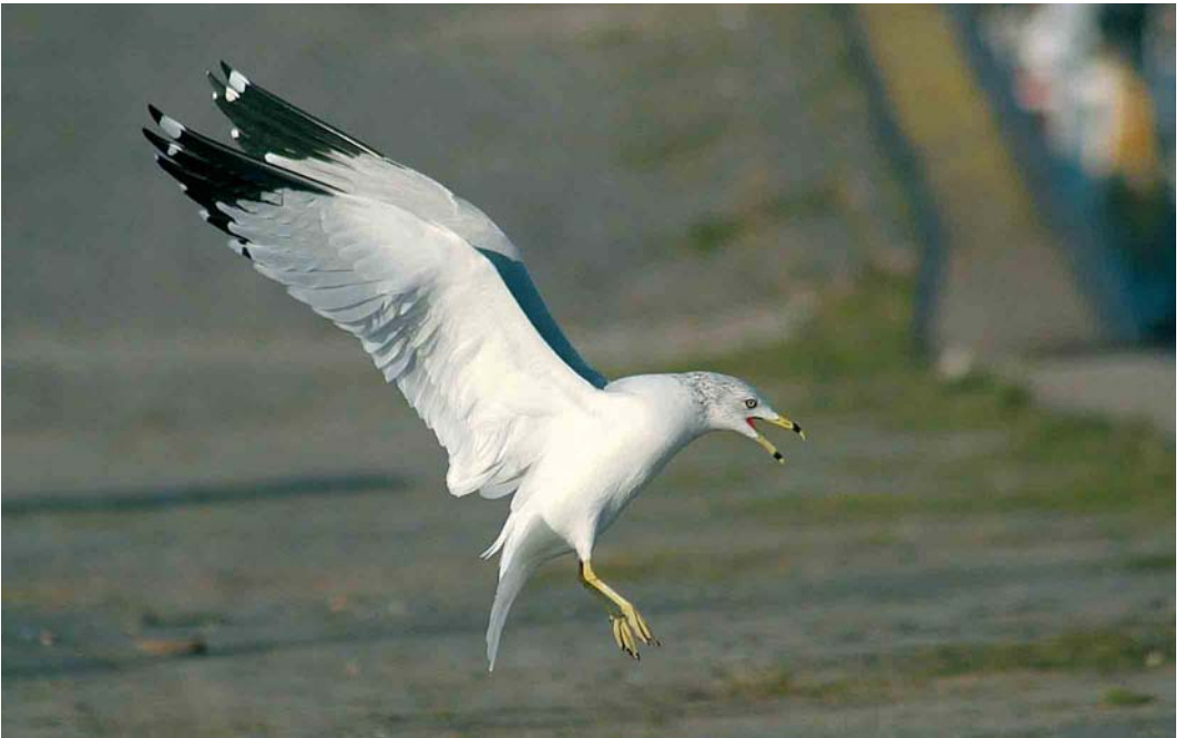
77 Ringsnavelmeeuw / Ring-billed Gull Larus delawarensis , adult, Tiel, Gelderland, 9 januari 2006 (Richard Gerritsen)