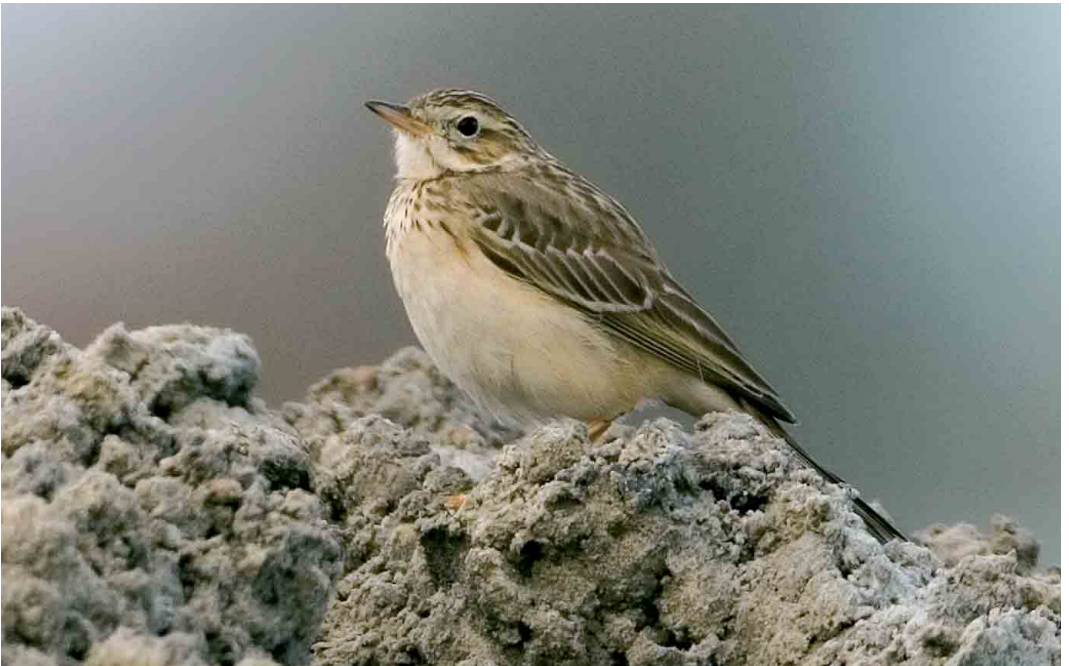
91 Mongoolse Pieper / Blyth's Pipit Anthus godlewskii , Oostende, West-Vlaanderen, 19 november 2005 (Patrick Beirens)