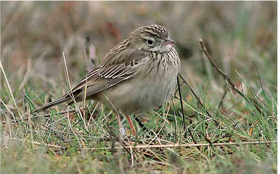
71 Blyth's Pipit / Mongoolse Pieper Anthus godlewskii , Lumijoki Varjakka, Finland, 22 November 2005 (William Velmala) cf Dutch Birding 27: 413, 2005