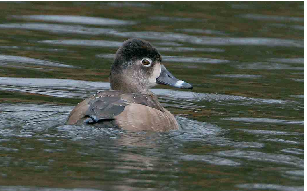
75 Ringsnaveleend / Ring-necked Duck Aythya collaris , vrouwtje, Zwolle, Overijssel, 5 december 2005