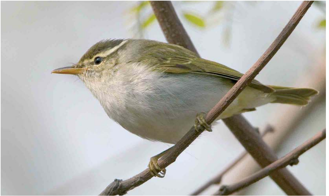
28 Eastern Crowned Warbler / Kroonboszanger Phylloscopus coronatus , Happy Island, Hebei, China, 4 May 2005 ( Ran Schols ). Eastern Crowned Warbler can appear rather similar to Arctic Warbler P borealis . Distinguishing features visible in this plate include the clean white underparts and the dark crown-side. 29 Eastern Crowned Warbler / Kroonboszanger Phylloscopus coronatus , Happy Island, Hebei, China, May 2005 ( Jan Bisschop ). From the Phylloscopus warblers recorded in the Western Palearctic, Eastern Crowned Warbler is the only species combining a pale median crown-stripe with plain tertials. Note also the strongly contrasting dark crown-side and the double wing-bar.