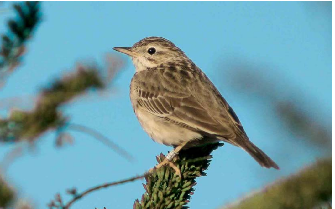
90 Mongoolse Pieper / Blyth's Pipit Anthus godlewskii , Oostende, West-Vlaanderen, 21 november 2005