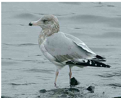
59 Little Swift / Huisgierzwaluw Apus affinis , Overstrand, Norfolk, England, 13 November 2005 cf Dutch Birding 27: 413, 2005 60 Grey Hypocolius / Zijdestaart Hypocolius ampelinus , adult male, Ghanatut, Abu Dhabi, United Arab Emirates, 4 January 2006 61 Dougall's Tern / Dougalls Stern Sterna dougallii , adult, Funchal, Madeira, 14 December 2005 62 Hume's Leaf Warbler / Humes Bladkoning Phylloscopus humei , Ouessant, Finistère, France, 8 January 2006 63 Lesser Sand Plover / Mongoolse Plevier Charadrius mongolus , Rewa, Hel peninsula, Poland, 30 December 2005 64 American Herring Gull / Amerikaanse Zilvermeeuw Larus smithsonianus , third-winter, Nimmo's Pier, Galway, Ireland, 2 January 2006