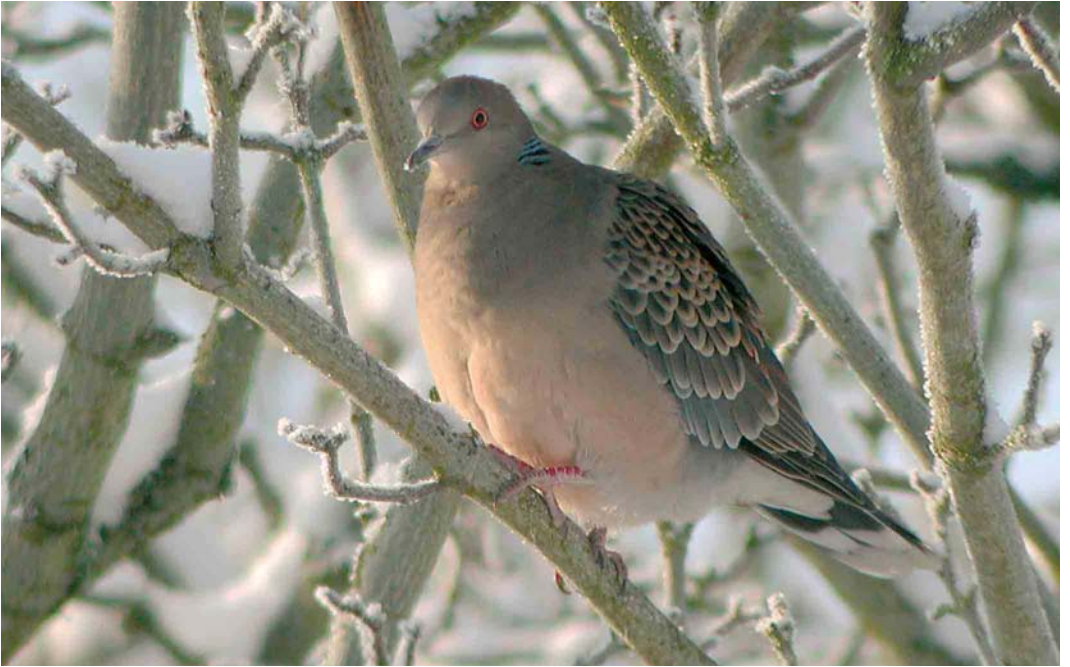
35 Oriental Turtle Dove / Oosterse Tortel Streptopelia orientalis , Falköping, Västergötland, Sweden, 3 January 2006 (David Erterius)