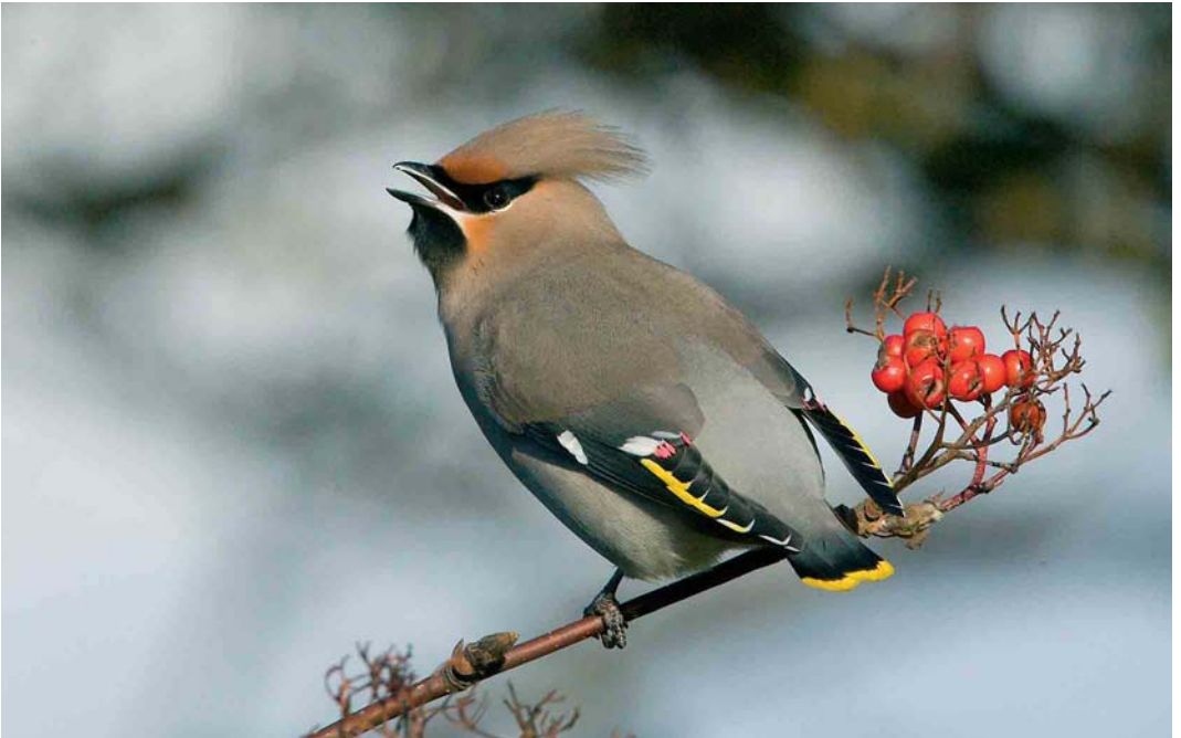
82 Pestvogel / Bohemian Waxwing Bombycilla garrulus , adult, Terschelling, Friesland, 17 november 2005