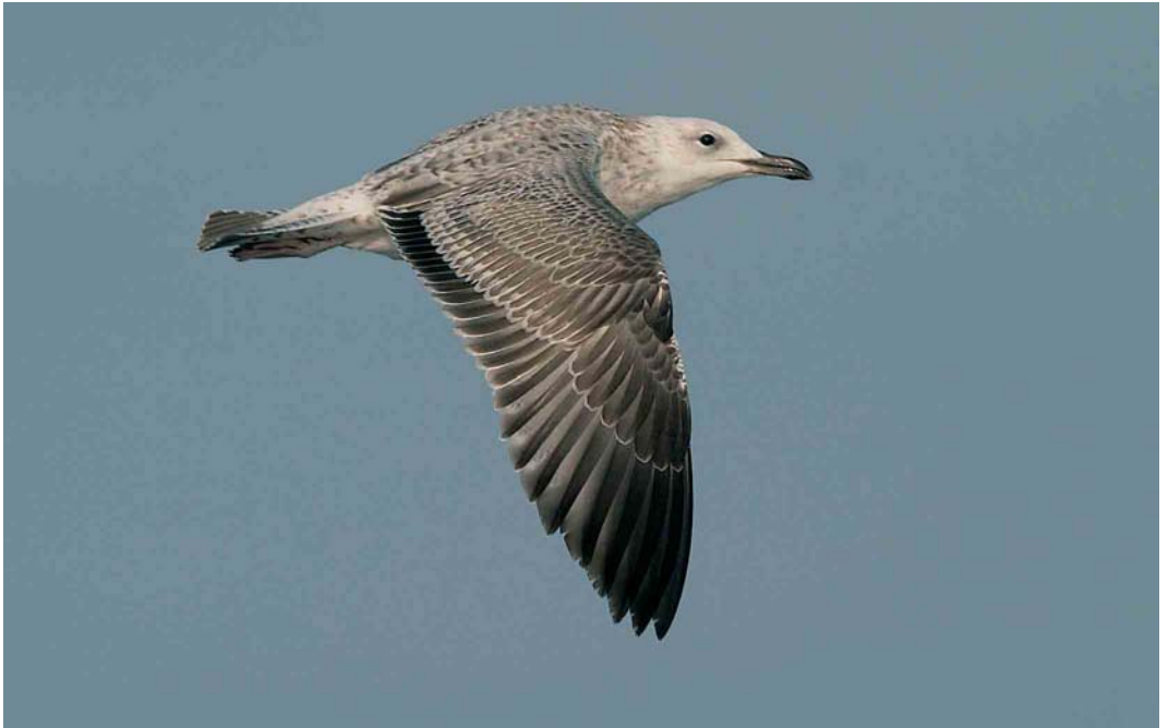
19-20 Caspian Gull / Pontische Meeuw Larus cachinnans , 6 miles off Gijón, Asturias, Spain, 24 September 2005. Note sloping forehead, small white head and long and slender bill. Note pale underwing with pale underside of primaries. Also note narrow wings and small white head. Upperwing pattern shows dark secondaries bordered by whitish borders of greater coverts and dark outerwebs and pale innerwebs ('venetian blind') visible in inner primaries.