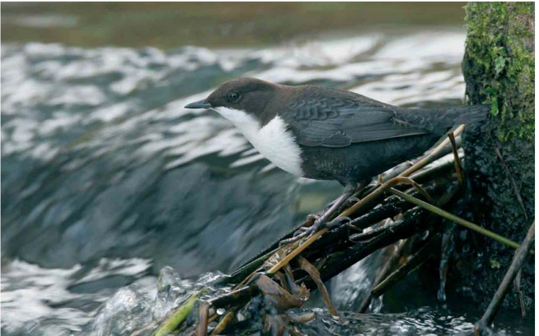
83 Zwartbuikwaterspreeuw / Black-bellied Dipper Cinclus cinclus cinclus , Knardijk, Flevoland, 31 oktober 2005