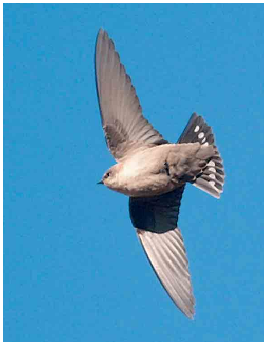
55 Steppe Grey Shrike / Steppeklapekster Lanius pallidirostris , Ree, Jæren, Rogaland, Norway, 22 November 2005 cf Dutch Birding 27: 421, 2005 56 Moroccan Pale Crag Martin / Marokkaanse Vale Rotszwaluw Ptyonoprogne obsoleta presaharica , Aouinet Torkoz, Lower Draa, Morocco, 10 January 2006 57 Desert Wheatear / Woestijntapuit Oenanthe deserti , Migra Ferha, Malta, December 2005 58 Upland Sandpiper / Bartrams Ruitter Bartramia longicauda , juvenile, Kingston Seymour, Somerset, England, 23 November 2005