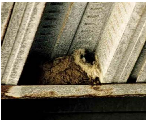
25 Nest of Little Swift / Huisgierzwaluw Apus affinis , Cádiz province, Andalucía, Spain, 14 June 2004