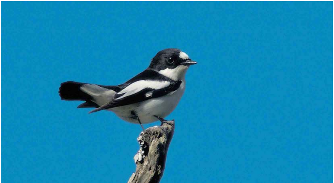
2 Atlas Flycatcher / Atlasvliegenvanger Ficedula speculigera , male, Beni M'tir, Jendouba, Tunisia, 3 May 2005

tant than Collared and European Pied (Sætre 2001ab), with which it was considered conspecific until at least 1977 (Voous 1977).