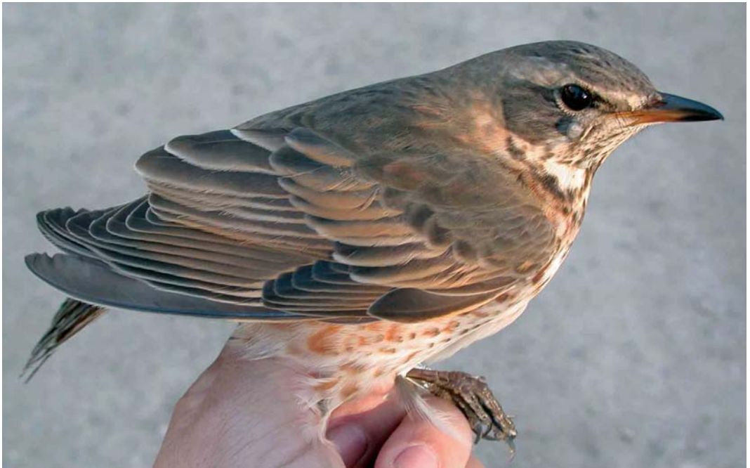
66 Naumann's Thrush / Naumanns Lijster Turdus naumanni , first-winter female, Canal Vell, Ebro delta, Tarragona, Spain, November 2005