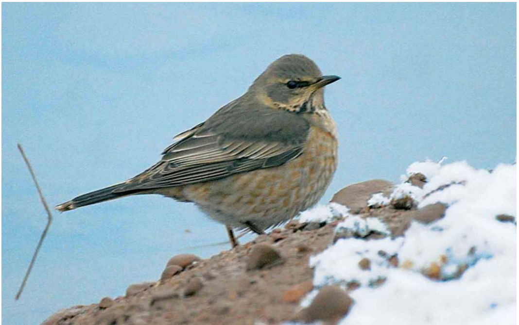
65 Naumann's Thrush / Naumanns Lijster Turdus naumanni , Kalajoki Keihäslahti, Finland, 7 December 2005