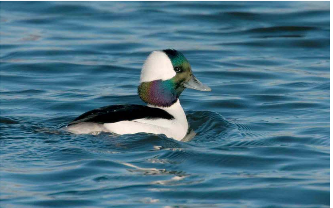
74 Buffelkopeend / Bufflehead Bucephala albeola , mannetje, Gaatkensplas, Barendrecht, Zuid-Holland, 26 december 2005