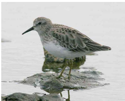
37 American Coot / Amerikaanse Meerkoet Fulica americana , Lagoa de Capitão, Pico, Azores, 19 December 2005 (Eric Didner) 38 Belted Kingfisher / Bandijsvogel Ceryle alcyon Santa Cruz, Graciosa, Azores, 21 December 2005 (Eric Didner) 39 Semipalmated Plover / Amerikaanse Bontbekplevier Charadrius semipalmatus , Ponta Delgada, Flores, Azores, 24 November 2005 (Stefan Pfützke) 40 American Bittern / Noord-Amerikaanse Roerdomp Botaurus lentiginosus , Lagoa Azul, São Miguel, Azores, 27 October 2005 (Frédéric Jiguet) 41 Pied-billed Grebe / Dikbekfuut Podilymbus podiceps , Lajes, Pico, Azores, 19 December 2005 (Eric Didner) 42 Least Sandpiper / Kleinste Strandloper Calidris minutilla , Cabo da Praia, Terceira, Azores, 24 November 2005 (Stefan Pfützke) for some, cf Dutch Birding 27: 424-425, 2005