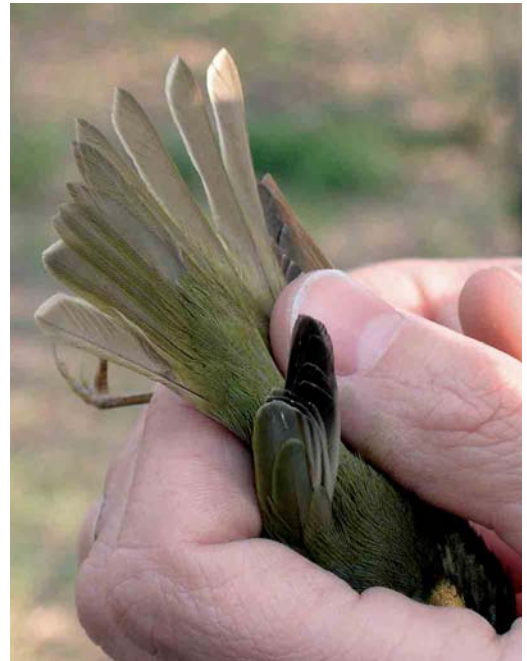
27 Eastern Crowned Warbler / Kroonboszanger Phylloscopus coronatus , Happy Island, Hebei, China, May 2005 (Nils van Duivendijk). Note that t4-6 show white fringes.

By now, we have gone through all Phylloscopus species depicted in the most commonly