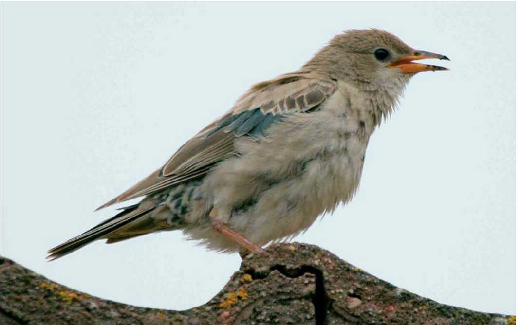
80 Roze Spreeuw / Rose-coloured Starling Sturnus roseus , juveniel ruiend naar eerste-winter, Wassenaar, Zuid-Holland, november 2005