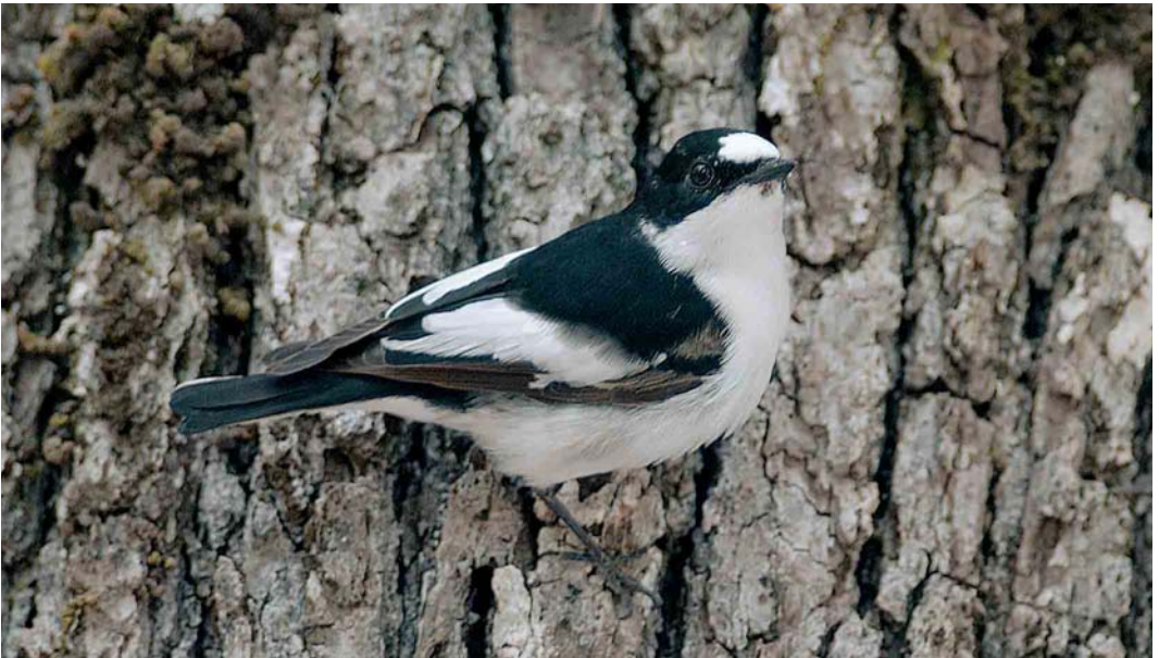
1 Atlas Flycatcher / Atlasvliegenvanger Ficedula speculigera , male, Beni M'tir, Jendouba, Tunisia, 3 May 2005

Like Atlas Flycatcher, Iberian Pied Flycatcher is an allopatric taxon, coming into contact with other pied flycatcher taxa on migration only. The mitochondrial genetic distances between Semi-collared, Collared, nominate European Pied F h hypoleuca , Atlas and Iberian Pied Flycatchers are all of the order of 3-4%, apart from nominate European Pied and Iberian Pied which are c 0.5%, close to the intra-taxon differences of 0.12-0.39% (Sangster et al 2004). The latter is somewhat surprising because Iberian Pied looks much more similar to Atlas than to nominate European Pied (cf Cramp & Perrins 1993, Mild 1993). Of all pied flycatchers, Semi-collared appears to be more dis-