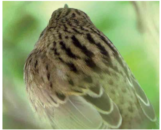
Mystery photograph II (May)

below carefully and identify the birds in the photographs. Solutions can be sent in three different ways: