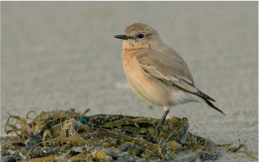
81 Izabeltapuit / Isabelline Wheatear Oenanthe isabellina , Terschelling, Friesland, 18 november 2005 (Arie Ouwerkerk)