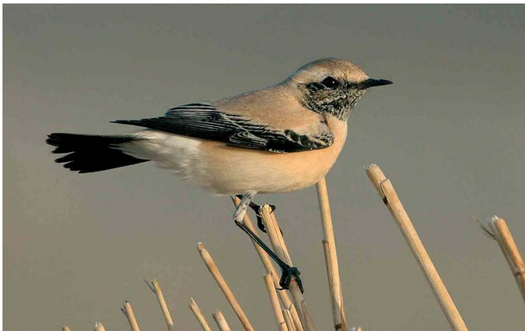
78 Woestijntapuit / Desert Wheatear Oenanthe deserti , adult mannetje, IJmuiden, Noord-Holland, 12 november 2005 (Christiaan Giljam)