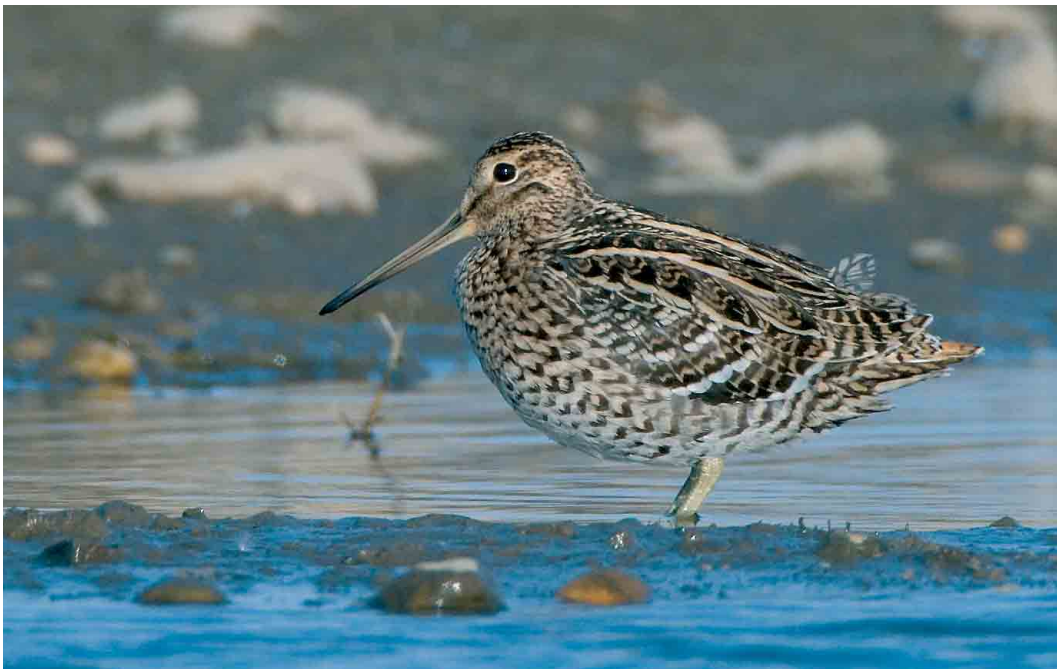
217 Great Snipe / Poelsnip Gallinago media , Elen, Limburg, Belgium, 5 May 2007