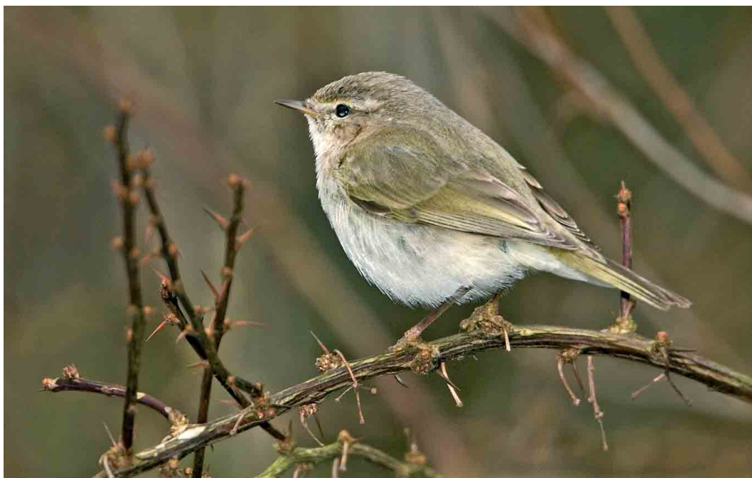
263 Siberische Tjiftjaf / Siberian Chiffchaff Phylloscopus collybita tristis , Bilthoven, Utrecht, 23 februari 2007 (Roland Jansen)

Zwarte Zeekoet Cephus grylle gezien, ditmaal in zomerkleed, van 23 februari tot 3 maart.