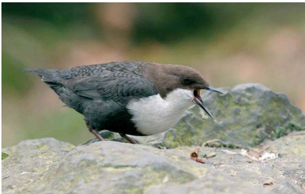
259 Zwartbuikwaterspreeuw / Black-bellied Dipper Cinclus cinclus cinclus , Beekhuizen, Gelderland, 11 april 2007 (Michel Veldt)