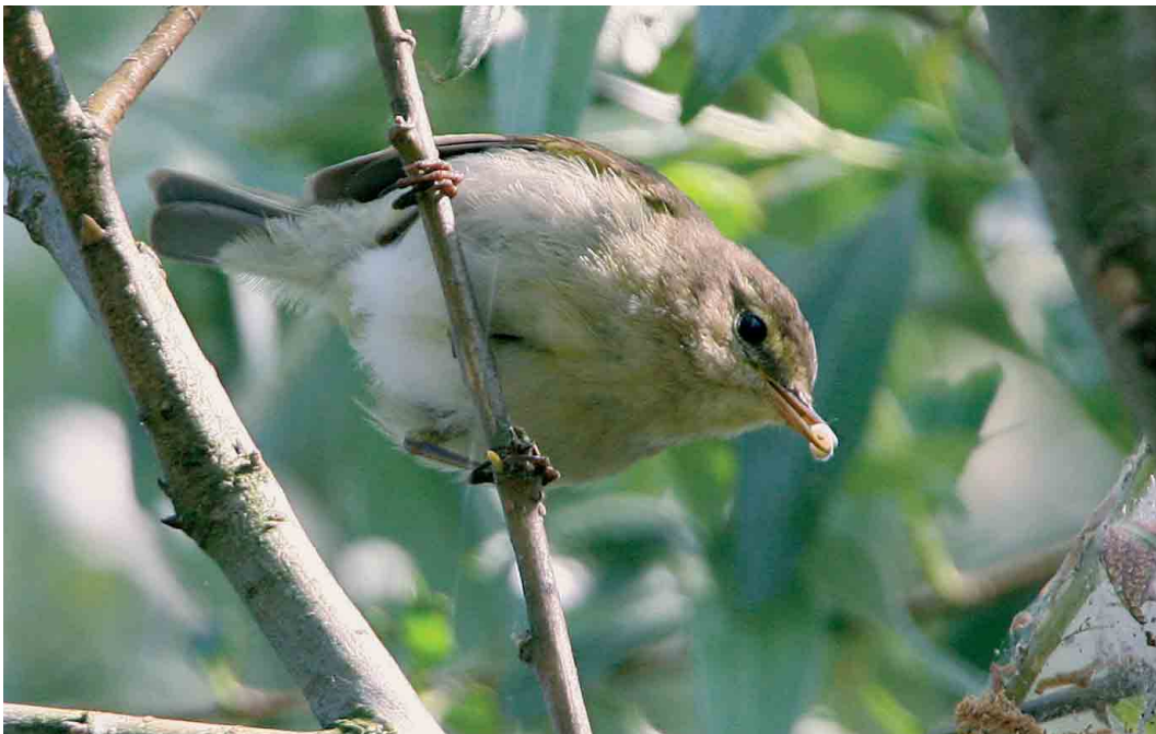
262 Iberische Tjiftjaf / Iberian Chiffchaff Phylloscopus ibericus , Diemerzeedijk, Noord-Holland, 5 mei 2007