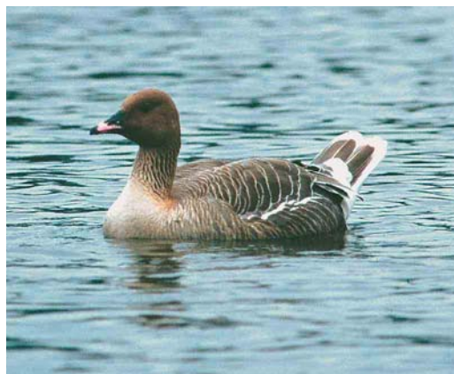
218 Black-browed Albatross / Wenkbrauwwalbatros Thalassarche melanophris , adult, Sula Sgeir, Outer Hebrides, Scotland, 9 May 2007 (Rob Laughton) 219 Squacco Heron / Ralreiger Ardeola ralloides , Boavista, Cape Verde Islands, 5 April 2007 (Pedro López Suárez) 220 Baltic Gull / Baltische Mantelmeeuw Larus fuscus fuscus , fourth calendar-year, Hempsted, Gloucestershire, England, April 2007 (John Sanders) 221 Spotted Sandpiper / Amerikaanse Oeverloper Actitis macularius , adult, Lugar de Baixo, Madeira, 30 April 2007 (David Uit de Weerd) 222 Taiga Bean Goose / Taigarietgans Anser fabalis , Eilat, Israel, April 2007 (Jonathan Merav) 223 Pink-footed Goose / Kleine Rietgans Anser brachyrhynchus , Golfo di Oristano, Sardinia, Italy, 13 February 2007 (Mauro Sanna)