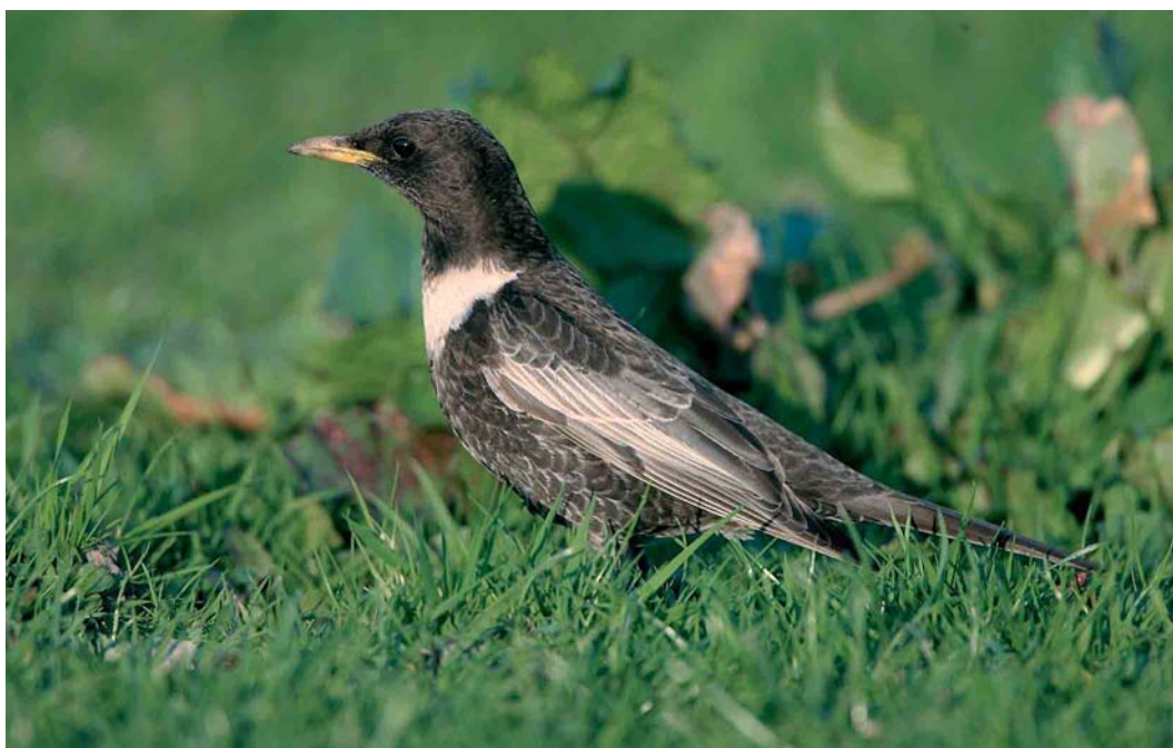
260 Beflijster / Ring Ouzel Turdus torquatus , mannetje, Hensbroek, Noord-Holland, 15 april 2007 (Hans Brinks)