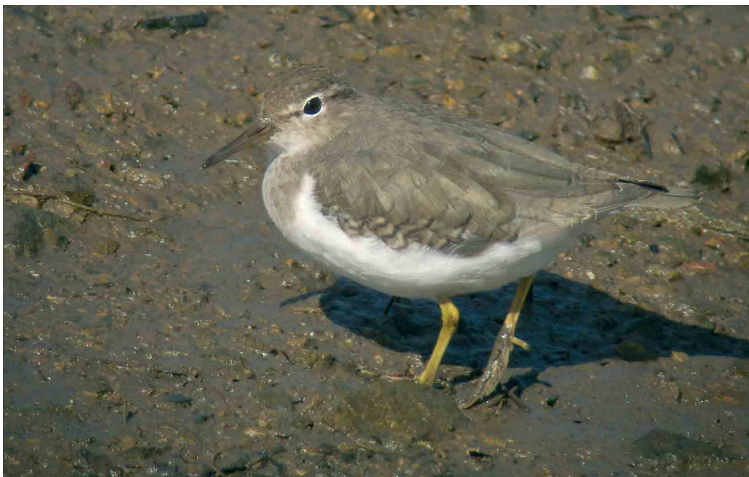
233 Spotted Sandpiper / Amerikaanse Oeverloper Actitis macularius , Hayle, Cornwall, England, April 2007 (Dave Stewart)