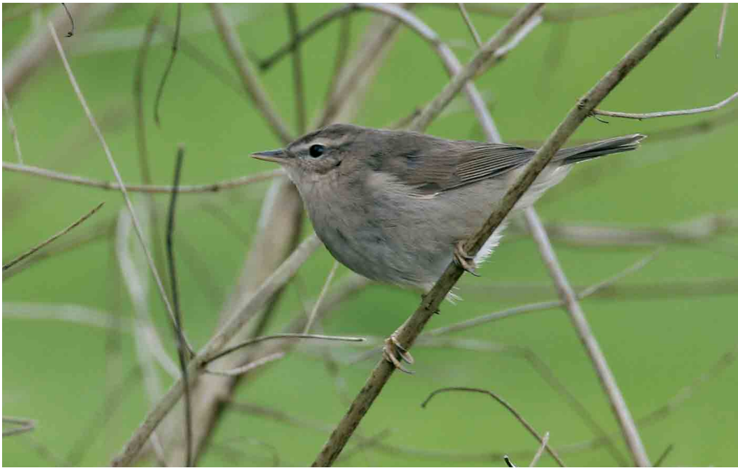
261 Bruine Boszanger / Dusky Warbler Phylloscopus fuscatus , Electra, Groningen, 15 maart 2007 (Mark Schuurman)