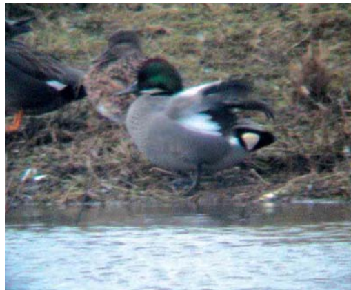
189 Falcated Duck / Bronskopeend Anas falcata , male, Nuldernauw, Gelderland, Netherlands, 27 March 2005 190 Falcated Duck / Bronskopeend Anas falcata , male, Nuldernauw, Gelderland, Netherlands, 1 April 2005 191-192 Falcated Duck / Bronskopeend Anas falcata , male, Asselt, Limburg, Netherlands, 10 February 2002

winter, due to short elongated tertials, which grew longer and more curved during its stay (Rommert Cazemier in litt); however, first-year birds appear to retain shorter and straighter tertials into their first summer, so this bird was probably also an adult. So far, females of possibly wild origin have not been reported in the Netherlands.