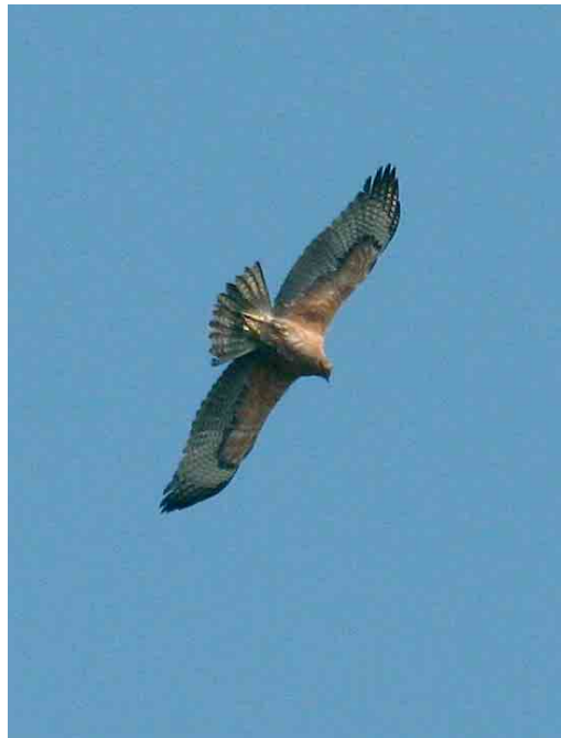
211 Bonelli's Eagle / Havikarend Aquila fasciata , second calendar-year (below), with Common Buzzard / Buizerd Buteo buteo , Lüsekamp, Viersen, Nordrhein-Westfalen, Germany, 12 April 2007 (Daniel Hubatsch) 212-213 Bonelli's Eagle / Havikarend Aquila fasciata , second calendar-year, Lüsekamp, Viersen, Nordrhein-Westfalen, Germany, 12 April 2007 (Daniel Hubatsch)