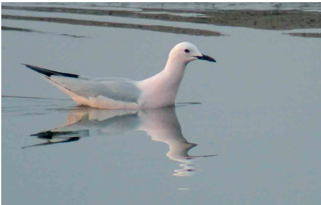
243 Dunbekmeeuw / Slender-billed Gull Larus genei , adult, Het Zwin, Zeeland, 13 april 2007

A fabalis bij Lisse, Zuid-Holland, in een grote groep Toendrarietganzen A serrirostris betrof één van de zeer schaarse meldingen in het westen van het land in de afgelopen winters. Dwergganzen A erythropus waren nog aanwezig in de polders ten noorden van Camperduin, Noord-Holland, tot 26 maart met een maximum van 37 op 2 maart, op 7 maart 18 in het Oudeland van Strijen, Zuid-Holland, op 8 maart 14 op de Korendijksche Slikken, Zuid-Holland, en tot 2 april weer bij Anjum, Friesland, met een maximum van 13 op 8 maart. Verder werden er nog 13 gemeld op andere locaties, met de laatste op 9 april bij de Workumerwaard. Er werden 26 Roodhalsganzen Branta ruficollis opgemerkt met als beste plekken de Bantpolder, Friesland, met vier op 15 en 29 april en Ameland, Friesland, met drie op 22 april. Van de 14 Witbuikrotganzen B hrota verbleven er drie op Wieringen, Noord-Holland, en vier op Texel, Noord-Holland. Voor Zwarte Rotgans B nigricans , waarvan er 15 gemeld werden, was Texel eveneens de beste plek met drie. Op 16 april vloog er één langs Camperduin, een nieuwe telpostsoort. Witoogeenden Aythya nyroca zwommen tot 2 maart op de Keersluisplas, Flevoland, op 8 maart bij 's-Hertogenbosch, Noord-Brabant, op 1 april twee en 9 april één in de Kil van Hurwenen,