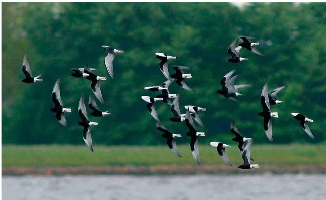
271 White-winged Tern / Witvleugelstern Chlidonias leucopterus , Blauwestad, Groningen, 17 mei 2007 (Roef Mulder)

WHITE-WINGED TERNS From 15 May 2007, a major influx of White-winged Terns Chlidonias leucopterus occurred in the Netherlands. The first sign of what was going to happen was on 14 May with a group of five. On 15 May, 39 were reported., including 24 in one group. On 16 May, numbers (including possible double counts) rose to 977, including groups of 158 and 90, almost all in the north-east. The peak day was 17 May, with 2513 reported, almost all over the country (including groups of 172, 87 and 72). Numbers slowly decreased after that day (775 on 18 May, 441 on 19 May, 352 on 20 May and 131 on 21 May). The only previous major influx in the Netherlands was on 13-16 May 1997, when 350-400 birds were reported. The 1997 influx was concentrated on just a few localities, mainly in the north-east, but included a large group of 200 on 15 May.