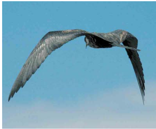
Mystery photograph VI (December)

names of all entrants with at least one correct identification can be viewed at www.dutchbirding.nl .