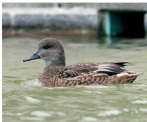
193-194 Falcated Duck / Bronskopeend Anas falcata , first-winter male, with Eurasian Wigeons / Smienten A penelope , Exminster Marshes, Devon, England, November 2006 ( Rob Laughton ) 195-196 Falcated Duck / Bronskopeend Anas falcata , female, Zürich-Honggerberg, Zürich, Switzerland, 10 February 2007 ( Jan Bisschop )

A possible hybrid (or aberrant) Falcated Duck was seen at Nuldernauw, Gelderland, on 6 May 2007 (at the same site where a 'good' male was present in March-May 2005). According to the two observers, the bird showed too much yellow on the lower head and a slighter rounder head than in pure Falcated Duck ( www.dutchbirding.nl ).