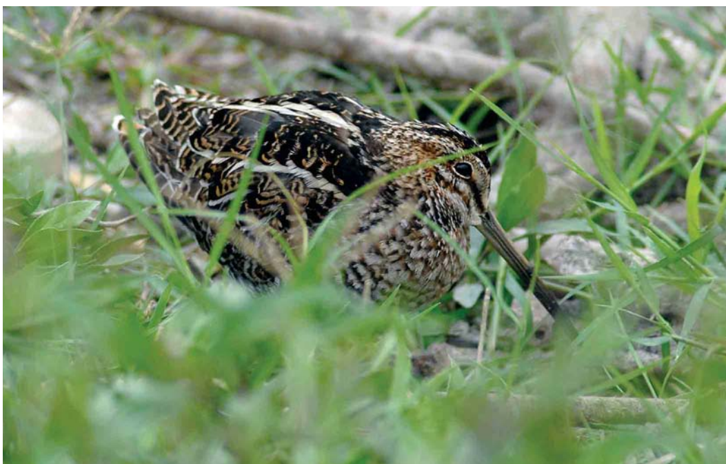
215 Wilson's Snipe / Amerikaanse Watersnip Gallinago delicata , Barragem de Poilão, Santiago, Cape Verde Islands, 26 March 2007 (René Pop)