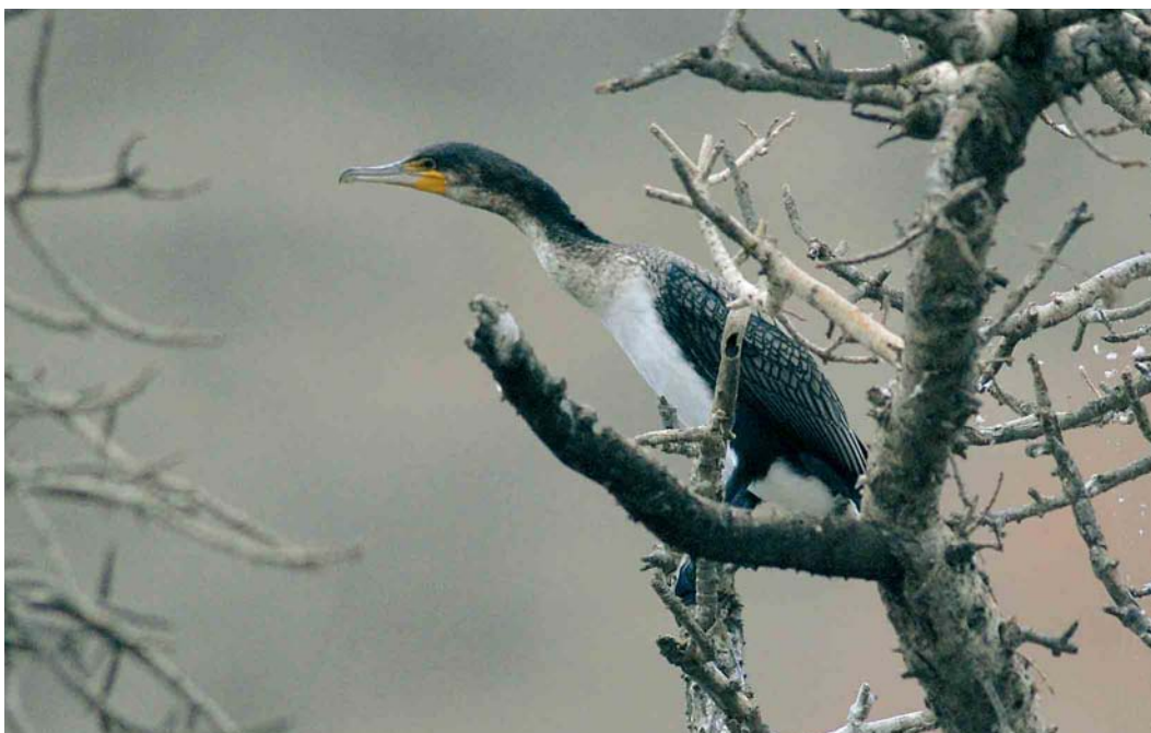
214 White-breasted Cormorant / Afrikaanse Aalscholver Phalacrocorax carbo lucidus , Barragem de Poilão, Santiago, Cape Verde Islands, 27 March 2007