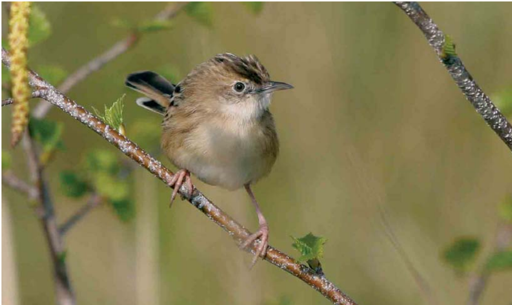
265 Graszanger / Zitting Cisticola juncidis , Oostende, West-Vlaanderen, 2 april 2007 (Johan Buckens)

RALLEN TOT STERNS Vanaf 24 april riep een mannetje Klein Waterhoen Porzana parva in De Blankaart in Woumen maar de vogel werd slechts sporadisch gehoord. We ontvingen waarnemingen van meer dan 14 000 Kraanvogels Grus grus , waarvan alleen al op 4 maart 8462 over de Hoge Venen, Liège. De trekpieken lagen gespreid over de hele periode. Bij Ragnies, Hainaut, werd op 29 april een Griël Burhinus oedipnes gezien. Na 5 april verschenen Steltkluten Himantopus himantopus in Adinkerke, West-Vlaanderen; Doel; Kalmthout; Stuivekenskerke; in de Uitkerkse Polders, West-Vlaanderen (drie); in Warneton, Hainaut; en in Zeebrugge (twee). Op 30 april pleisterde de eerste Morinelplevier Charadrius morinellus voor dit voorjaar in Clermont, Liège, en op 30 april trok er één over de Kalmthoutse Heide. Een Poelsnip Gallinago media werd op 13 april gemeld bij Tournai, Hainaut. Op 29 april verschenen twee Poelruiters Tringa stagnatilis langs de Maas bij Elen, Limburg, en één in Het Zwin in Knokke. Op 30 april verbleef er één in de Achterhaven van Zeebrugge. Op zijn minst verrassend was de Grote