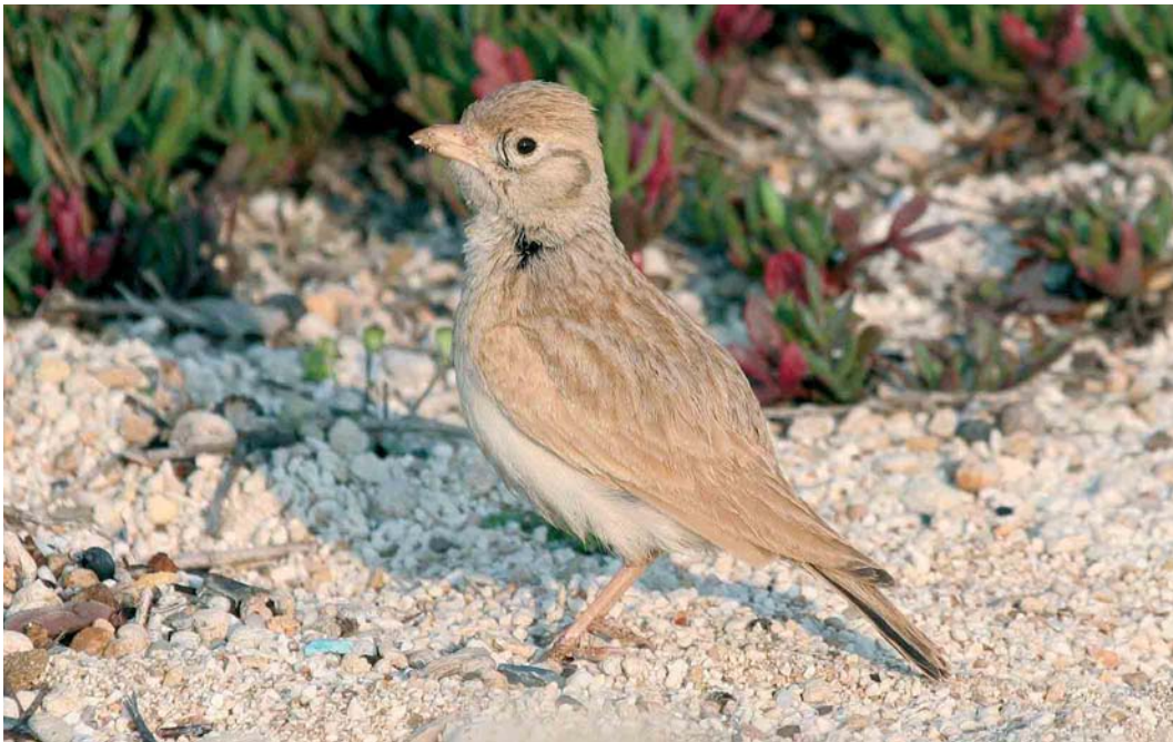
237 Dunn's Lark / Dunns Leeuwerik Eremalauda dunnii , Ayia Napa, Cyprus, 10 April 2007 (Theodoulos Poullis)