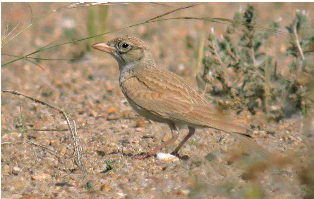
238 Dunn's Lark / Dunns Leeuwerik Eremalauda dunnii , Sabah Al-Ahmad reserve, Kuwait, 7 April 2007 (Chris Batty)