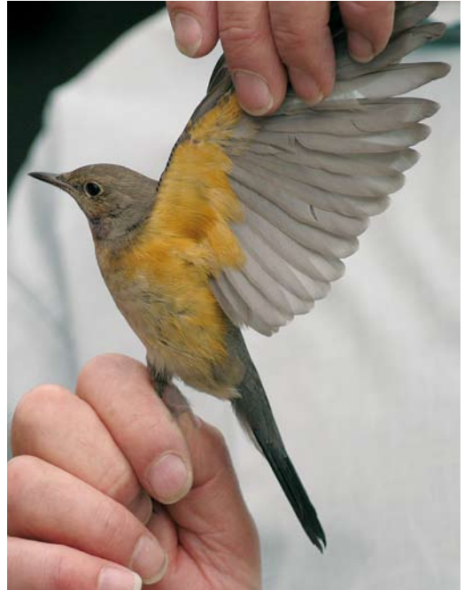
488-489 Perzische Roodborst / White-throated Robin Irania gutturalis , eerstejaars, Sint Laureins, Oost-Vlaanderen (Kjell Janssens)