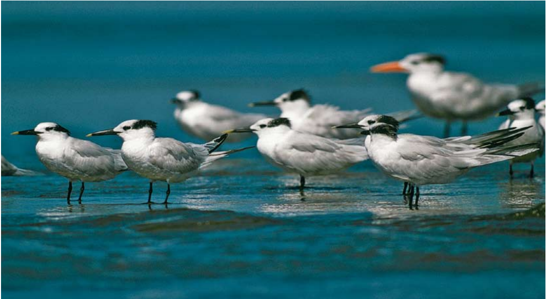
414 American Sandwich Terns / Amerikaanse Grote Sterns Sterna sandvicensis aculavida , adult-winter and first-winter, Dominical, Costa Rica, 12 January 2001

America. London. Ouweneel, G L 1989. Wintering of Sandwich Tern in the Netherlands. Dutch Birding 11: 172-174. Scharringa, J 1979. American Sandwich Tern in the Netherlands.