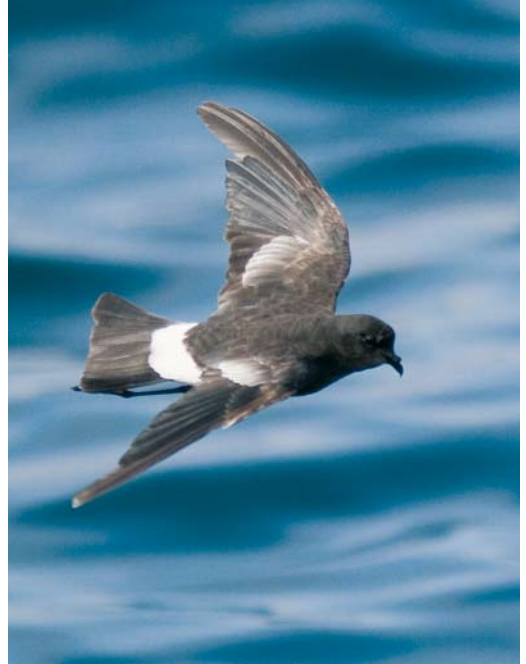
441 Atlantic Yellow-nosed Albatross / Atlantische Geelneusalbatros Thalassarche chlorohynchos, immature, with Greylag Goose / Grauwe Gans Anser anser, Messingham, Lincolnshire, England, 3 July 2007 cf Dutch Birding 29: 242, 2007 442-443 Wilson's Storm-petrel / Wilsons Stormvogeltje Oceanites oceanicus, c 39 km south off Vestmannaeyjar, Iceland, 11 August 2007