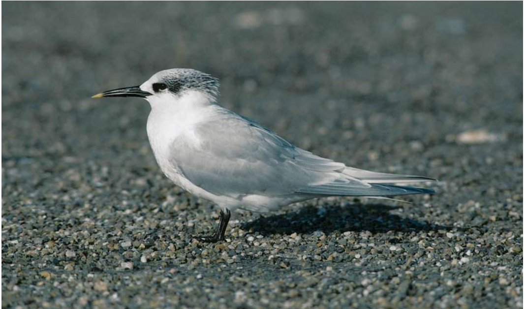
410-411 Sandwich Tern / Grote Stern Sterna sandvicensis sandvicensis , adult-winter, Brouwersdam, Zeeland/Zuid-Holland, Netherlands, 11 February 1989 ( Arie de Knijff ). This individual tests the idea that adult nominate sandvicensis and American Sandwich Tern S. s. acufflavida can be separated in adult plumages. At first glance, white fringes and tips to primaries appear too limited for nominate sandvicensis and, therefore, this bird has in the past been suspected of being vagrant acufflavida . However, with head pattern of 'peppered' black and white rear crown and rather weak-looking decurved bill, overall appearance is more like nominate sandvicensis . Plate 411 offers a more helpful view of outer primaries, showing broader white fringe and tip, which is not as striking as in many nominate sandvicensis but is too marked for most acufflavida . Combined with head pattern and bill shape, identification is resolved.