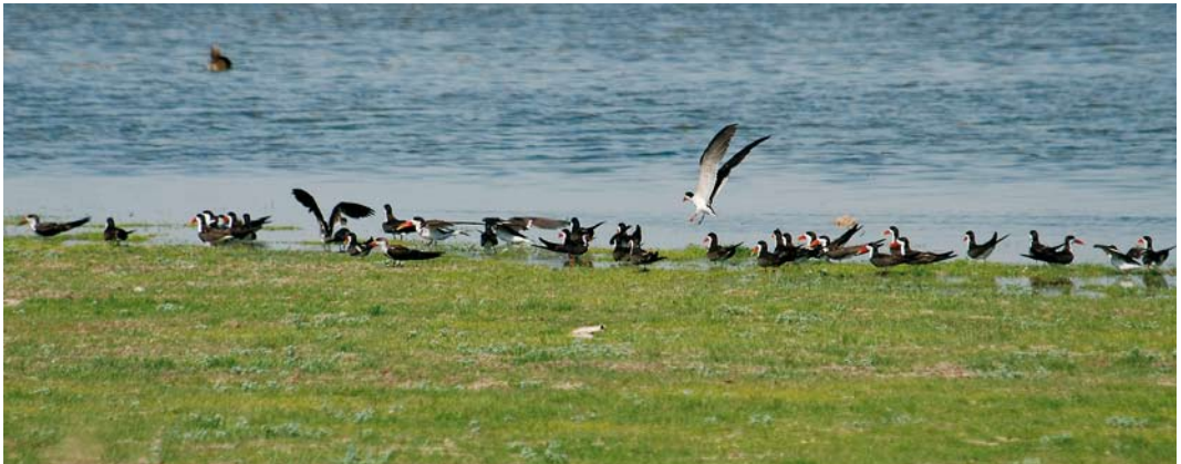
456 American Black Tern / Amerikaanse Zwarte Stern Chlidonias niger surinamensis , adult summer, Funchal harbour, Madeira, 18 August 2007 457 Laughing Gull / Lachmeeuw Larus atricilla , Swibno, near Gdąnsk, Poland, 14 July 2007 458 African Skimmers / Afrikaanse Schaarbekken Rynchops flavirostris , Lake Nasser, Abu Simbel, Egypt, 27 July 2007

at Køge, Sjælland (adult), on 28 July, at Neuwerk, Hamburg, Germany, on 1-2 August, at Oare Marshes, Kent, England, on 10-11 August, at Haversi, Estonia, on 22 August (adult), at Olwersum, Schleswig-Holstein, on 1 September and at Sammy's Point, East Yorkshire, England, on 8 September (adult). The adult at Rockanje, Zuid-Holland, the Netherlands, was not seen after 14 July. The first Hudsonian Godwit Limosa haemastica for the Azores was an adult summer on 25 July at Cabo da Praia, Terceira, where a long-staying Semipalmated Plover C semipalmatus was also present (until at least late September). A female Bar-tailed Godwit L lapponica (E7) fitted with a satellite transmitter at Miranda, Firth of Thames, New Zealand, on 6 February 2007 made world news again when returning to this spot on 7 September after a logged flight of 29 181 km. On 17 March, it first went 10 219 km to Yalu Jiang, China, near the border of North Korea, where it arrived on 24 March after flying 181 h non-stop; it then departed on 1 May to reach