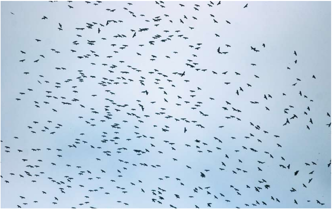
433 Broad-winged Hawks / Breedvleugelbuizerds Buteo platypterus , Veracruz, Mexico, 1 October 2004 434 Hawkwatch tower, Chichicaxtle, Veracruz, Mexico, 11 October 2003 435 Swainson's Hawks / Prairiebuizerds Buteo swainsoni , Chavarrillo, Mexico, 8 April 2005