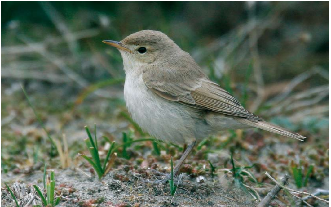
469 Booted Warbler / Kleine Spotvogel Acrocephalus caligatus , first-year, Maasvlakte, Zuid-Holland, Netherlands, 14 September 2007