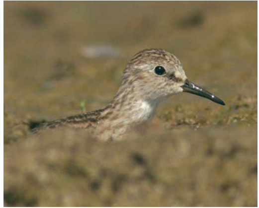
Mystery photograph X (December)

the entire length of the tail-feather, as shown by the mystery bird, is never shown by Eastern Imperial and the bird, therefore, must be a Steppe Eagle.